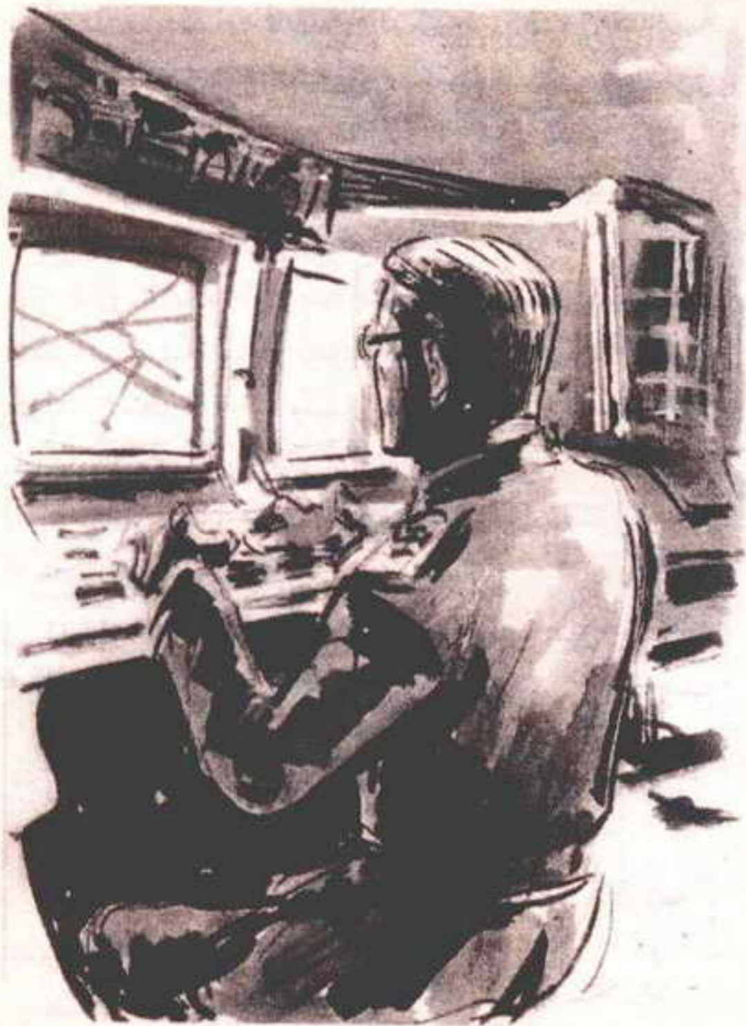
اختفت الشاشة لحظة ، ثم ارتسمت فوقها خريطة كاملة لشبكة أنفاق المترو ..

اختفت الشاشة لحظة ، ثم ارتسمت فوقها خريطة كاملة لشبكة أنفاق المترو ، مع تحديد مسارات العربات ، واتجاهاتها ، وحتى أسعار التذاكر المختلفة . ولدقيقة أو يزيد ، راح ( هولدشتاين ) يتطلع إلى الخريطة ، ثم لم يلبث أن غمغم :