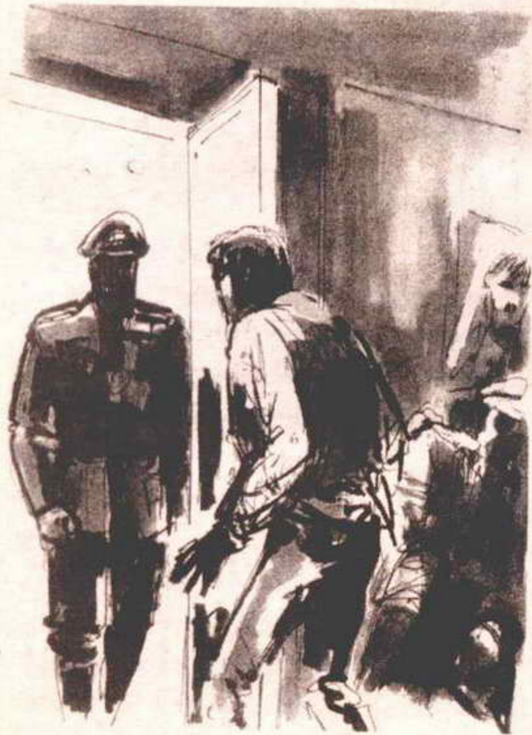
وفجأة ، انفتح الباب ، قبل أن يبلغه (أكرم) بلحظة واحدة ..

وفجأة ، انفتح الباب ، قبل أن يبلغه ( أكرم ) بلحظة واحدة ..