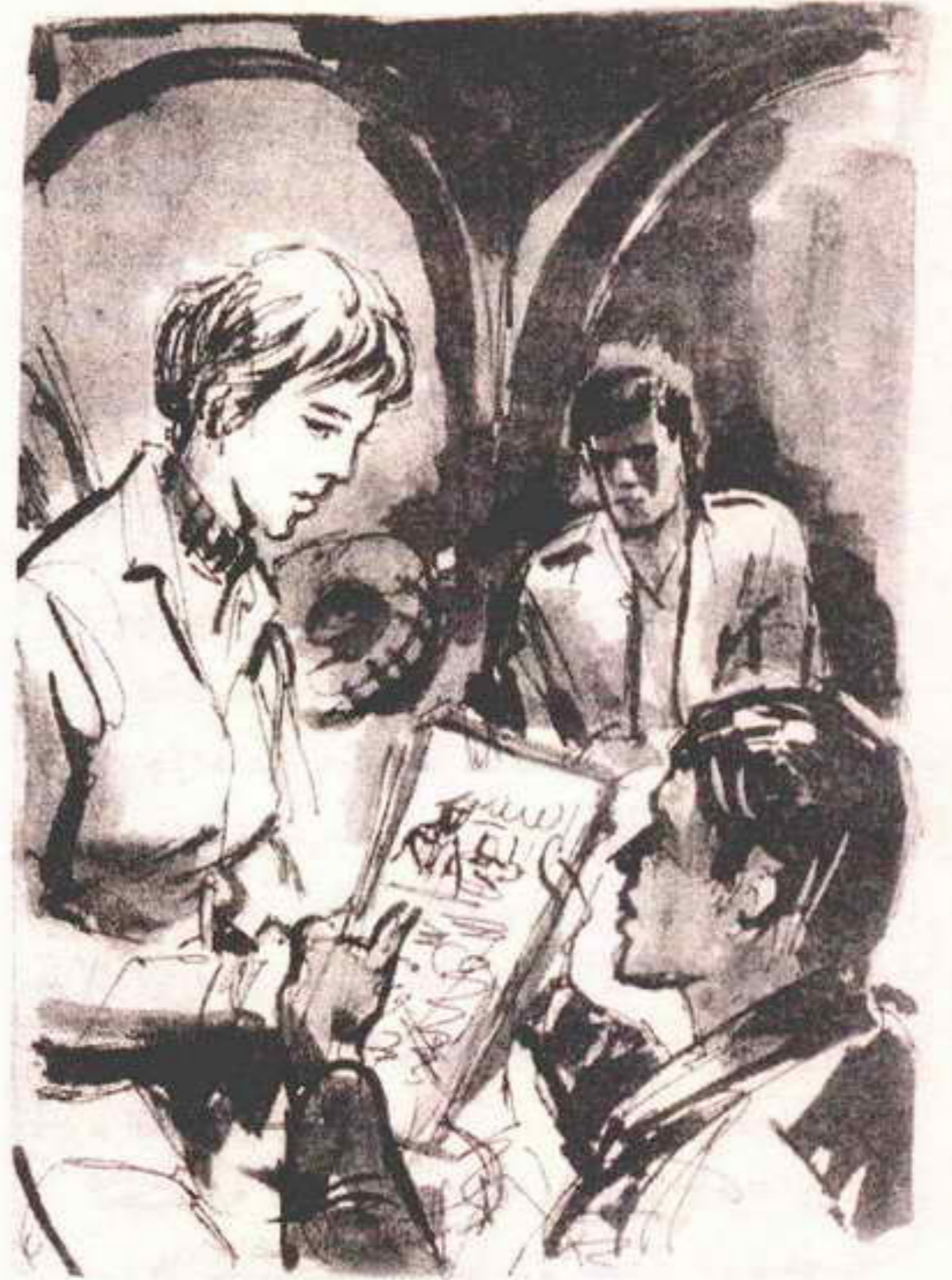
قرأ (طارق) الخبر فى اهتمام شديد ، ثم أشار إلى صورة (هولداشتاين) ، قائلاً : - أهذا هو !؟ ..

- أراهن على أن نشر الخبر جزء من فخ كبير ، أعدوه لنا ، إذا ما حاولنا السعي لإنقاذ رفيقكما . أجابه ( طارق ) فى هدوء : - ليس لدى أدنى شك فى هذا . أضاف ( نور ) فى سرعة : - ولكننا لن نتخلى عن ( أكرم ) . تبادل رجال المقاومة نظرة متوترة ، قبل أن يقول ( آلان ) فى حزم : - يوسفنى أن أقول هذا يا ( نور ) ، ولكننا لن نتعاون معكم فى هذا الشأن . أجاب ( نور ) : - خطأ يا ( آلان ) .. لا بد أن نتعاون جميعاً ؛ لمواجهة ( هولداشتاين ) . قال أحد رجال المقاومة فى حدة : - كلاً يا رجل المستقبل .. إنها قضيتكما وليست قضيتنا .. إننا نعلم أن ( هولداشتاين ) قد أعد لنا فخاً ، ولن نلقى أنفسنا فيه بهذه البساطة . قال ( طارق ) بنفس الهدوء : - ستكون هناك خطة بالتأكيد .