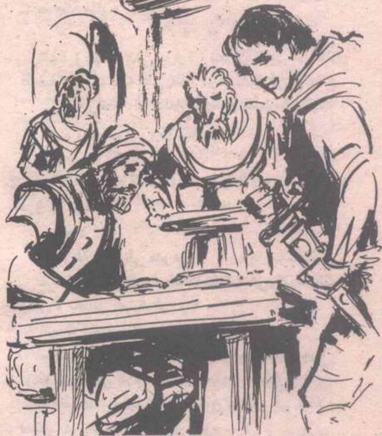
هرع نحوهما زوج ( راشيل ) ، وهو يحمل صينية كبيرة ، وفوقها

- لا بأس من رشفة أو رشفتين .. مم يتكوّن هذا الشراب يا رجل ؟