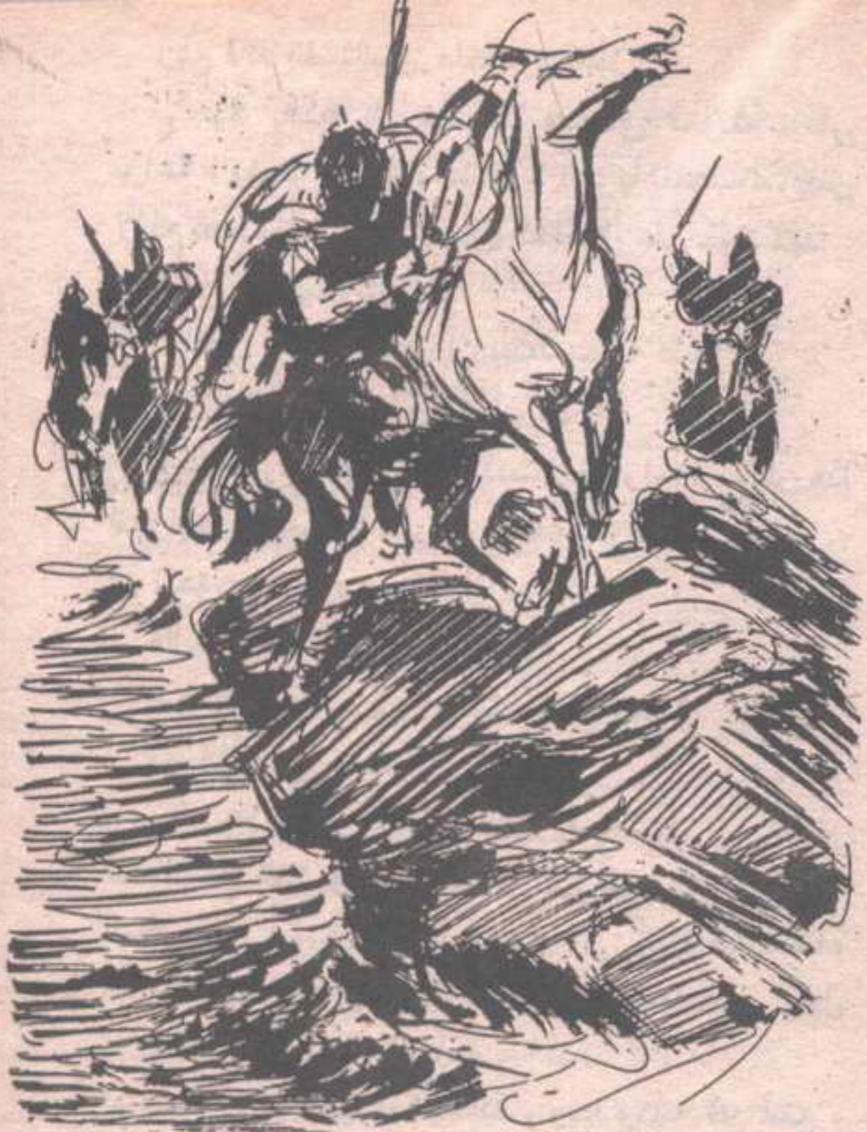
كان ( فارس ) يثب بجواده ، من فوق المرتفع الصخري ، عندما