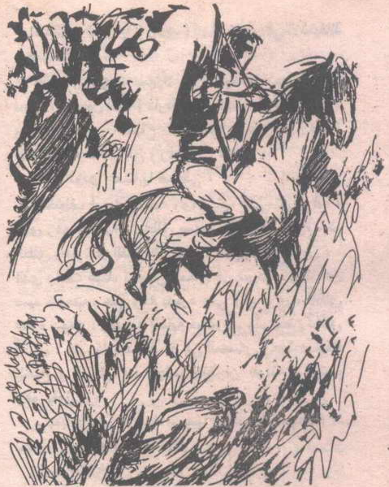
وقع بصره على أرنب برى ، فاطلق نحوه سهمه ، وأصابه إصابة

ضحك ( مهاب ) وهو يقول : - فى هذه الحالة ، أيمكننى أن ألتهم نصيبك ؟ هتف ( فارس ) مداعبًا : - يا لك من نهم ! صاح ( مهاب ) : - نهم ؟!.. من يجرو على قول هذا ؟.. ستدفع الثمن يا ( فارس ) . واستل سيفه ، ووثب نحو ( فارس ) ، الذى تراجع فى مهارة ، وهو يقول : - إذن فأنت تباغتتى ! ثم قفز فى خفة ، متفادياً سيف ( مهاب ) ، والتقط سيفه من أمام خيمته ، مستطرذاً : - خابت خطتك إذن . تلاقى سيفاهما ، وتعالى صليلهما ، وهما يتحاوران ويتاوران ، والشيخ يراقبهما بابتسامة هائلة ، متمتماً فى خفوت شديد : - أحسنت يا ( فارس ) .. أحسنت يا ولدى . كان ( مهاب ) مقاتلاً صنديداً ، وخبيراً لا يشق له غبار ، فى المبارزة والنزال ، إلا أن ( فارس ) كان أكثر شباباً ، وأخف حركة ، مما منحه نقطة تفوق ، جعلت ( مهاب ) يهتف فجأة :