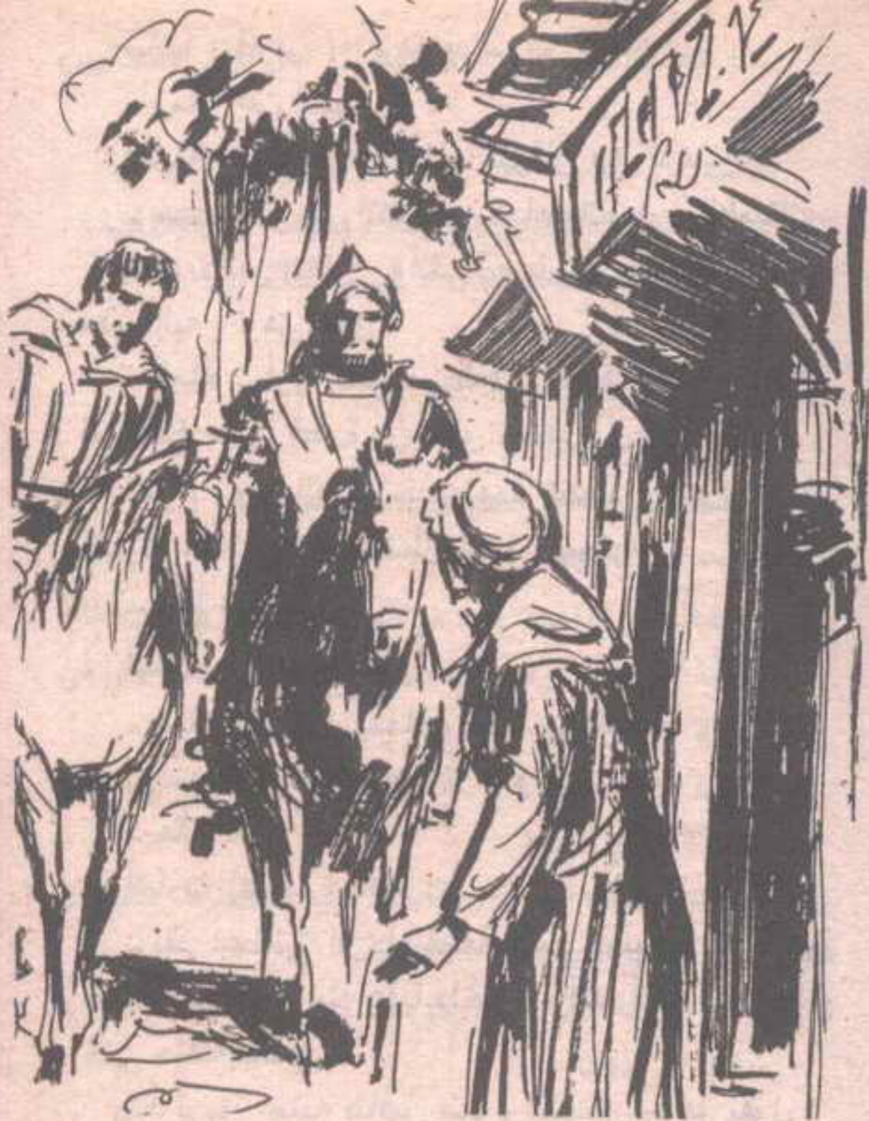
توقفوا عند الخان ، واستقبلتهما صاحبة اليهودية في سوقية ..