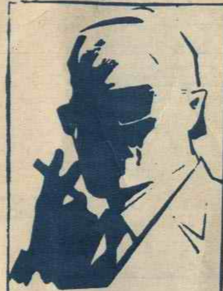
رقم صفر الزعيم الفلطي الذي لا يعرف حقيقة احد ..