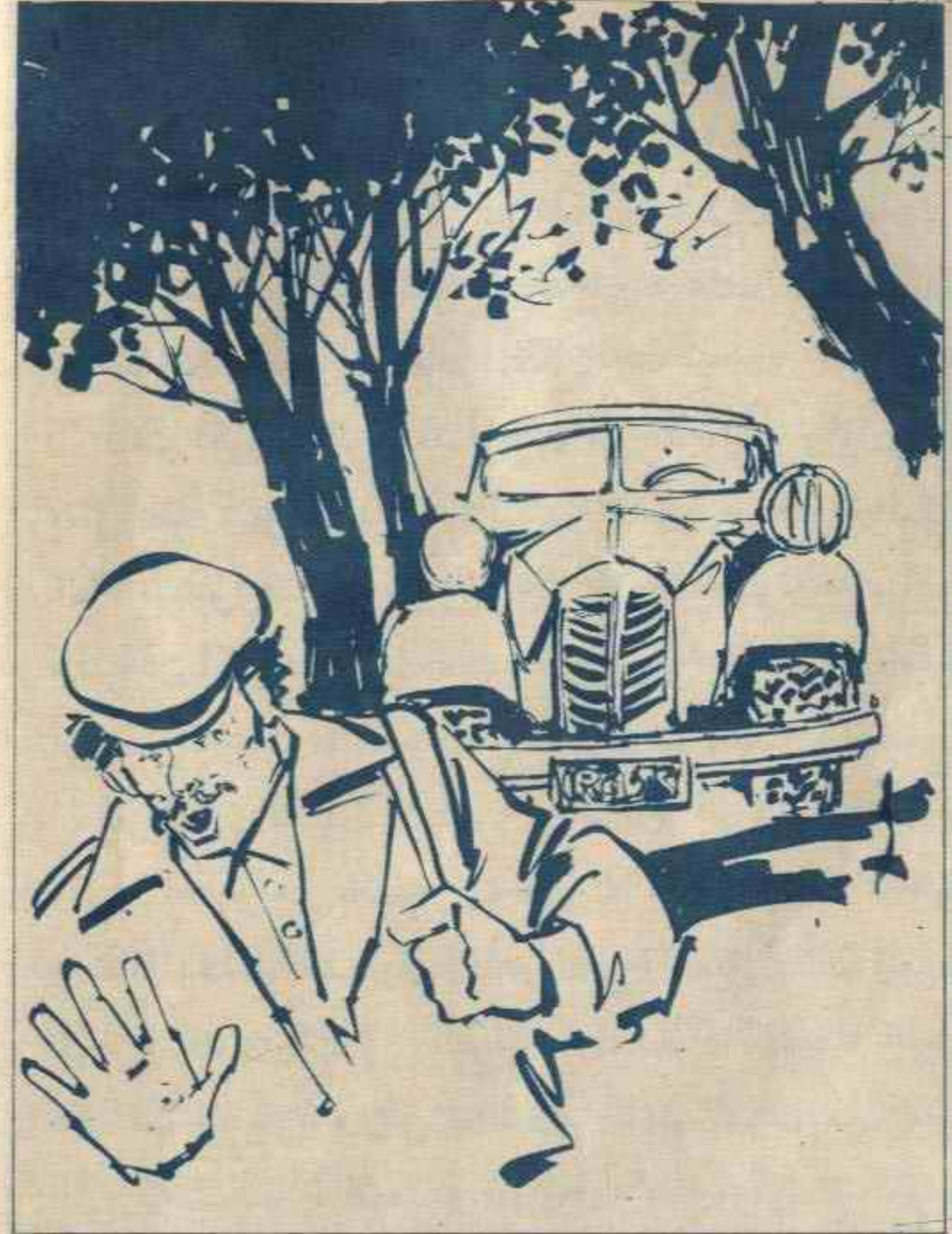
وقفت سيارة الشياطين ، وقفزوا منها بسرعة قبل أن يتمكن أى من رجال العصابة من الحركة .

ثم اندفع بها فى اتجاه الحراس مباشرة ، كانوا يرفعون أيديهم إشارة للوقوف ، لكنه لم ينتظر ، ولم يكن أمام الحراس ، إلا أن يلقوا بأنفسهم بعيداً عن طريقه ، خوفاً من أن يصدمهم . فى نفس الوقت ، تجاوزت السيارة البوابة ، وكانت سيارة العصابة تظهر أمامهم فى الليل ، لكن المسافة بين السيارتين كانت بعيدة .