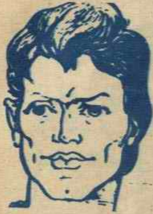
جان يساوى ٢٠٠ ألفاً!

أوى الشياطين إلى فراشهم فى المقر السرى ، وهذا كل شئ غير أن « أحمد » لم يكن قد نام بعد ، فقد كان يقرأ فى كتاب عن الأسرار الحربية للحرب العالمية الثانية . كان الكتاب يقع فى ثلاثمائة صفحة ، وعلى غلافه الأسود ، كان يلمع اسم الكتاب « أسرار مجهولة .. فى الحرب الثانية » كان « أحمد » قد قطع شوطا كبيرا فى القراءة ، ولأن المعلومات التى يضمها الكتاب كانت مثيرة فإنه لم يكن يشعر بالرغبة فى النوم ، غير أن عينه لمحت ساعة الأليكترونية بجوار السرير وكانت تشير إلى الثانية صباحا . قال فى نفسه : إن الوقت قد تأخر ، وهذا يعنى أنى ربما