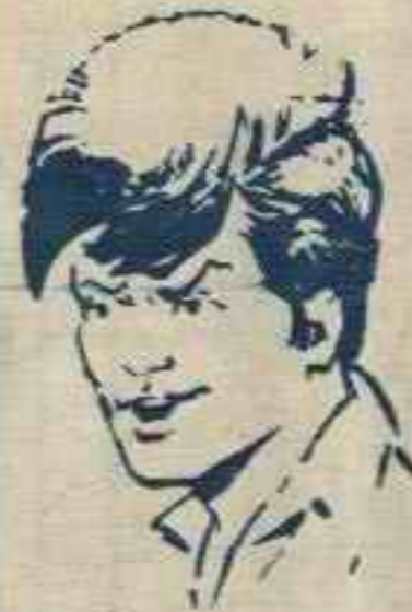
رقم ٥ - بومر من الجزائر