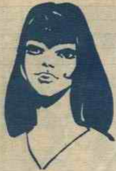
رقم ٢ - الهام من لبنان