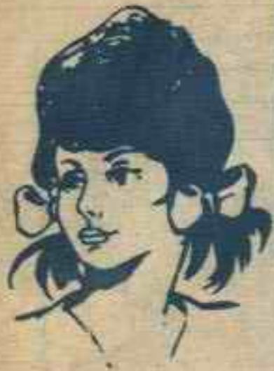
رقم ٤ - هدى من القرب