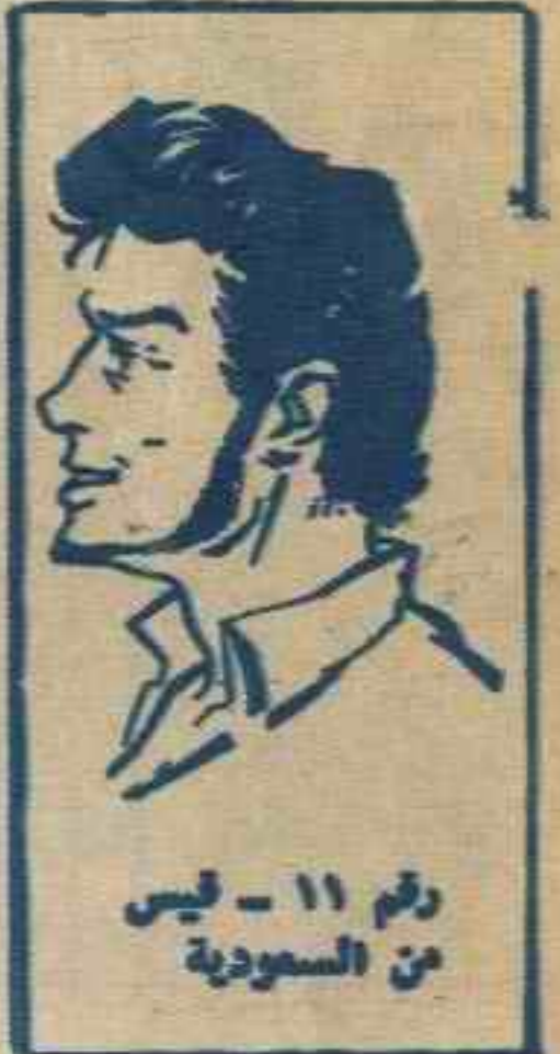
رقم ١١ - فليس من السعودية