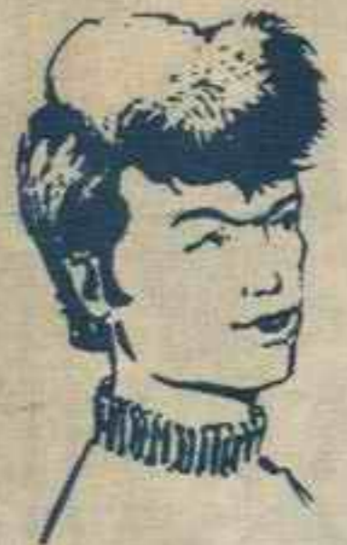
رقم ٦ - مصباح من ليبيا