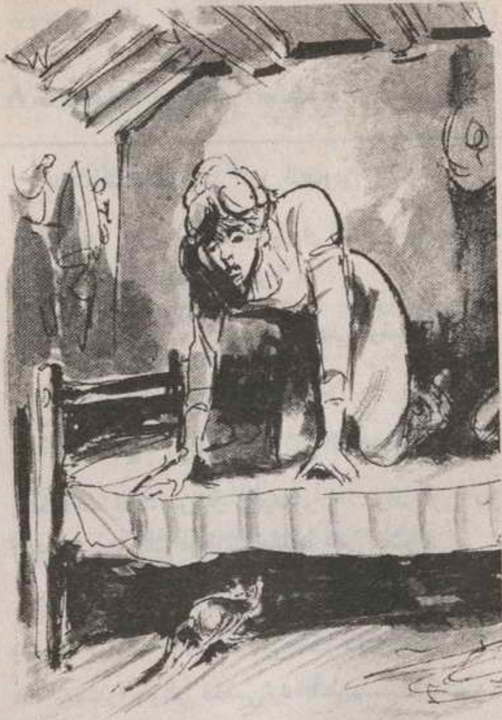
دوى صراخها حين لمحت الذيل الأسود يتلوى هناك تحت الفراش ..