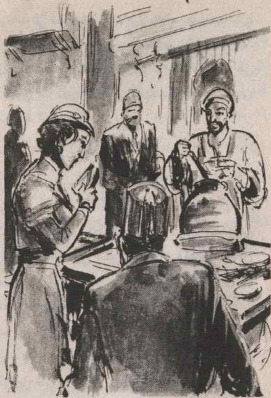
وكانت تعرف أن ثقافة هؤلاء الواقفين لا تسمح لهم بإدراك الفارق بين الكنتين ..