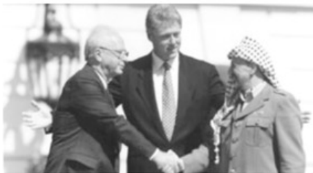
- اتفاق غزة - أريحا بين عرفات و رابين -

بعد مؤتمر مدريد، بدأت المفاوضات السرية بين منظمة التحرير وإسرائيل عام ١٩٩١ أفرزت اتفاقاً وقعه ياسر عرفات ورئيس الوزراء الإسرائيلي آنذاك إسحق رابين عام ١٩٩٣، فكانت نتائج الاتفاق أن أجزاء من مناطق الضفة الغربية وقطاع غزة، بدءاً بمدنيتي غزة وأريحا ستنتقل إلى سيطرة فلسطينية هي السلطة الوطنية الفلسطينية، بالإضافة إلى الاعتراف بحدود دولة إسرائيل على الحدود التاريخية لفلسطين. وفي عام ١٩٩٤، وقع ياسر عرفات وإسحق رابين في القاهرة اتفاقاً لتطبيق الحكم الذاتي في غزة وأريحا بما عرف باسم اتفاق القاهرة وينظر إلى هذه الاتفاقيات على أن شرعيتها مأخوذة من الاتفاقيات الثنائية بدلا من القرارات الدولية من هيئة الأمم المتحدة.