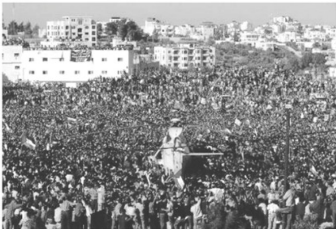
- مئات الآلاف من الفلسطينيين يشيعون "عرفات" إلى قبره -

١١ نوفمبر ٢٠٠٤م، وتم تشييع جنازته في باريس والقاهرة ورام الله وقد دفن في مبنى المقاطعة في مدينة رام الله حيث عاش أيام الحصار الإسرائيلي، وذلك بعد الرفض الشديد من قبل الحكومة الإسرائيلية لدفن عرفات في مدينة القدس كما كانت رغبة عرفات قبل وفاته. وقد احتشد مئات الآلاف من الفلسطينيين في حشد يعد من أكبر الحشود في التاريخ لإلقاء النظرة الأخيرة عليه قبل دفنه رحمه الله تعالى.