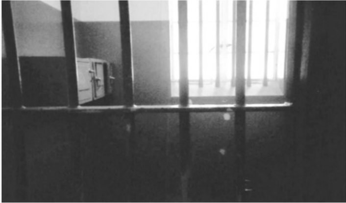
- الزنزانة التي قضى فيها مانديلا ربع قرن من الزمن -

خلال سنوات سجنه الستة والعشرين، أصبح النداء بتحرير مانديلا من السجن رمزاً لرفض سياسة التمييز العنصري. ووضعت جماعات عدة من السود إطلاق سراح مانديلا شرطاً لأي مفاوضات جادة تتعلق بمستقبل البلاد. وفي عام ١٩٨٥م وافقت الحكومة على إطلاق سراحه شريطة أن يلتزم بنبذ العنف كوسيلة سياسية، لكنه رفض. لذلك بقي مانديلا في السجن لغاية ١١ فبراير ١٩٩٠ عندما أثمرت ماثرة المجلس الإفريقي القومي، والضغطات الدولية عن إطلاق سراحه بأمر من رئيس الجمهورية فريديريك كلارك الذي أعلن إيقاف الحظر الذي كان مفروضاً على المجلس الإفريقي. وقد شارك نيلسون مانديلا مع الرئيس فريديريك كلارك في عام ١٩٩٢ في الحصول على جائزة نوبل للسلام.