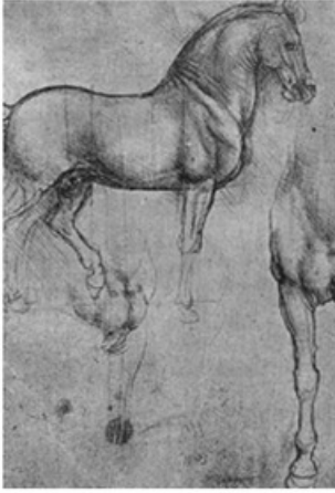
- رسم لعضلات الحصان قام بها دافينشي -

التصوير الجصي. ولم يكن يقلد الأساليب القديمة بل كان يبحث دائماً عن أساليب جديدة، وقد كلفه بحثه هذا كثيراً، لأن بعض لوحاته الجصية الضخمة كانت تتساقط ألوانها قبل أن يكملها .