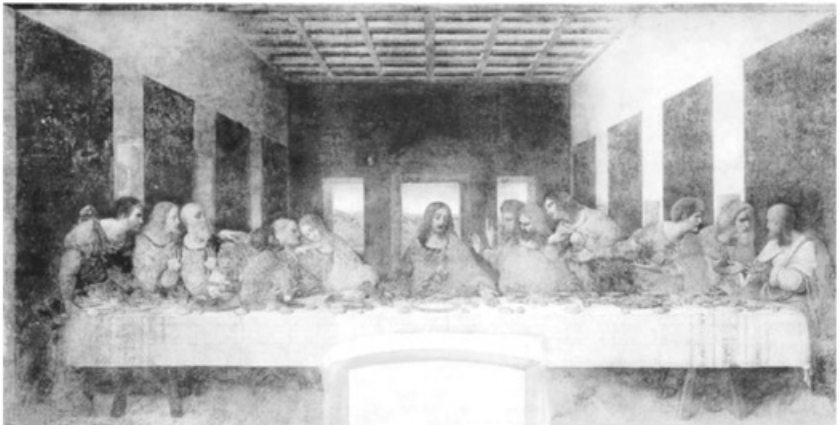
- لوحة (العشاء الأخير) التي صور بها دافينشي السيد المسيح -عليه السلام- ورفاقه الاثني عشر في ما يسمى عند النصارى بالعشاء الأخير، وهي أحد أشهر لوحات دافينشي وأكثرها إثارة للجدل -

- مات ليوناردو في امبواز في الثاني من مايو سنة ١٥١٩م.