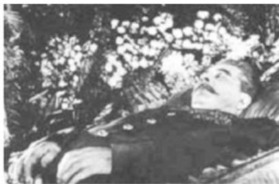
- جثة ستالين داخل متحف لينين -

في الأول من مارس ١٩٥٣، وخلال مأدبة عشاء بحضور وزير الداخلية السوفييتي "بيريا" و"خوروشوف" وآخرون، تدهورت حالة ستالين الصحية ومات بعدها بأربعة أيام، ولم يعلن الأطباء خبر موته مباشرة، بل انتظروا فترة ليست بالقصيرة؛ وذلك خشيةً من أن يكون في غيبوبة وسيستيقظ منها... ويعرفون جميعاً مصير الذي يعلن وفاته وهو لا يزال على قيد الحياة!