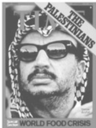
- عرفات على غلاف مجلة التايم -

وفي العام ١٩٩٢ تتعرض طائرة عرفات لحادث فوق الأراضي الليبية بسبب عاصفة صحراوية فيقتل ثلاثة من أفراد الطاقم في الحادث وينجو عرفات بأعجوبة.