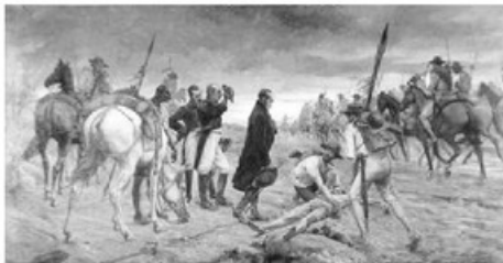
- جيش التحرير بقيادة بوليفار يتوقف لمساعدة المصابين من أفراده -

بدولة كولومبيا ودولة فنزويلا. وانضمت بنما إلى الجمهورية عام ١٨٢١م وانضمت الإكوادور عام ١٨٢٢م، وأصبح بوليفار الرئيس الأول للجمهورية في ١٧ ديسمبر عام ١٨١٩م.