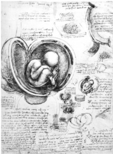
- دراسات الجنين التي قام بها دافينشي -

وقام بتصوير بعض لوحاته المعروفة من مثل، عذراء الصخور (١٤٨٥) ولاتزال باقية إلى اليوم دون أي تغيير يُذكر.