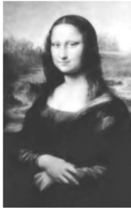
- لوحة موناليزا، أشهر أعمال دافينشي -

- مات ليوناردو في امبواز في الثاني من مايو سنة ١٥١٩م.