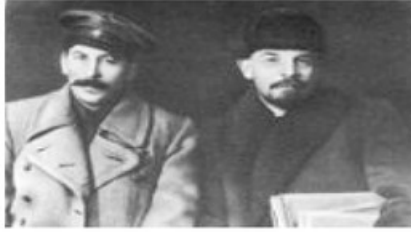
- صورة تجمع ستالين ولينين في مارس ١٩١٩م -

تهديد لحكمه . وكان مسؤولاً أيضاً عن موت كثير من الفلاحين السوفييت الذين عارضوا برنامج الزراعة التعاونية الذي يقوم على تأميم المزارع واستبدال الحقول الزراعية البدائية بحقول زراعية ذات تجهيزات حديثة، ويجبر الإقطاعيين ببيع غلاتهم الزراعية على الحكومة بسعر تحدده الحكومة نفسها، بينما يأخذ الفلاح أجره على قدر جهده، وقد أدت تبعات سياسته هذه إلى حدوث المجاعة التي أمتت بالاتحاد السوفييتي بين الأعوام ١٩٣٢ و ١٩٣٣ والتي راح ضحيتها ما يقرب من ٥ ملايين روسي.