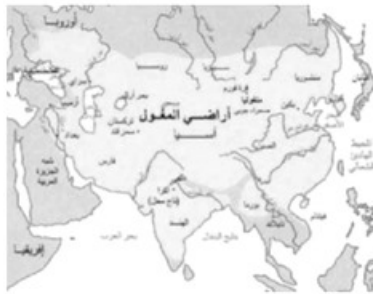
- الإمبراطورية المغولية في أقصى اتساع لها -

قاموا وأبناؤهم بخمس حملات عسكرية، وأسسوا دولة هان المنغولية التي امتدت من آسيا إلى أوروبا، كما قام هولوكو المغولي بغزو بغداد عاصمة الخلافة العباسية عام ٦٥٦هـ/١٢٥٨م، وجعلت جيوشه مياه دجلة زرقاء أو حمراء من كثرة رمي الكتب فيها، وسفك الدماء. ثم أصبح المغول مسلمين فيما بعد وأسسوا سلالات مشهورة حكمت الهند لزمان طويل، وتعاقت الإمبراطوريات والدول المغولية لمئات السنين بعد ذلك حتى احتلت بريطانيا الهند في القرن التاسع عشر وأزالت آخر الممالك المغولية.