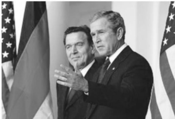
- شرودر مع الرئيس الأميركي جورج بوش -

وفي هذا الموضوع كتب اندريسان بيتسولد رئيس تحرير مجلة شتيرن اليسارية: "ما جعل شرودر شبه مخلد هو سياسته الخارجية، فقد أضر بقيادة وسلطة الولايات المتحدة الدولة العظمى بقوله "لا لحرب العراق".