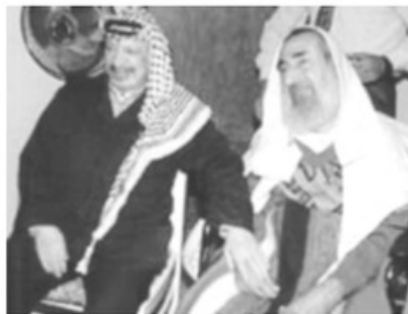
- الشيخ ياسين مع الرئيس عرفات "رحمهما الله" -

وخلال انتفاضة الأقصى التي اندلعت نهاية سبتمبر ٢٠٠٠، شاركت حركة "حماس" بزعامة أمير الشهداء الشيخ ياسين في مسيرة المقاومة الفلسطينية بفاعلية بعد أن أعادت تنظيم صفوفها، وبناء جهازها العسكري، حيث تتهم سلطات الاحتلال الصهيوني "حماس" تحت زعامة ياسين بقيادة المقاومة الفلسطينية، وظلت قوات الاحتلال الصهيوني تحرض دول العالم على اعتبارها حركة إرهابية وتجميد أموالها، وهو ما استجابت له أوروبا حينما خضع الاتحاد الأوروبي عام ٢٠٠٣ للضغوط الأمريكية والصهيونية وضمت الحركة بجناحها السياسي إلى قائمة المنظمات الإرهابية.