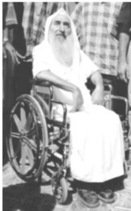
- المقعد الذي أعجز إسرائيل -

وفي ١٣/١٢/١٩٩٢ قامت مجموعة فدائية من مقاتلي كتائب الشهيد عزالدين القسام بخطف جندي صهيوني وعرضت المجموعة الإفراج عن الجندي مقابل الإفراج عن الشيخ أحمد ياسين ومجموعة من المعتقلين في السجون الصهيونية بينهم مرضى ومسنون ومعتقلون عرب اختطفتهم قوات صهيونية من