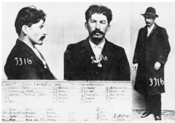
- بطاقة سجين خاصة بـستالين مأخوذة من ملفات الشرطة القيصريّة السرية في سانت بطرسبورغ

الحزب الشيوعي الحاكم والدوائر المتعددة التابعة للحزب. وفي العام ١٩٢٢، تقلد ستالين منصب الأمين العام للحزب الشيوعي، وحرص ستالين على أن يتمتع منصب الأمين العام بأوسع أشكال النفوذ والسيطرة. بدأ القلق يدب في لينين المحتضر من تنامي قوة ستالين، ويُذكر أن لينين طالب بإقصاء "الوقح" ستالين في أحد الوثائق إلا أن الوثيقة تم إخفاؤها من قبل اللجنة المركزية للحزب الشيوعي.