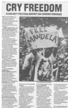
- الصحف تتناقل أخبار ألوف الجنوب إفريقيين الذين تظاهروا مطالبين بإطلاق سراح مانديلا -