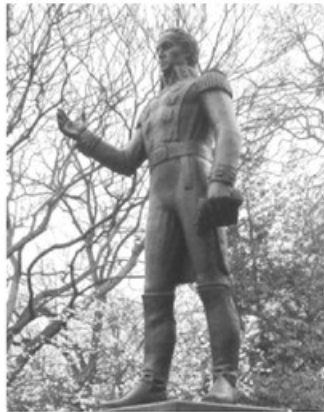
- تمثال بوليفار ينتصب في ميدان يحمل اسمه في لندن -

أصيب بوليفار باليأس من عدم قيام الاتحاد الذي حلم به، وشعر أنه عقبة في سبيل السلام؛ فاستقال من منصبه في إبريل عام ١٨٣٠م، وغادر البلاد بناءً على دعوة أحد الإسبان المعجبين به حيث توفي هناك في ديسمبر من العام نفسه، وهذه تعد مفارقة عجيبة، أن يموت الرجل الذي قضى حياته في محاربة الإسبان في بيت إسباني!