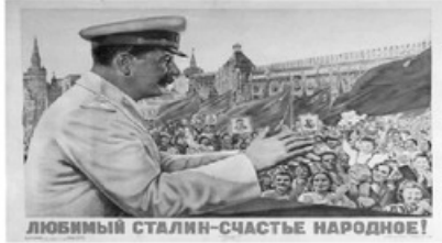
- ملصق يوضح جانب من الدعاية السياسية التي انتهجها ستالين، كتب فيه: 'ستالين المحبوب يشكر من قبل الشعب' -

وكفطاء قانوني مفضوح رتب ستالين لعقد المحاكمات الهزلية في العاصمة موسكو لتكون قدوة لباقي المحاكم السوفييتية. فكانت المحاكم الهزلية غطاءً سمجاً لتنفيذ أحكام الإبعاد أو الإعدام بحق خصوم ستالين تحت مظلة القانون! ولم يسلم "تروتسكي"، رفيق درب ستالين من سلسلة الاغتيالات الستالينية إذ