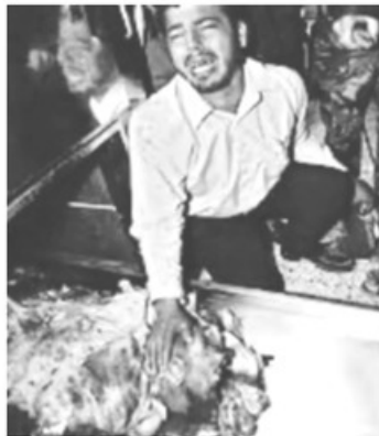
- جثة الشيخ 'الطاهرة' بُعيد الجريمة الإسرائيلية -

استشهد الشيخ أحمد ياسين، وهو يبلغ الخامسة والستين من عمره، بعد مغادرته مسجد المجمع الاسلامي الكائن في حي الصّبرة في قطاع غزة، وأدائه