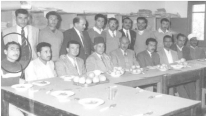
- الشيخ ياسين أثناء عمله مدرساً عام ١٩٦٠م -

اعتنق الشيخ أفكار جماعة الإخوان المسلمين التي تأسست في مصر عام ١٩٢٨م والتي تدعو إلى فهم صحيح للإسلام وتطبيق مبادئه في مناحي الحياة كافة وفق ما تذكر أدبياتها. اعتقلته السلطات المصرية في عام ١٩٦٥م لمدة شهر واحد.