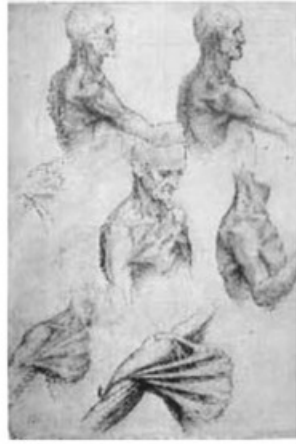
- رسم تشريحي لعضلات الإنسان قام بها دافينشي -

ومن مظاهر التجديد عنده اختيار التكوينات الجديدة وعدم نقل المواضيع القديمة بالطريقة التي توارثها الفنانون من قبله. وقد استقر ليوناردو دافينشي في فرنسا منذ عام ١٥١٧م وحتى وفاته لأن الملك فرانسيس الأول ملك فرنسا كان قد دعاه للبقاء هناك رغبة منه في أن يكون في بلاطه عباقرة عصر النهضة في المجالات شتى.