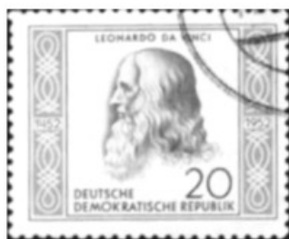
- طابع يحمل صورة دافنشي -