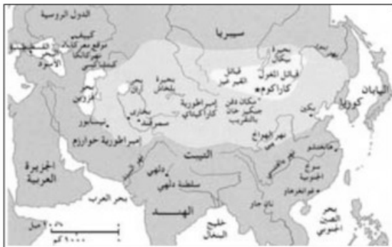
- إمبراطورية جنكيز خان في أثناء وفاته -

و في ١٢١٨م، أوقف جنكيز خان هجومه على الصين واكتسح أواسط آسيا. وسحق مملكة خوارزم التي هي الآن أوزبكستان وتركمانستان. في عام ١٢٢٠م، دمر مدينتي بخارى وسمرقند (الآن في أوزبكستان) ونيسابور في إيران. كما هاجم جيشان صغيران تابعان له السهول شمالي بحر قزوين، وبينهاية عام ١٢٢٢م، استولى على كبتشاكس، وهزم الروس على نهر كلكا.