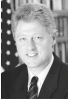
- بيل كلينتون -