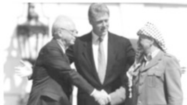
- اتفاق غزة - أريحا بين عرفات ورايين، ويظهر كلنتون -

ووقعت الاتفاقية في المرح الجنوبي في البيت الأبيض يوم الإثنين ١٣/ أيلول، وفي اليوم الثاني وقّع الدبلوماسيون الإسرائيليون والفلسطينيون اتفاقية قرّبتهم من السلام النهائي، وتعهّد رجال الأعمال من اليهود في وزارة الخارجية والأمريكيين العرب بالاستثمار في فلسطين، عندما يتحقق السلام، مما يسمح بتطوير اقتصاد مستمر.