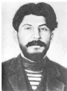
- وفي عام ١٩١٢م -

كان والده إسكافياً فقيراً يدمن الخمر، ويكثر من ضرب ابنه الصغير بقسوة. وعندما أصبح ستالين في الحادية عشرة من عمره توفي والده تاركاً عائلته الفقيرة بلا معيل. فقامت الأم بإرسال ابنها إلى المدرسة الروسية للمسيحية الأرثوذكسية التي طرد منها عام ١٨٩٩ لنشره المبادئ الثورية، ومن ذلك الوقت انتظم ستالين ولفترة ١٠ سنوات في العمل السياسي الخفي وتعرض للاعتقال، بل - ستالين مراهقاً عام ١٨٩٤م- والإبعاد إلى "سيبيريا" بين الأعوام ١٩٠٢ إلى ١٩١٧، اعتنق ستالين المذهب الفكري لـ "فلاديمير لينين"، وتأهّل لشغل منصب عضو في اللجنة المركزية للحزب البلشفي في عام ١٩١٢م.