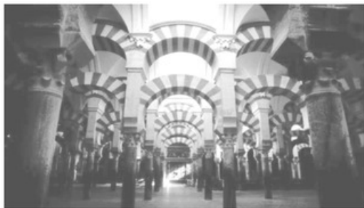
- جامع قرطبة الشهير الذي أمر ببنائه عبدالرحمن الداخل -

كان عبدالرحمن حازماً، سريع النهضة في طلب الخارجين عليه، كثير المشورة، شجاعاً، شديد الحذر، سخياً، لسنأ، شاعراً، عالماً وكان ينظر في المظالم بنفسه وينصف الضعيف من القوي. بنى الرصافة بقرطبة تشبهاً بجده هشام باني رصافة الشام. زين قرطبة بالمباني الفخمة والحدائق الغناء. وبدأ بإنشاء جامع قرطبة الكبير، الذي أكمله من بعده ابنه، وفاخرت به قرطبة عواصم العالم، وقبره به حتى الآن.