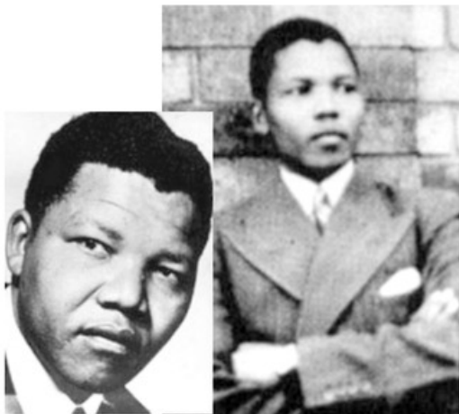
- مانديلا في مرحلة الشباب -

وفي التاسعة عشرة من عمره توجه إلى دراسة البكالوريوس في جامعة فورت هار. ولكنه فصل من الجامعة، مع رفيقه أوليفر تامبو، عام ١٩٤٠ بتهمة الاشتراك في إضراب طلابي. إلا أن مانديلا تابع دراسته بالمراسلة من مدينة جوهانسبورغ، وحصل على الإجازة في الحقوق من جامعة ويتواترساند. وبعد تخرجه افتتح مانديلا مكتباً قانونياً ليصبح بذلك أول مواطن أسود يفتح مكتباً قانونياً في جنوب إفريقيا، وكان ذلك بالاشتراك مع أوليفر تامبو عام ١٩٥٢م.