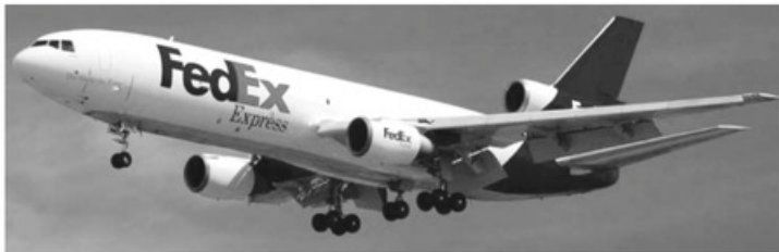
- إحدى طائرات أسطول شركة فيداكس -

وهكذا فإن الفكرة المتواضعة أصبحت فكرة عملاقة، استفاد منها ملايين البشر، وغيرت حتى في اقتصاد الكثير من الدول، لأن كل شيء أصبح أسرع. والسخرية من عدم إمكان التوصيل في يوم واحد داخل الولايات المتحدة أصبحت واقعا غير شكل المعاملات التجارية والطريقة التي يعمل بها الناس.