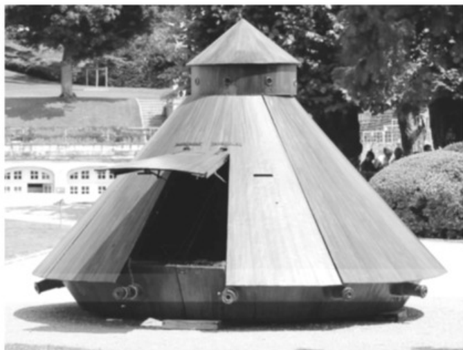
- مدركة من تصميم دافنشي -