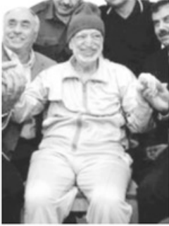
- عرفات في مرحلة مرضه -

في يوم الثلاثاء ١٢ أكتوبر ٢٠٠٤ ظهرت أولى علامات التدهور الشديد لصحة ياسر عرفات، فقد أصيب عرفات كما قرر أطباؤه بمرض في الجهاز الهضمي، وقبل ذلك بكثير، عانى عرفات من أمراض مختلفة، منها نزيف في الجمجمة ناجم عن حادثة طائرة، ومرض جلدي (فتيلينغو)، ورجعة عامة عولجت بأدوية في العقد الأخير من حياته، والتهاب في المعدة أصيب به