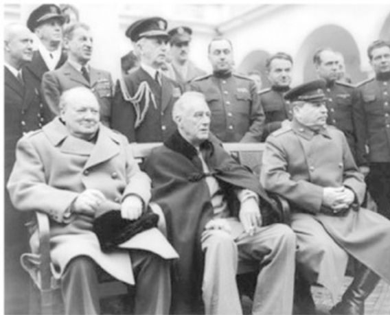
- الثلاثة الكبار في أثناء اجتماعهم في الحرب العالمية الثانية، وهم ستالين وروزفلت وتشرشل -

عُرِفَت السياسات التي سادت بين المعسكرين الشرقي والغربي خلال السنوات الأخيرة من حكم ستالين للاتحاد السوفيتي السابق بـ"الحرب الباردة" التي اتحدت فيها عدة بلدان غير شيوعية لوقف انتشار الشيوعية. لم يكن ستالين يملك شيئاً من السحر الشخصي، وكان قاسياً حتى على أصدقائه المقربين، ولم يكن يقبل النقد كما لم يكن يصفح عن أي معارض له .