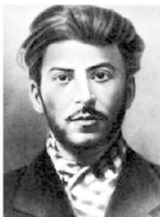
- ستالين عام ١٩٠٢م -