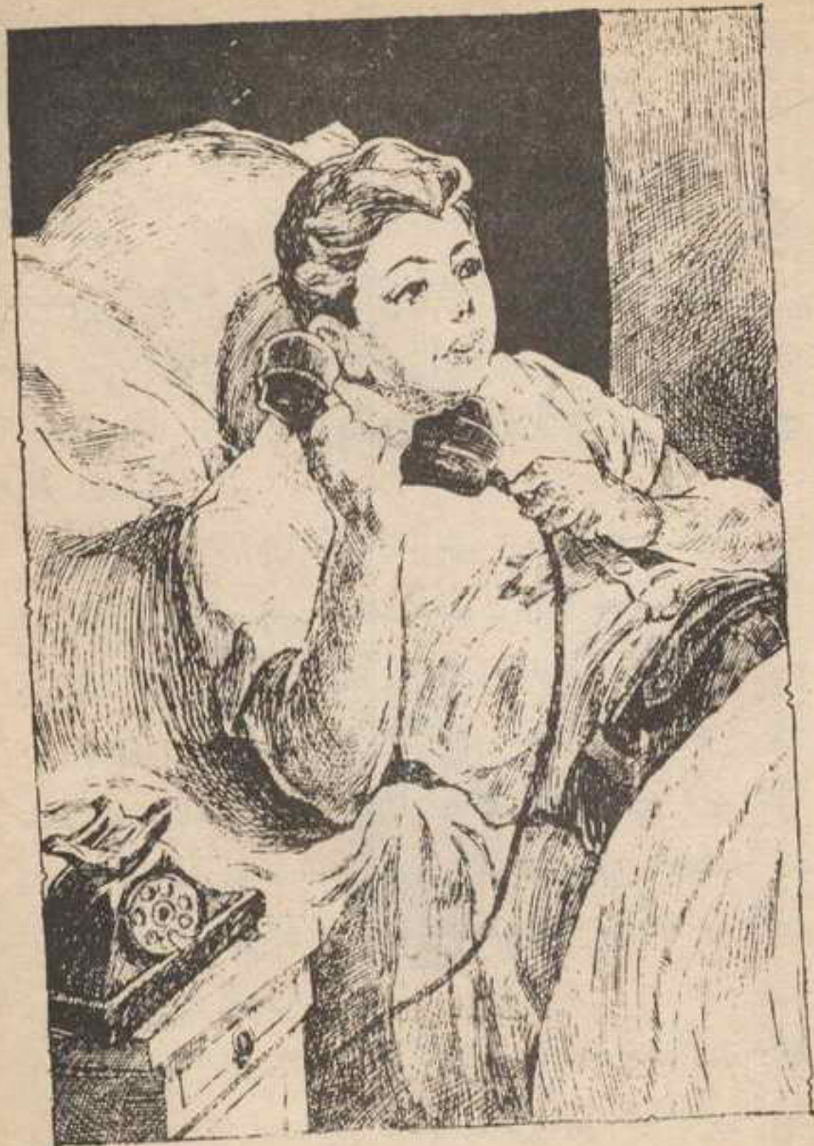
ودق جرس التليفون بجوار « تختخ » ، وأخذ يستمع باهتمام .

تختخ : لقد سمعت أن اللص ترك ورقة مع اللوحة ، ويهمنى أن أعرف ما بها .