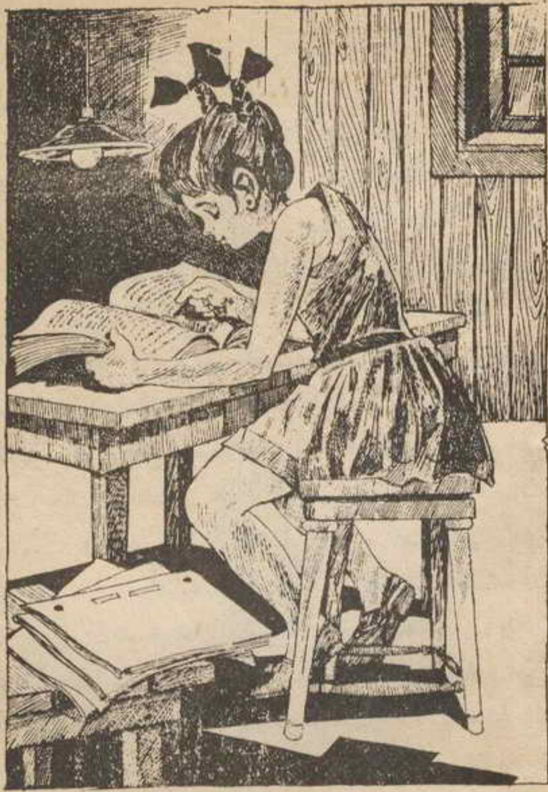
وجلست « لوزة » تقرأ في الملف الأزرق وكانت متدهشة لأن الشرطة لم تصل إلى المصن برغم الأدلة .