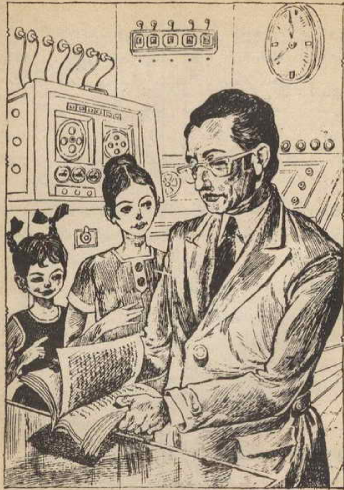
وأخذ الدكتور «علي» يشرح لهم طريقة تفريغ المعلومات وتصنيفها لتغذية الحاسب الالكتروني

نوسة : إننى متشوقة جداً للذهاب إلى هناك . . فتى نذهب ؟ تختخ : غداً . . نتقابل في التاسعة ، وفي العاشرة نكون هناك .