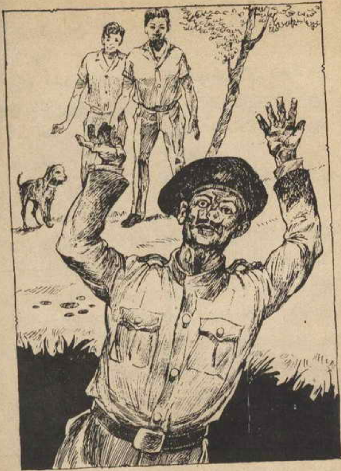
وصاح الشاويش : إلكتروني . . . إلكتروني . . . ما هذا الذي تتحدثون عنه ؟ !

شيئاً ؛ وسوف أبلغ الجهات المسئولة عنكم ، وعليكم أن توضحوا موقفكم .