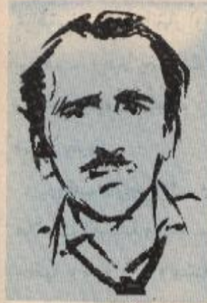
احد افراد العصابة

لم تكن هذه أول مرة يقع فيها الصديقان في مأزق حرج منذ أن أخذوا على عاتقها مهمة كشف الغموض عن الألغاز ، ومساعدة الشرطة في القبض على المجرمين ، ولكنها كانت المرة الأولى التي يقف فيها كلاهما