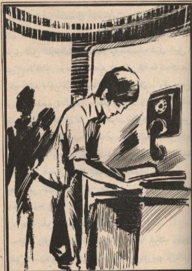
أسد : ياسر « مقصورة التليفون بالمطعم وأسك بالدليل وأخذ يقلب صفحاته ..

آخر.. وأن «عصام» يخضع لتهديدهم ، وهذه معلومات كثيرة ما كان يجب أن نعرفها لو كانوا على درجة كبيرة من البراعة كما تقول يا «هشام» ..