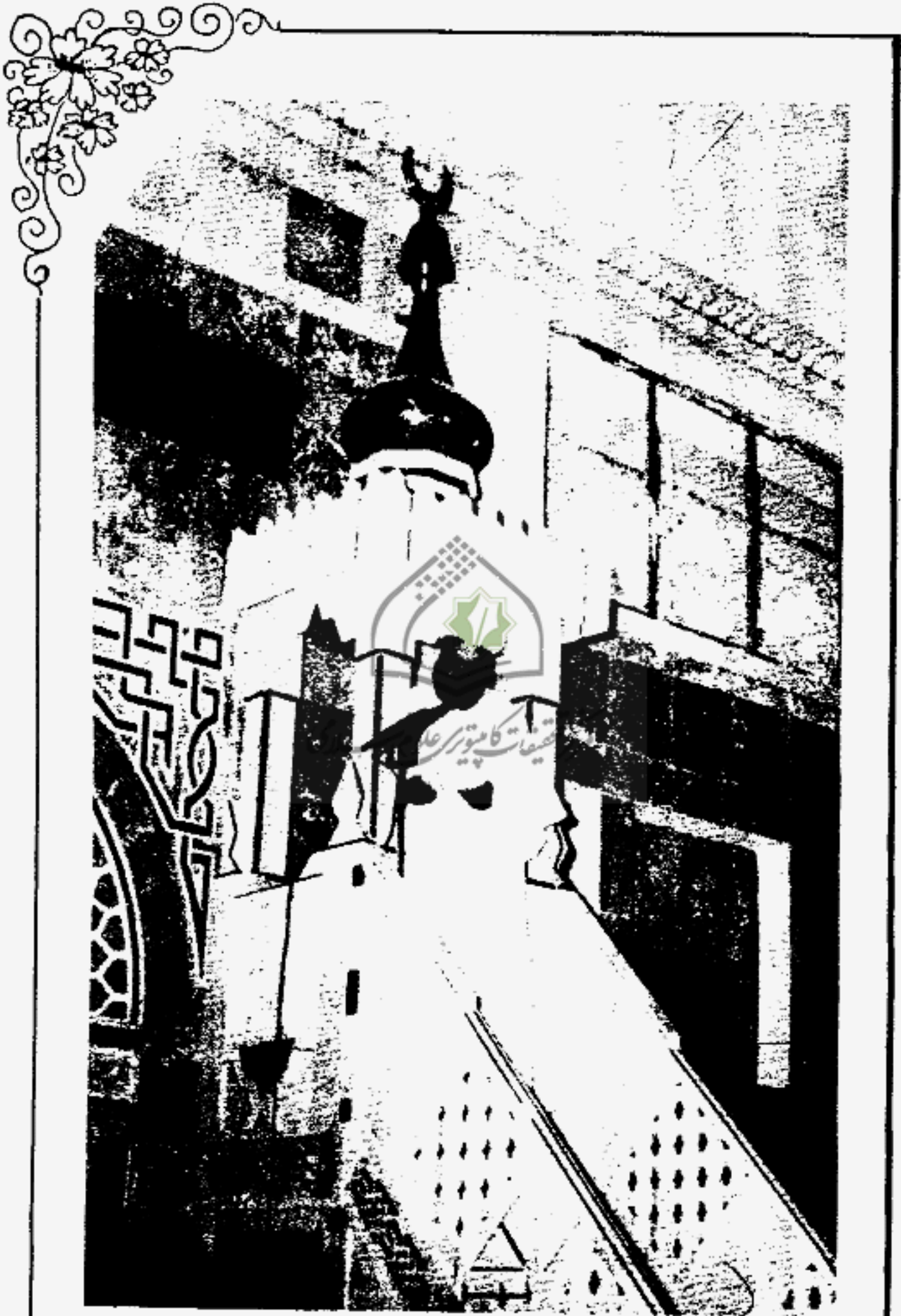
● خطبة صلاة الجمعة في جامع ناعسة - القرداحة (محافظة اللاذقية)