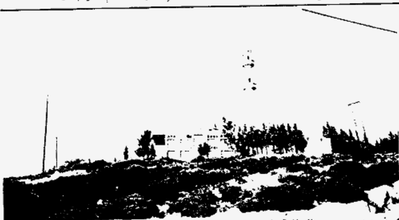
● ضريح ومسجد العلامة أحمد محمد حيدر

الإخوانية التي تعالج موضوعاً معيناً أو عدة موضوعات عرضت أيام المؤلف رحمه الله .