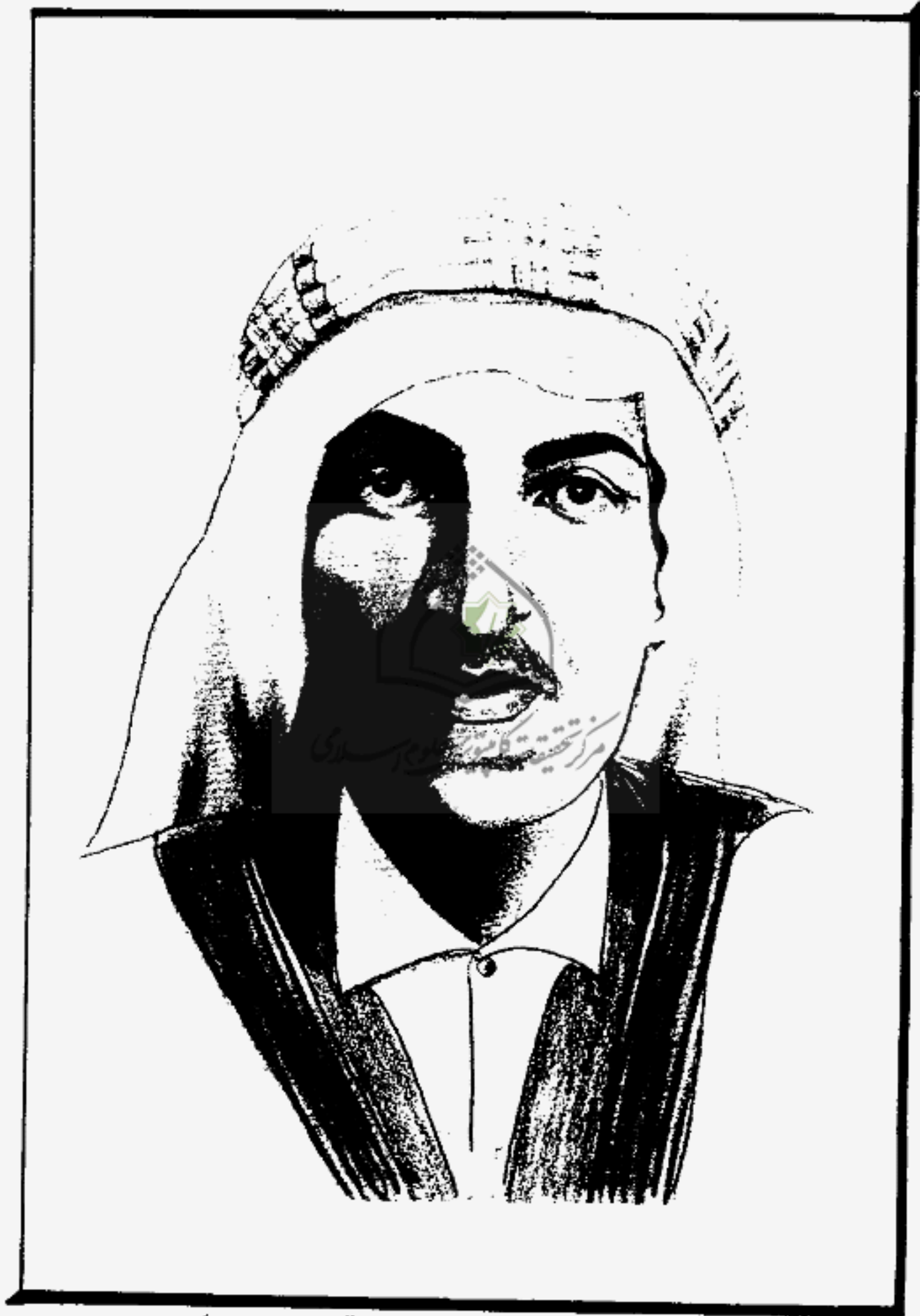
﴿ الشيخ أحمد محمد حيدر / قدس سره ﴾