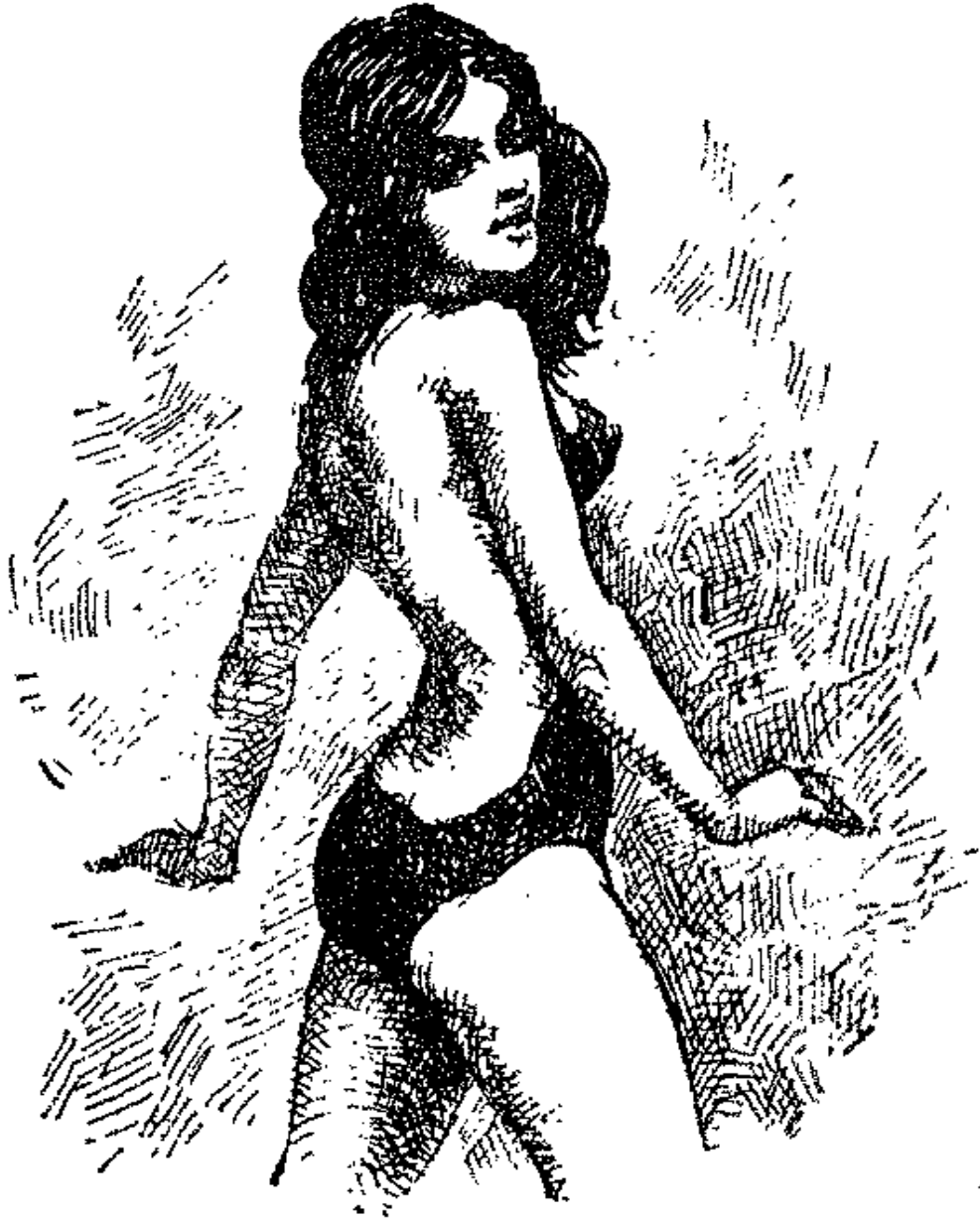
كن ثلاثهن فى ثياب البحر « البيكىنى »