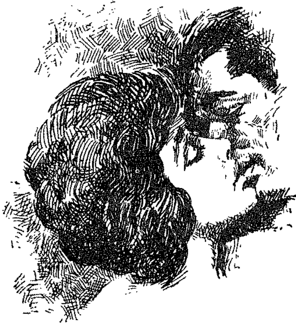
أو يتعانقان ويغيبان في قبلة طويلة