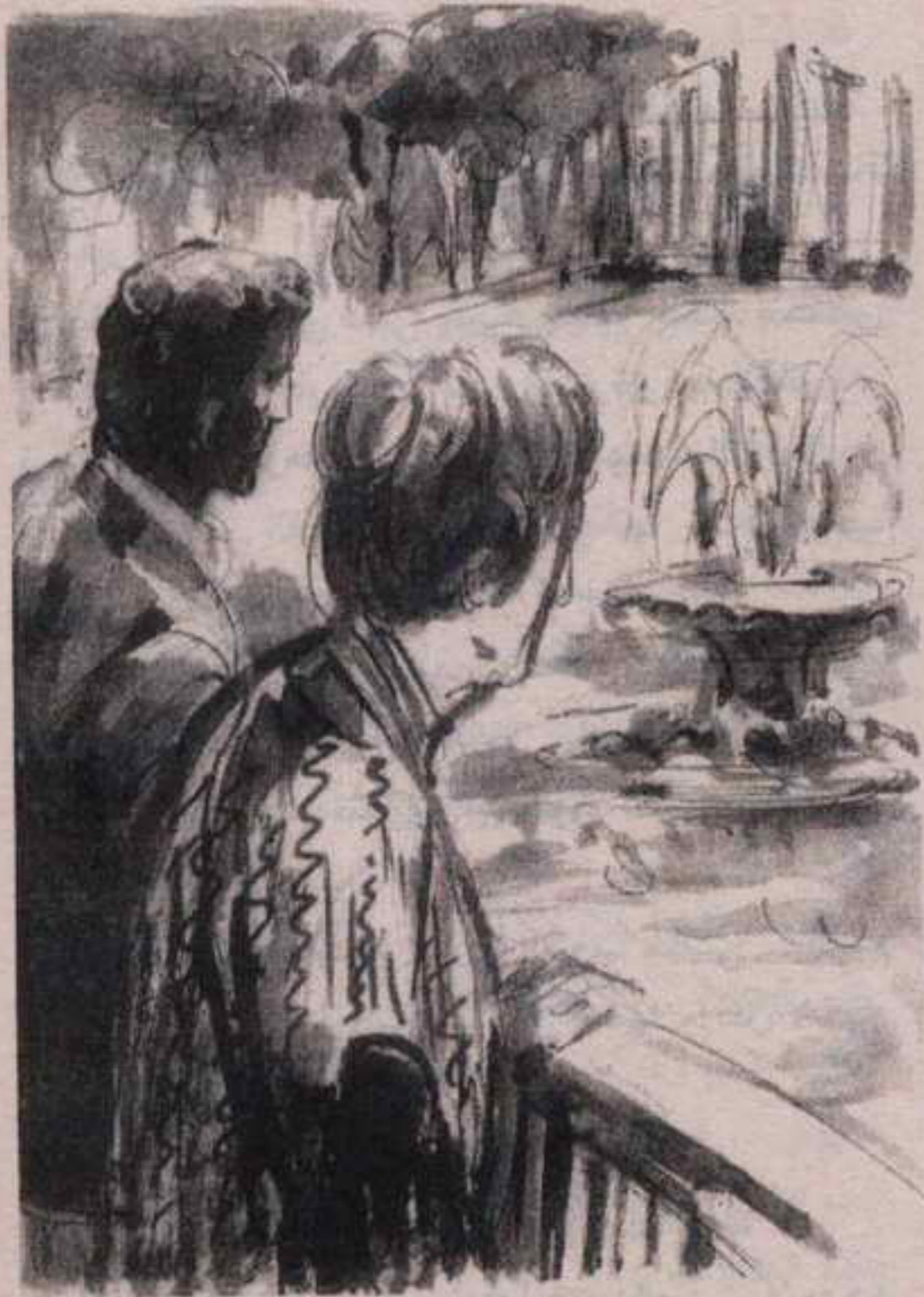
نترك المطبخ ونتجه للفناء الخلفى نرمق نافورة المياه ..

وأولادى لا يعرفون حقيقة ما عندى من مال .. هم يعرفون طبعاً أن زوجى ( توماس ) مات تاركاً لى مائة ألف من الدولارات .. لكنهم يجهلون كل شىء عن ( أطلانطا ) .. لقد جاء المال من زوجى الثانى ( تونى ) .. لقد مات منذ عامين .. وقبل موته بيومين مات أخوه الثرى المجنون ، وورث ( تونى ) الثروة .. ثم بعد يومين صرت وارثة لهذه الملايين .. « نترك المطبخ ونتجه للفناء الخلفى نرمق نافورة المياه ..