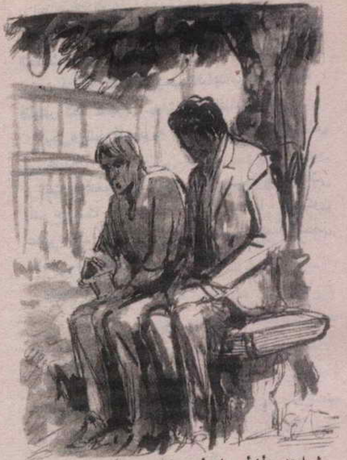
ثم اعتدت أن أمر عليه أسبوعياً لنشاهد مباريات الكرة ، فنجلس تحت شجرة ..

- « سعادتكم .. كنا منشغلين بجمع الأدلة والحقائق .. أما الآن فنحن نطلب ذلك .. »