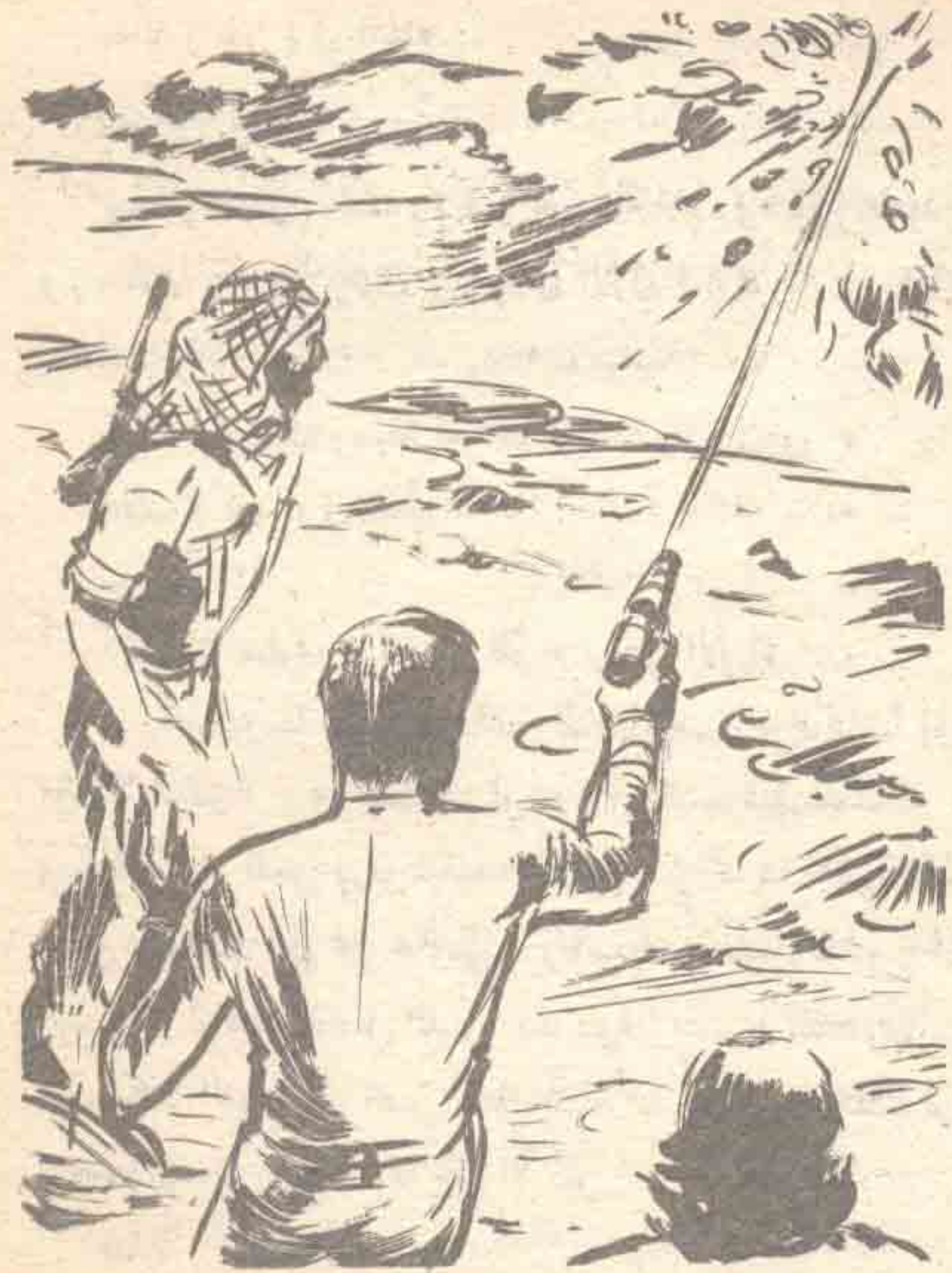
عند هذه النقطة أخرج ( نور ) مسدسه الليزري ، وصوبه إلى قطعة صخر قريية ..