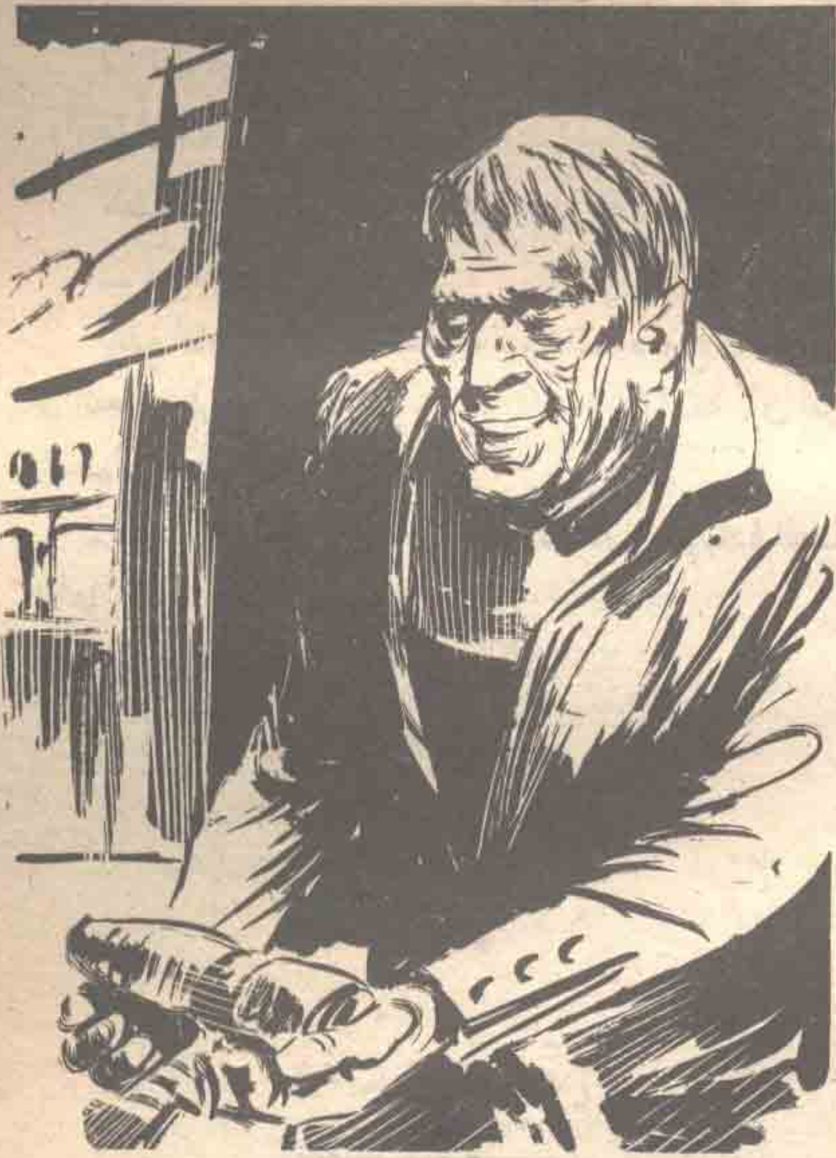
ثم أخرج من جيبه مسدسًا ليزريًا قديمًا ، وتقدم في هدوء خارج البقعة المظلمة ..

— هذا هو العبقري ، الذي تنبأ بعودتكم ، ولست أدري كيف فعل ذلك ؟