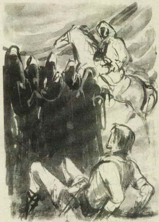
هنا رأيت في الظلام خيالات سوداء تشق طريقها نحو الفتى الراقد في الوحل ..

تبادلوا النظرات .. لا شيء حولهم سوى سهل فسيح ممتد .. ومن بعيد يبدو حزام من الجبال يلتمع بالبرق من حين لآخر ..