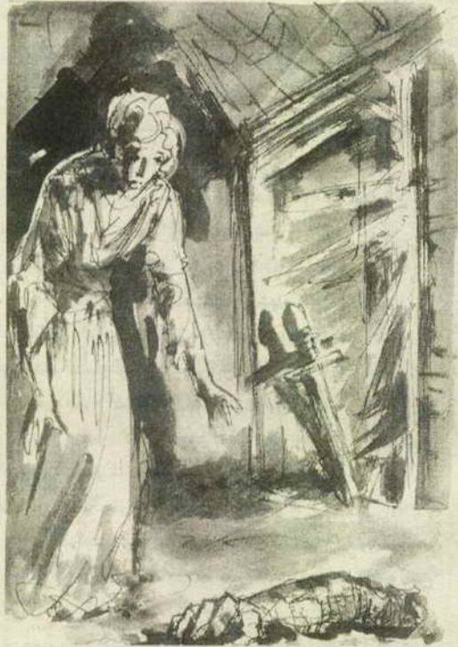
ثم تذكرت ذراع (بتروشييو) .. زحفت إلى مكانه ، وتأملت في فضول ..

لكن ما شمته أكثر كان هو العواء .. نعم .. شمته العواء ..