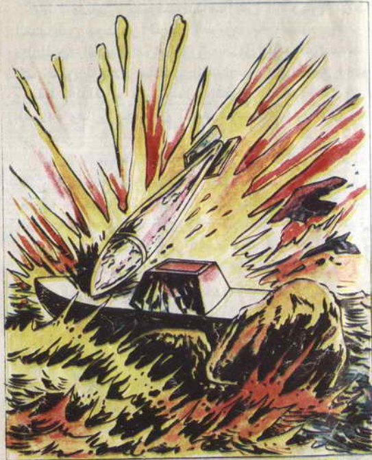
انطلقت قذيفة أسرع من البرق . ليتحول قاع البحر إلى جحيم .

قال خالد: أعط أوامرك فقط .. ونحن علينا التنفيذ ..