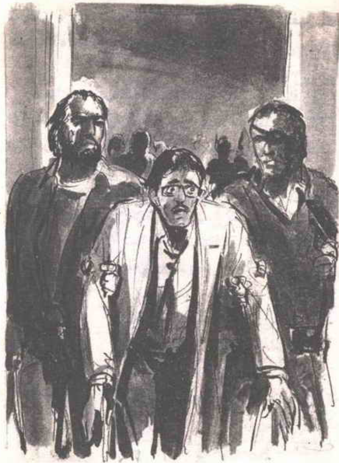
وساد صمت رهيب بينما (أرداش) يمشى زائف العينين مرتبك الخطا بين الرجلين ، نحو خارج القاعة ..

- « فلتنها الأمر بسرعة في الخارج .. بسرعة ودون ألم ! »