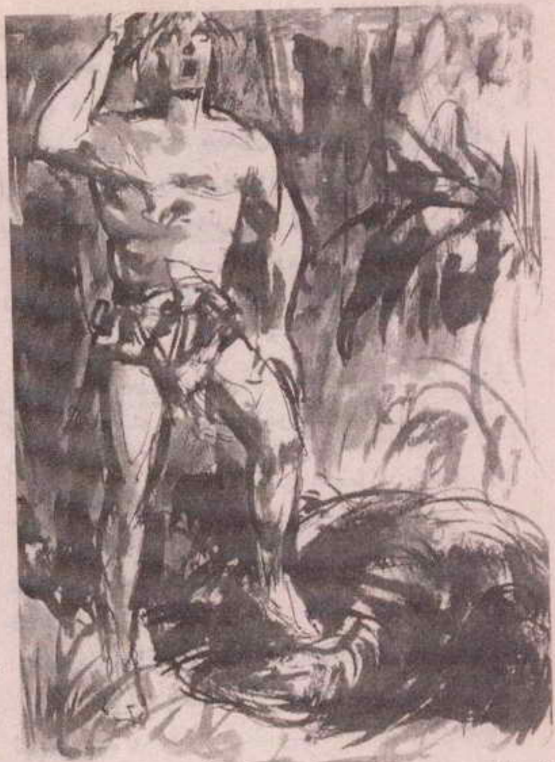
الغوريلا صريع على الأرض يعالج سكرات الموت والقرود الأبيض يضع قدمًا على صدره المشعر ، ويرفع عقيرته للسماء مردداً : - هاهاه ! ..

إنها لم تره منذ شهرين .. حنين ملح انتابها وهى ترمقه ، شاعرة باشتياق إلى هذا الشىء الوحيد الباقى من عالمها القديم .. على الأقل هو معها ويعرف أين هى .. القمر صديق قديم ودود تلقاه فجأة فى مكان غريب .. فتشعر للحظة بالأمان والحاجة إلى أن تظل بقربه أبداً ..