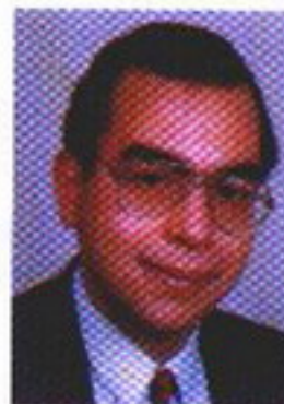
د. احمد خالد توفيق

إنها الأدغال الإفريقية ، حيث لا صوت يعلو فوق صوت الزئير والعواء والخوار .. ولا قانون يعلو فوق قانون الغاب .. ولا حلم يعلو فوق البقاء حياً ساعة أخرى .. لكن واحداً فقط عرف كيف يخلق قانونه الخاص .. كان هذا الواحد يُدعى لورد ( جراى ستوك ) .. والذى نسميه نحن ( طرزان ) ..