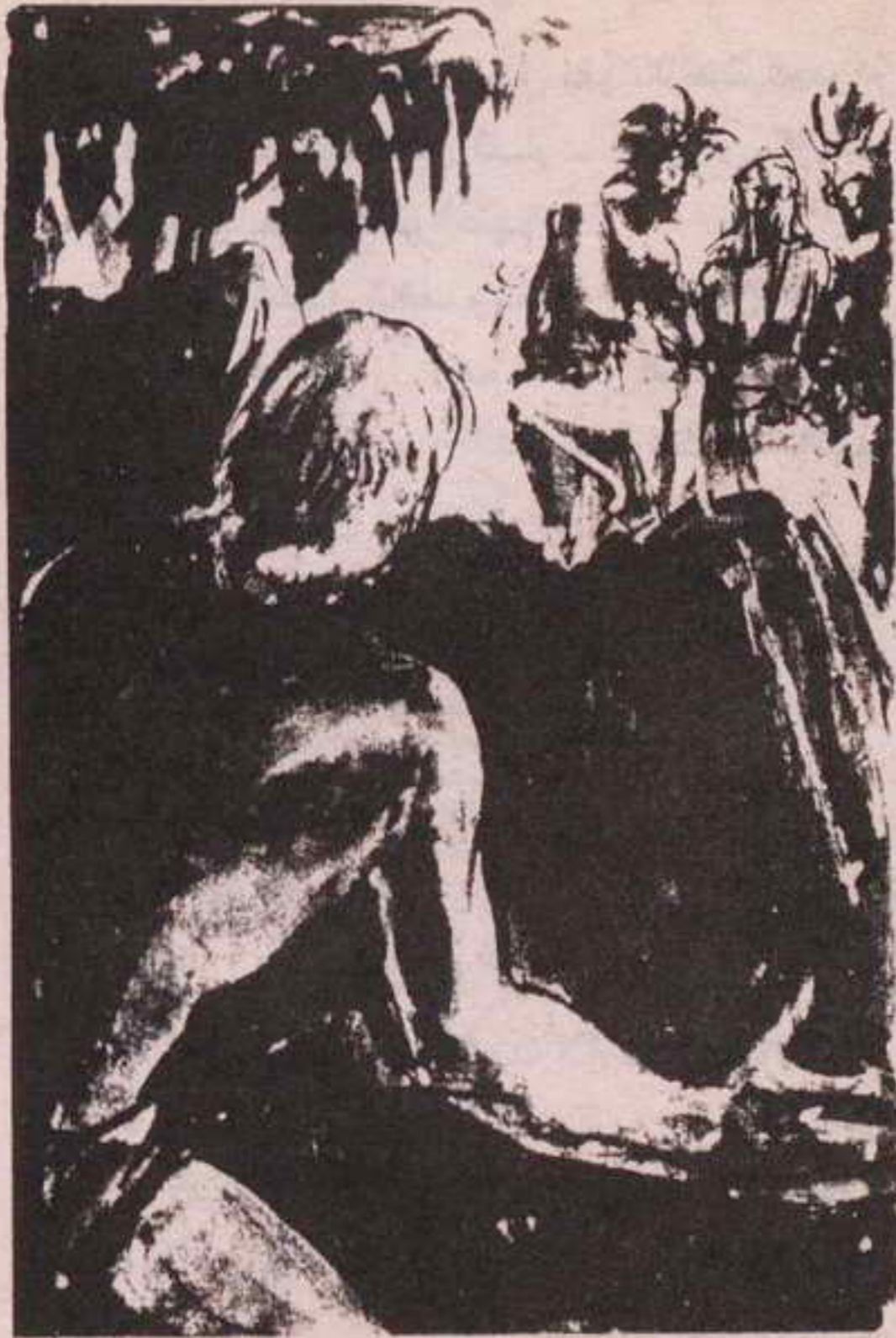
استطاع أن يرى هذا من موضعه بين صخور الشاطئ ..

بدأت تزحف للخلف .. ببطء .. ببطء ... وأخيراً وجدت فرصة في العشب تسمح لها بأن تقف على قدميها وتعود ركضاً إلى الكوخ .. منحنية نعم .. لكن ليس على ركبتيها : لكنها أدارت رأسها لتجد أنها تنظر مباشرة في وجهه مغطى بالأصباغ كمهرج سيرك .. وأن هناك رمحاً مصوباً إلى عنقها .. لقد كان واحداً منهم !