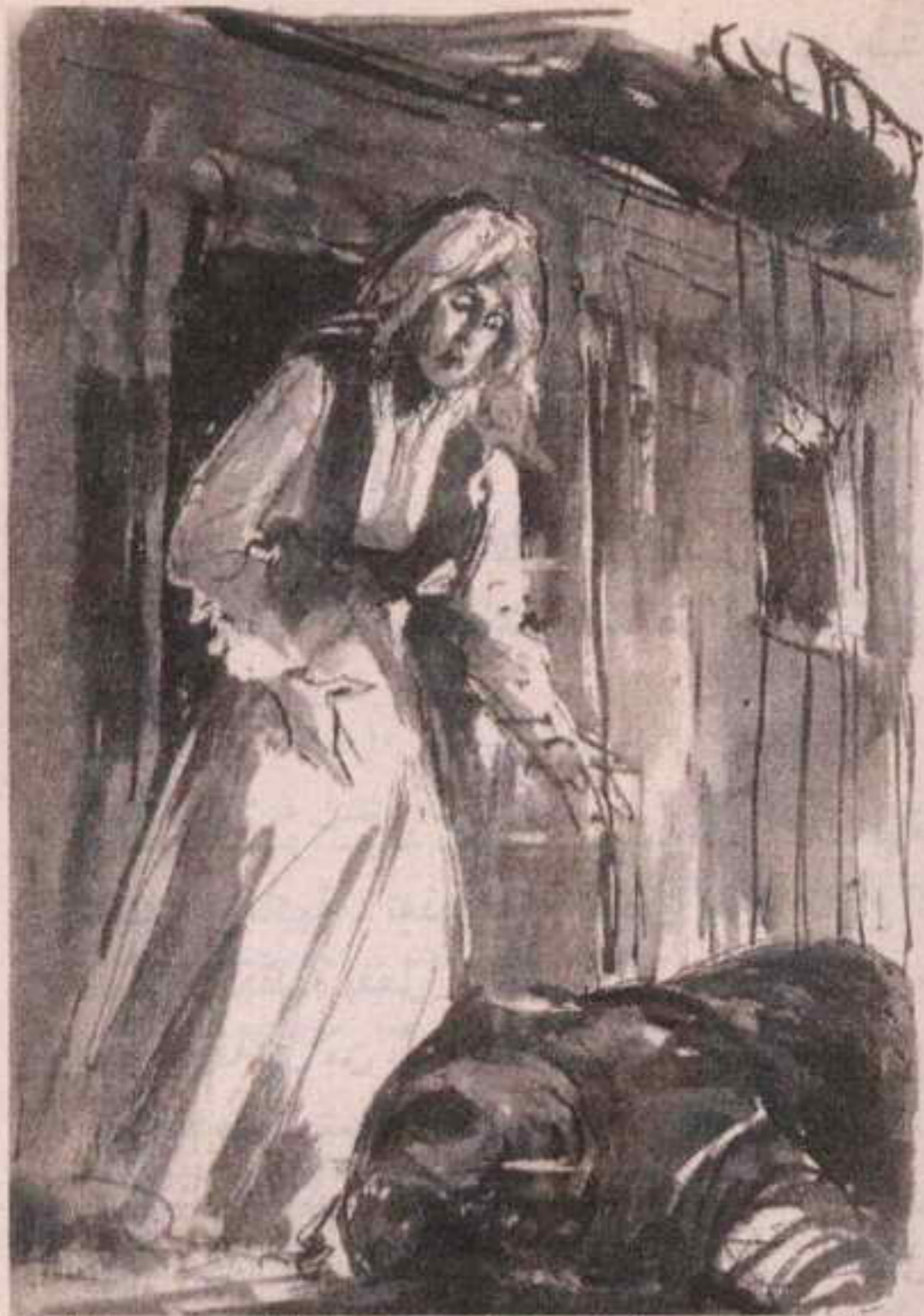
هناك خنزير برى آخر ، مذبوح بنفس الطريقة ، ينتظرها على باب الكوخ في ذات الموضع ..

حمقاء حين لم تفهم أن الأصوات التي سمعتها ليلاً لم تكن بفعل رطوبة الخشب ..