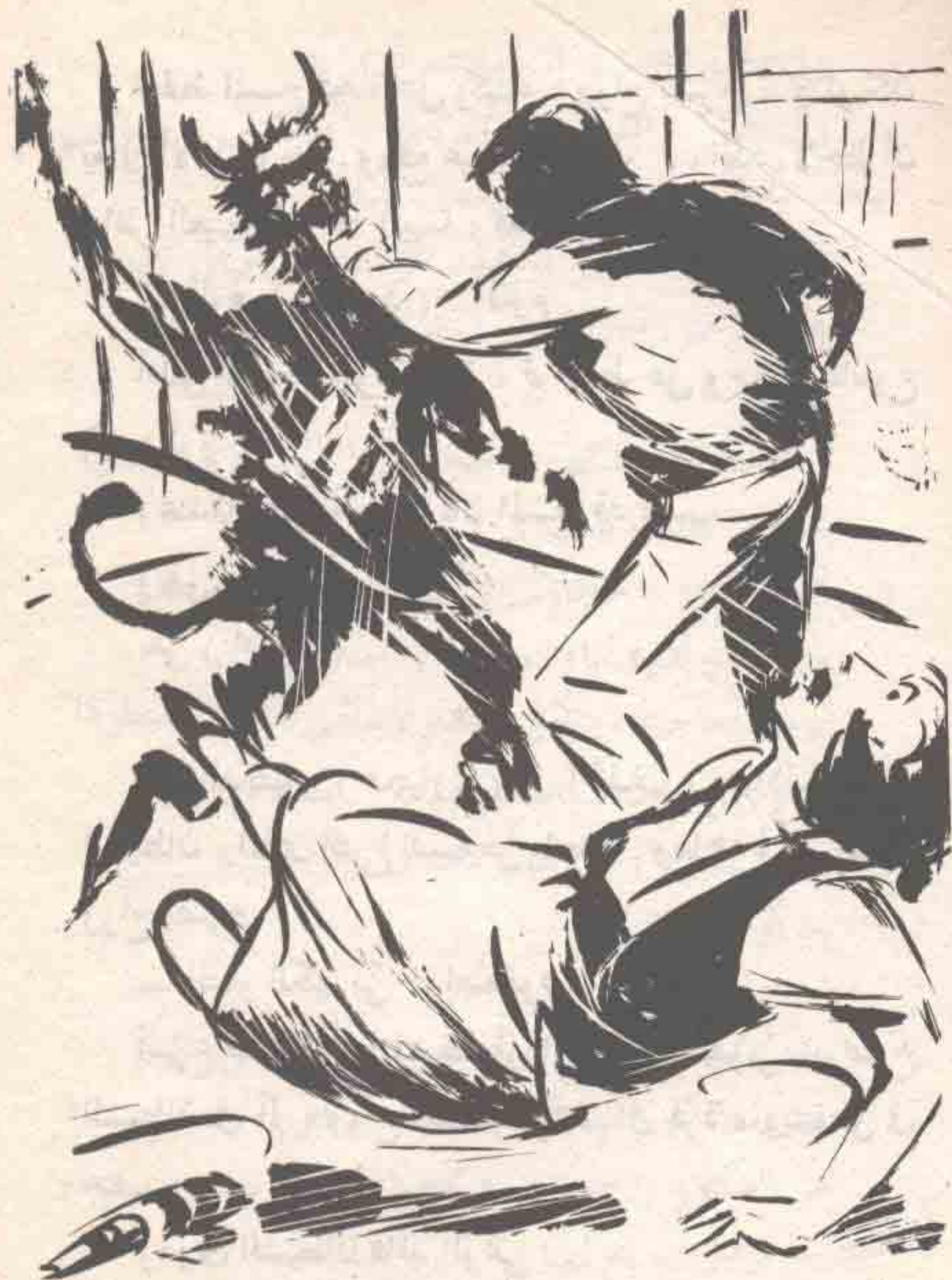
وبكل ما يملك من قوّة ، هوت لكمات ( نور ) على وجه المسخ وجسده ، فتراجع هذا الأخير ، وزجر في وحشية ..