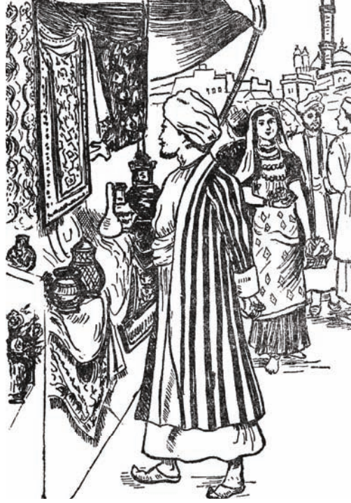
الأمير «حسين» في سوق الثياب.

وَكَانَ أَرِيحُ الْوَرْدُ الذِّكِّي يَفُوحُ فِي كُلِّ مَكَانٍ، فَيُنْعِشُ النُّفُوسَ شَذَاهُ الْمُعْطَرُّ، وَلَا يَكَادُ يَخْلُو مِنْهُ بَيْتٌ وَلَا مَتَجَرٌّ! وَقَدْ عَرَفَ الْأَمِيرُ أَنَّ أَهْلَ هَذِهِ الْمَدِينَةِ قَدْ بَرَعُوا فِي اسْتِخْرَاجِ الْعُطُورِ مِنَ الْأَزْهَارِ وَالرِّيَّاحِينَ، وَتَقْطِيرِ أَنْوَاعٍ مِنَ السَّوَائِلِ الطَّائِرَةِ ذَاتِ الرَّائِحَةِ الذِّكِّيَّةِ، وَهِيَ سَوَائِلُ سَرِيعَةِ التَّبَخُّرِ، لَا تَكَادُ تَرْتَفِعُ السَّدَادَةُ عَنْ قَنِينَتِهَا حَتَّى يَمْلَأَ الْجَوَّ عِطْرُ فَوَاحٍ. وَسَمِعَ الْأَمِيرُ فِي أَثْنَاءِ أَحَادِيثِهِ مَعَ الْأَهْلِيِّينَ أَنَّهُ كَانَ هُنَاكَ مِنْ بَيْنِهِمْ رَجُلٌ قَضَى عُمَرَهُ كُلَّهُ فِي تَجَارِبِ مُتَوَاصِلَةٍ، أَرَادَ بِهَا أَنْ يَسْتَخْرِجَ مِنْ بُحَارِ النَّبَاتَاتِ وَالْأَعْشَابِ مَادَّةً أَثَرِيَّةً: