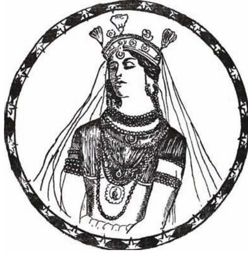
بنتُ العم: «نور النهار».