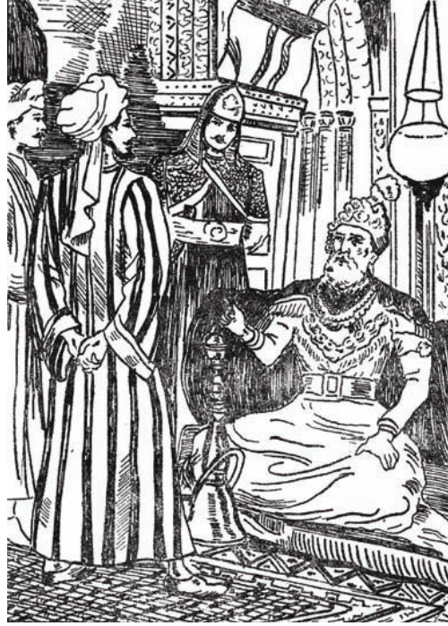
السُّلْطَانُ «مَحْمُودُ» يَتَحَدَّثُ مَعَ أَوْلَادِهِ.

وَقَدْ نَشَأْتُمْ — مُنْذُ حَدَاثَتِكُمْ — عَلَى الْإِسْتِقْلَالِ فِي الرَّأْيِ؛ فَلَمْ أَفْرِضْ عَلَيْكُمْ طَاعَتِي فَرَضًا، وَلَمْ أَرْضَ لِنَفْسِي أَنْ أُمَيِّرَ وَاحِدًا مِنْكُمْ عَلَى أَخَوَيْهِ. وَإِنْ كُنْتُ وَاثِقًا أَنَّكُمْ أَطُوعُ إِلَى تَنْفِيزِ إِشَارَتِي — أَيًّا كَانَتْ — بِلَا اعْتِرَاضٍ وَلَا مُنَاقَشَةٍ.