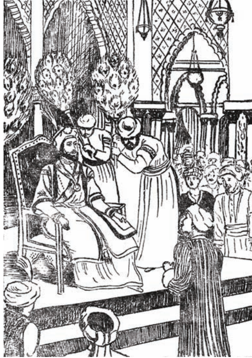
الأمير «حُسَيْنٌ» بَيْنَ يَدَيِ مَلِكِ «بِسَنْجَارَ».

وَقَدْ عَلِمَ الْأَمِيرُ أَنَّ مَلِكَ «بِسَنْجَارَ» يَسْتَقْبِلُ التُّجَّارَ الْغُرَبَاءَ كُلَّ أُسْبُوعٍ فِي يَوْمٍ بَعِيْنِهِ؛ لِيَتَعَرَّفَ إِلَيْهِمْ، وَيُفِيدَ مِنْ آرَائِهِمْ، وَيَقْبِسَ مِنْ عِلْمِهِمْ وَتَجَارِبِهِمْ مَا يَنْفَعُ بَلَدَهُ. فَلَمْ يُضِعِ الْأَمِيرُ «حُسَيْنٌ» تِلْكَ الْفُرْصَةَ، بَلْ ذَهَبَ إِلَيْهِ.. وَدَارَتْ بَيْنَهُمْ طَرَائِفُ مِنَ الْمَعْلُومَاتِ، وَلَطَائِفُ مِنَ الْمَعَارِفِ، وَبَدَائِعُ مِنَ الْفَوَائِدِ، انْتَهَتْ بِأَن أُعْجِبَ كِلَاهُمَا بِالْآخَرِ؛ لِمَا تَمَيَّزَ بِهِ مِنْ رَجَاحَةِ عَقْلِ، وَعُمْقِ تَفْكِيرٍ، وَأَصَالَةِ رَأْيٍ، وَوَفَرَةٍ فَضْلٍ.