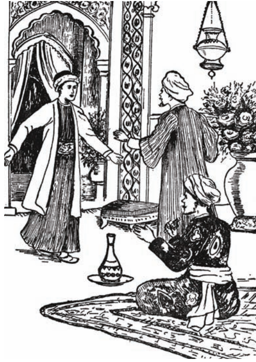
الإخوة الثلاثة يلتقون في الفندق بعد غياب عام.

فَإِنَّ مَا أَتَيْتُهُ فِي مَظْهَرِيكُمَا، وَقَسَمَاتِ وَجْهِيكُمَا، وَمَا أَرَاهُ عَلَى أَسَارِيرِكُمَا مِنْ دَلَائِلِ الِابْتِهَاجِ وَالْبِشْرِ؛ دَلِيلٌ عَلَى مَا أَحْرَزْتُمَاهُ مِنْ فَوْزٍ وَنَصْرِ. وَلَا رَيْبَ فِي أَنَّ كُلًّا مِنْكُمَا ارْتَدَا خُبْرَةً بِالدُّنْيَا؛ وَمَعْرِفَةً لِلْحَيَاةِ، بَعْدَ أَنْ شَهِدَ مِنَ الْبِقَاعِ النَّائِيَةِ، وَالْأَمَكِنَةِ الْقَاصِيَةِ، مَا لَمْ تَكُنْ شَهِدْتُهُ عَيْنَاهُ، وَبَعْدَ أَنْ اسْتَبَانَ لَهُ مَا عِنْدَ الْأُمَمِ الْمُخْتَلِفَةِ مِنْ عَجَائِبَ وَغَرَائِبَ، وَمِنْ طَرَائِفَ وَلَطَائِفَ، وَمَا وَصَلَ إِلَيْهِ الْبَاحِثُونَ وَأَهْلُ الْعِلْمِ فِي مَيْدَانِ الزَّرَاعَةِ وَالصَّنَاعَةِ مِنْ أَسْرَارَ وَحَقَائِقَ، مِمَّا يَجْدُرُ أَنْ يَنْتَفِعَ بِهِ الْإِنْسَانُ، أَيْنَمَا كَانَ، وَلَا يَنْفَرِدُ بِهِ وَطَنٌ دُونَ سَائِرِ الْأَوْطَانِ.