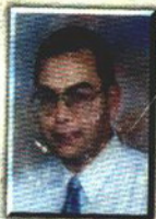
د. أحمد خالد توفيق

وفى الخارج كان الواقفون قد سمعوا الأصوات الرهيبة ، وفهموا بعض الحقيقة وليست الحقيقة كلها .. خروا على ركبهم ورفعوا المشاعل غير مصدقين .. فى البدء خرج سرب كثيف من الوطاويط المذعورة كأنه نذير بما سيحدث ... بعد هذا يبرز أول الجنود .. يمشى فى تؤدة وثقة .. له عين تحولت إلى تجويف أسود كرية ، ووجه خال من التعبير .. يقف على مدخل الكهف وينظر من حوله ، كأنه الكابوس فى ضوء المشاعل ..