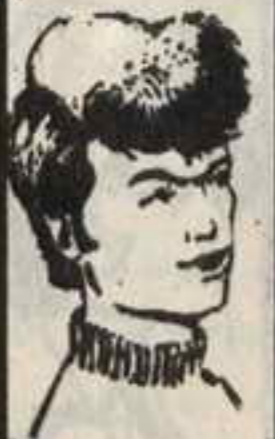
رقم ٦ - مصباح من ليبيا