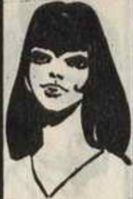
رقم ٣ - الهام من لبنان