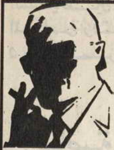
رقم . صفر . الزعيم الفاض الذي لا يعرف حقيقته احد ..

وفي كل مغامرة يشترك خمسة او ستة من الشياطين معا .. تحت قيادة زعيمهم الفاض ( رقم صفر ) الذي لم يره احد .. ولا يعرف حقيقته احد . واحداث مغامراتهم تدور في كل البلاد العربية .. وستجد نفسك معهم مهما كان بلدك في الوطن العربي الكبير .