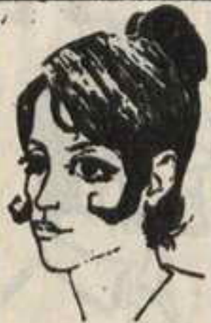
رقم ٧ - ربيدة من تونس