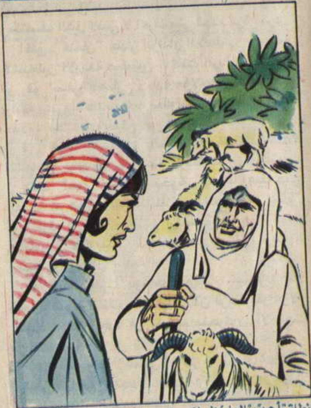
انطلق "احمد" و"إلهام" في ملابس الرعاة في اتجاه المنطقة التي وصفها ش/ ٢٨ في رسالته .

قال "معلوف" في رسالته : ان "مالمو" عبقرى .. فرقم "صفر" لم يغادر لبنان نهائيا .. فقد غادرها ليوم واحد ثم عاد في شكل مختلف وباسم مختلف .. فقد سمى نفسه "بريان فاسكو" . وهو يقيم ظاهريا في فندق "كارلتون" حيث نزلنا فترة .. ولكنه يستخدم مقرا سريريا قرب البحر .. سوف نتابعه مع زملائي فترة حتى نحدد مكانا يتردد عليه .. وموعدا يوجد فيه .. فليكن مستر "ون بولت" مستعدا ، فقتل هذا الرجل مهمة صعبة .. ولا بد من اصابته من اول مرة والا