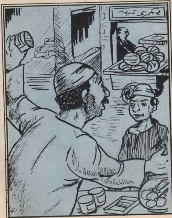
التفت عم « عويس » إلى مصدر الصوت فرأى ولداً صغيراً يلبس جلباباً ممزقاً ومرفعاً .

- من أنت ؟ وماذا تريد من الأستاذ « محمود » ؟