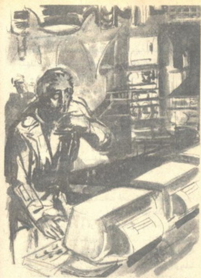
وانطلقت من حلقة شهقة عنيفة هذه المرة ، وهو يصرخ : لا .. لا .. مستحيل ! ..

واتسعت عينا المهندس أكثر وأكثر .. وتواصل انخفاض الطاقة .. طاقة هائلة ، تكفى لإنارة ( القاهرة ) الجديدة وضواحيها ، راحت تتسحب من المفاعل النووي ، وتغوص فى خلايا بشرى واحد .. وخفتت كل مصابيح المدينة دفعة واحدة .. وتوقفت الآلات والمعدات الكبيرة .. ثم الصغيرة .. وحتى الأجهزة المنزلية البسيطة .. وفجأة ، توقف كل شيء .. وران على المكان صمت رهيب .. صمت استغرق ثوانى معدودة ، قبل أن يقطعه دوى أبواق مركبات النجدة ، التى يقودها المقدم ( نور الدين محمود ) .. لقد وصلت أخيراً ، ولكن بعد فوات الأوان للأسف .. العدو نفذ مهمته بنجاح هذه المرة أيضاً .. ثم اختفى .. وبلا أدنى أثر .