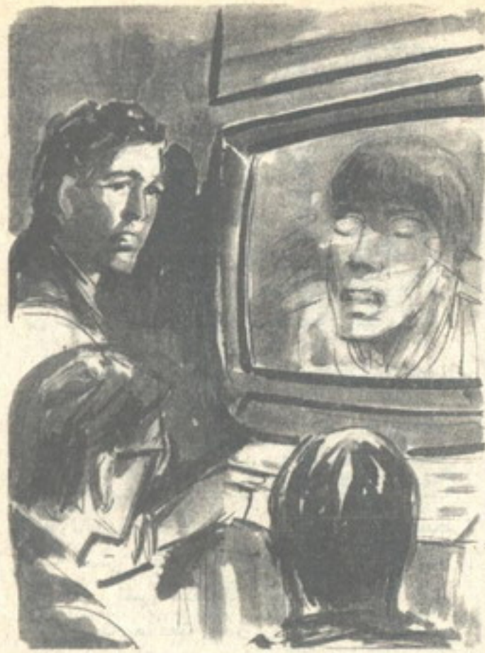
ويضغط زر ، أسدل ذلك المرشح الداكن على الصورة ، ثم ثبت المشهد ، متابعاً : - انظروا إلى تلك النظرة الخيفة ؟ ..

- لقد قمت بتكبير الصورة عدة مرات ، فتوصلت إلى الكثير .