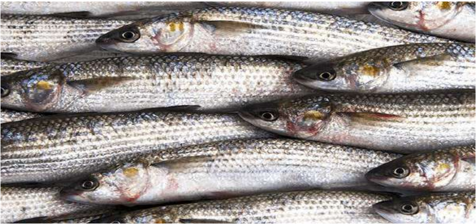
سمك البوري (kefal)

يتواجد في كل البحار المحيطة بالبلاد، ويفضل تناوله طيلة السنة فيما عدا فصل الصيف، ويحب العيش في المياه القذرة والعكرة.