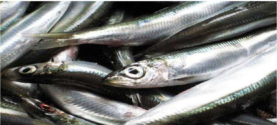
سمك السردين (Sardalya)