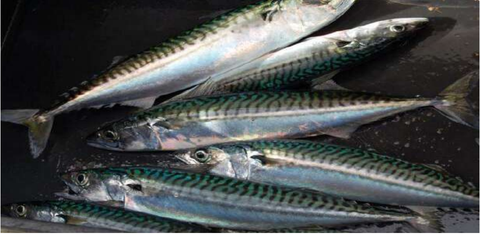
Trança, Sinarit سمك