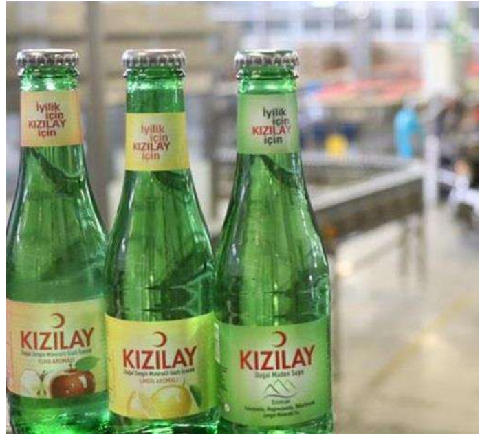
المياه المعدنية التركية كيزيلاي Kizilay

ويمكننا القول إن نسبة الصوديوم فيها أقل من غيرها من منتجات المياه المعدنية.