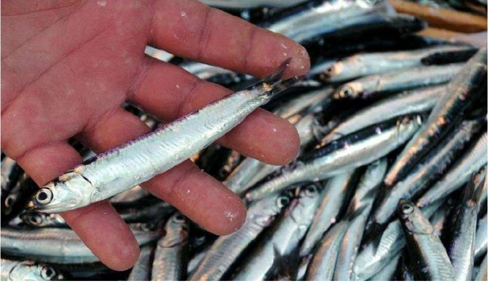
سمك هامسي (Hamsi)