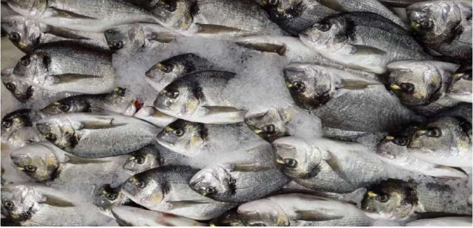
سمك الدنيس (Çipura)