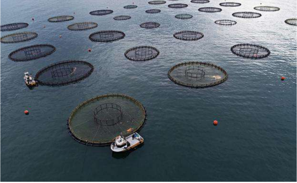
صورة توضح آلية استزراع الأسماك في تركيا

تنتشر العديد من الأسماك في تركيا، بفعل الموقع الجغرافي الفريد للبلاد الذي يوفر لها إنتاجا عاليا منها.