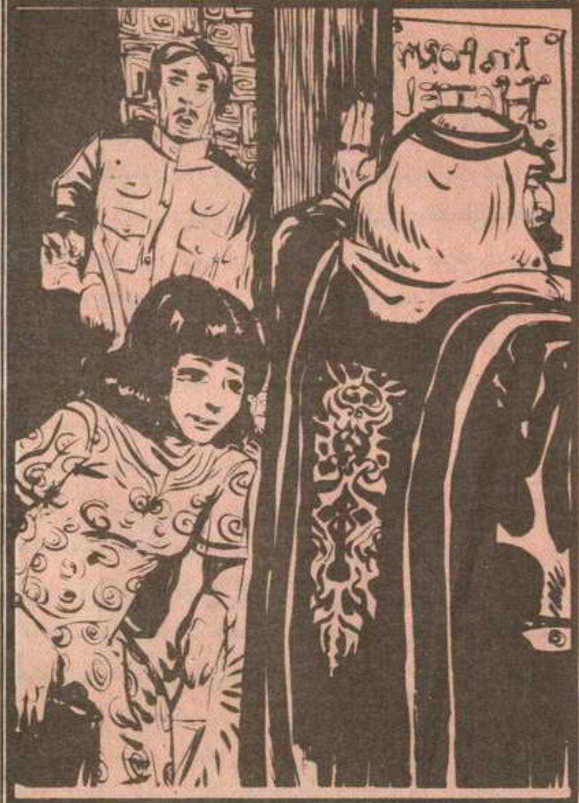
واتجه «سمير» إلى الرجل فأدركه قبل أن يخطو داخل المصعد وقال : هل هذا خطابك يا سيدي