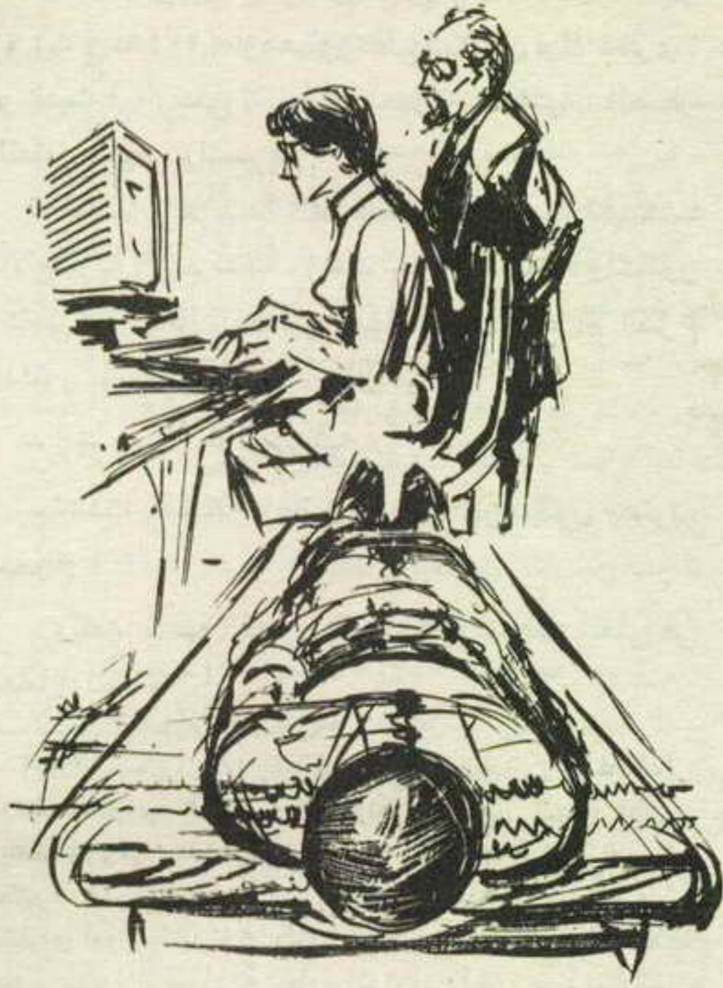
راقبها في اهتمام شديد ، وهي تضغط بعض الأزرار ..

أجابت في اهتمام ، وهي تجلس أمام الكمبيوتر : - أحاول حل شفرة الجهاز الدفاعي . راقبها في اهتمام شديد ، وهي تضغط بعض الأزرار ، قبل أن تقول :