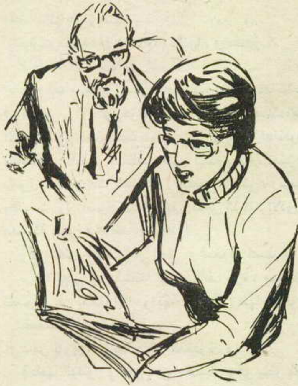
استعدادات المجلة في توتر ، وعادت تلقى نظرة على الصورة ..