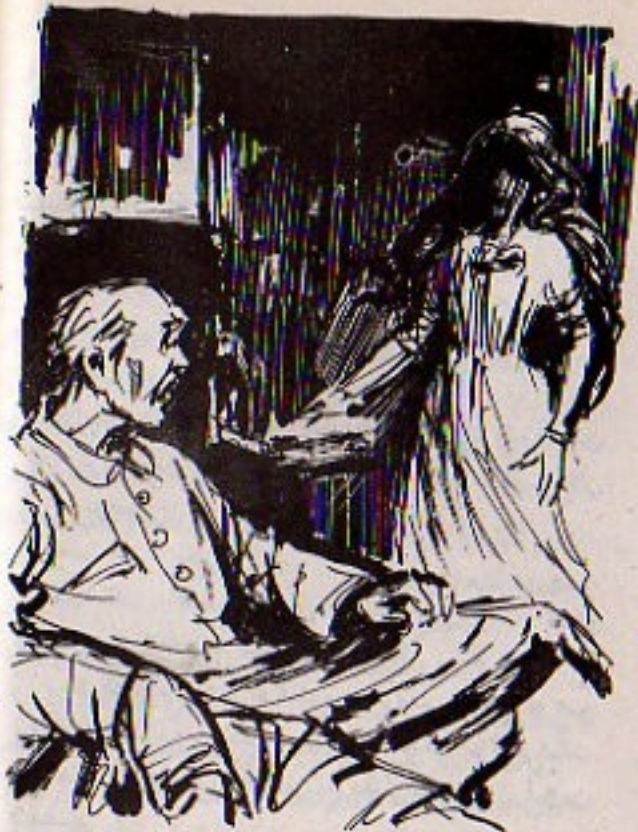
إن هذه الفتاة ، أو هذا الشيء ، يدرب بتودة من الفراش ..

طففتا بكلمات مبعثرة نشرح للزوجة ما حدث .. شبح فتاة كنا نلعب معها في الطفولة برغم أنها كانت قد توفيت .. الأمر الذي لم يقنعها كثيراً في الواقع ..