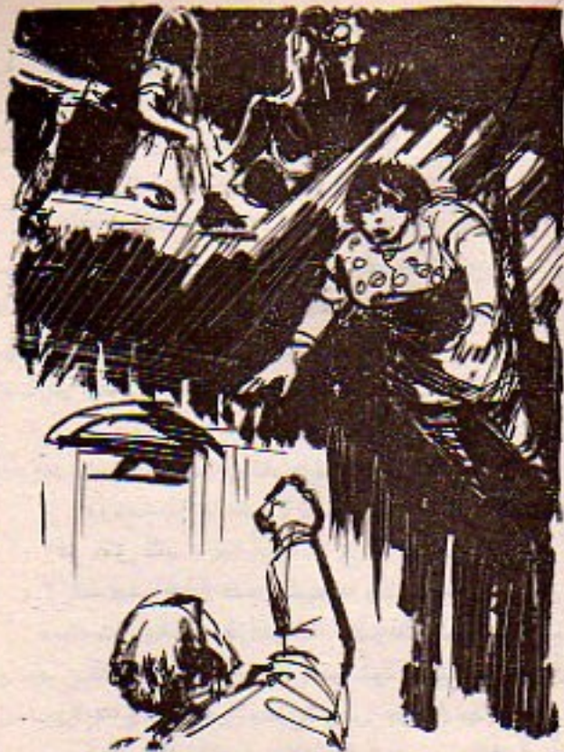
لقد اشتبك جزء من الخشب المهشم في ثوب (إلهام) فتدلت ، كالثريا ، من أسفل (الدرابزين) فوق رعوستا ..