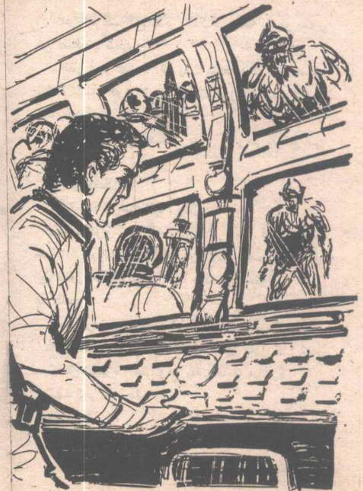
انعقد حاجبا ( رمزي ) في شدة ، مع هذه المعلومة الجديدة ..