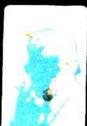
قيس عثمان هدى أحمد رقم صفر