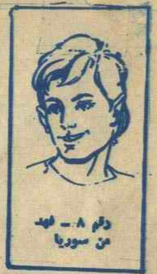
رقم ٨ - هيد من سوريا