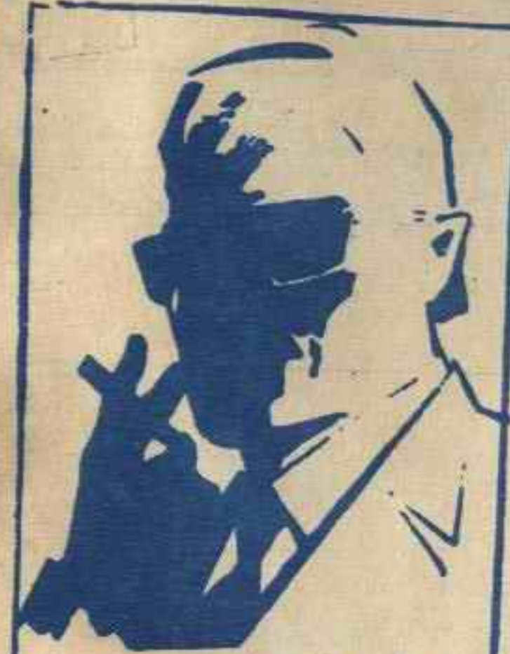
رقم صفر الزعيم الفاضل الذي لا يعرف حقيقته احد ..