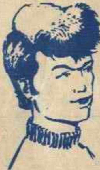
رقم ٦ - مصباح من ليبيا