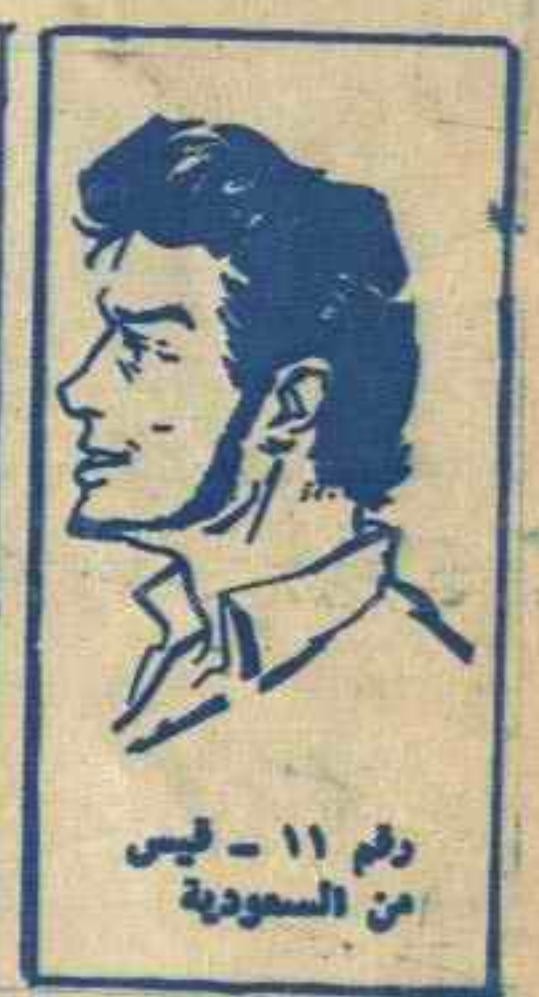
رقم ١١ - ليس من السعودية