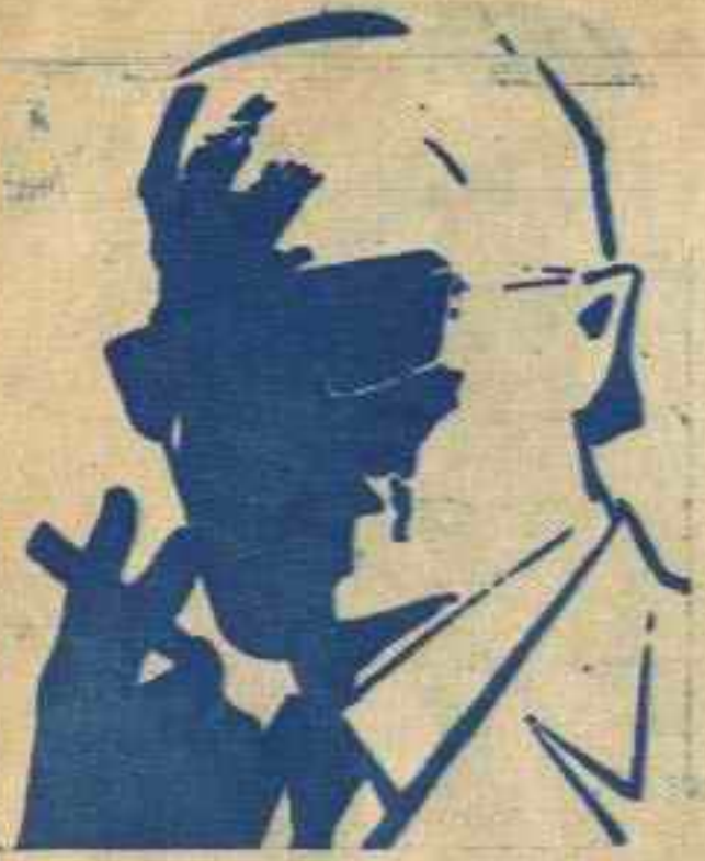
لفـز الدكتور جوتار!

كانت أصوات الطلقات تتوالى في « التبة » الخلفية للمقر السرى ، حيث توجد أرض التدريب ، وحيث يمارس الشياطين تدريبات الرماية . كانت الساعة تقترب من العاشرة ليلا ، والظلام يغطي كل شيء ، حتى أن الشياطين كانوا يتحدثون بلغة «الدقات» هذه اللغة التي كانوا يلجأون إليها كثيرا في مغامراتهم . لم يكن يظهر وسط الظلام ، سوى ضوء الطلقات ، عندما تخرج من فوهة المسدسات ، وكان هذا هو التدريب العملي الليلي . فمن المعروف أن الانسان يستطيع أن يحكم إطلاق النار ، عندما يكون الوقت نهارا ، لأن الهدف يكون واضحا .