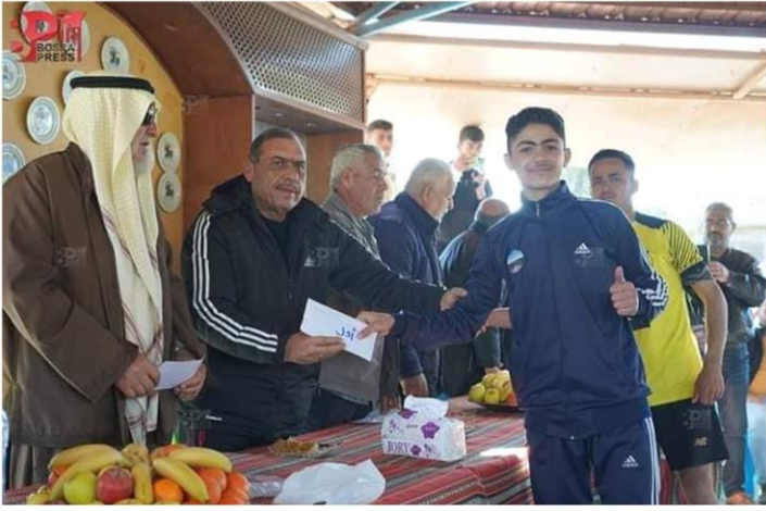
حاز الشاب الحوراني: