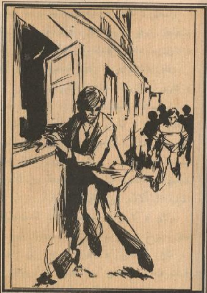
وأسرعوا ناحية « كارني » الذي لمحهم فرجع إلى النافذة المفتوحة .. ومرحان ماتسلقها ..

الذي أوقعه مع من لا يشبعون .. وغادر السيارة مسرعاً إلى داخل المستشفى وهو يقول : أريد رؤية « بانو » بعد انتزاع الرصاصة من فخذة واطمئن على « لارك » .. وقاطعه « عامر » قائلاً : اذهب يادكتور .. فهذا واجبك .