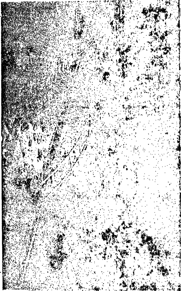
Padang Pandjang ( عالمة الجبسة الوسطى )