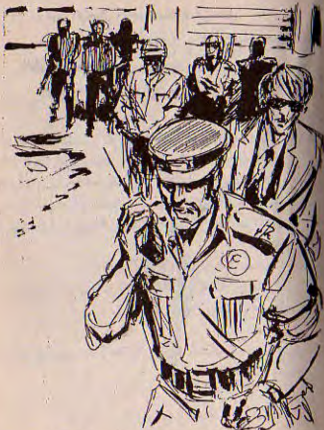
وضغط زرّ جهاز اللاسلكى الذى يحمله ، وهو يقول فى حدة :