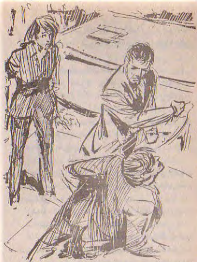
هو (أدهم) على فكه بلكمة كالفضيلة ، زلزلت كيانه كله ، وأسقطته أرضاً في عنف ..

- النجدة يا رجال .. النجدة .. الحاكم في خطر . أطلقت (منى) رصاصات ممدسها على (روكو) و (ماثيو) ، ولكنها فوجئت بهما يواصلان انقضاضتهما في وحشية ، ويهاجمانها في شراسة ، و (ماثيو) يضرب ممدسها ، صارخاً : - ليس هذه المرة أيتها الجميلة .. لقد احتطنا للأمر . أما (أدهم) ، فقد قفز (برنارد) نحوه في غضب هادر ، وهو يصرخ : - لن تبيع هذه المرة أيها الشيطان .. لن تخرج من هنا إلا على جثتي . استقبله (أدهم) بلكمة ساحقة في معدته ، وهو يقول : - لو أنك تصدّ . ثم أعقبها بثانية في فكه ، مضيفاً : - فسيسدنني أن أفعل . وفي نفس اللحظة ، كانت (منى) تكلم (ماثيو) بكل قوتها ، ثم تدور على عقبها لتركل (بروكو) في وجهه ، ولكن هذا الأخير تراجع في حركة سريعة ، واستل ممدسه ، صالخاً : - هيا .. قاتلي رصاصاتي . ولكن يد (أدهم) جذبته من عنقه في قوة ، وهوت اليد الأخرى على أنفه ، و (أدهم) يقول في صرامة :