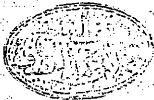
لوحة العنوان من النسخة (ج)