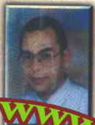
أحمد خالد توفيق