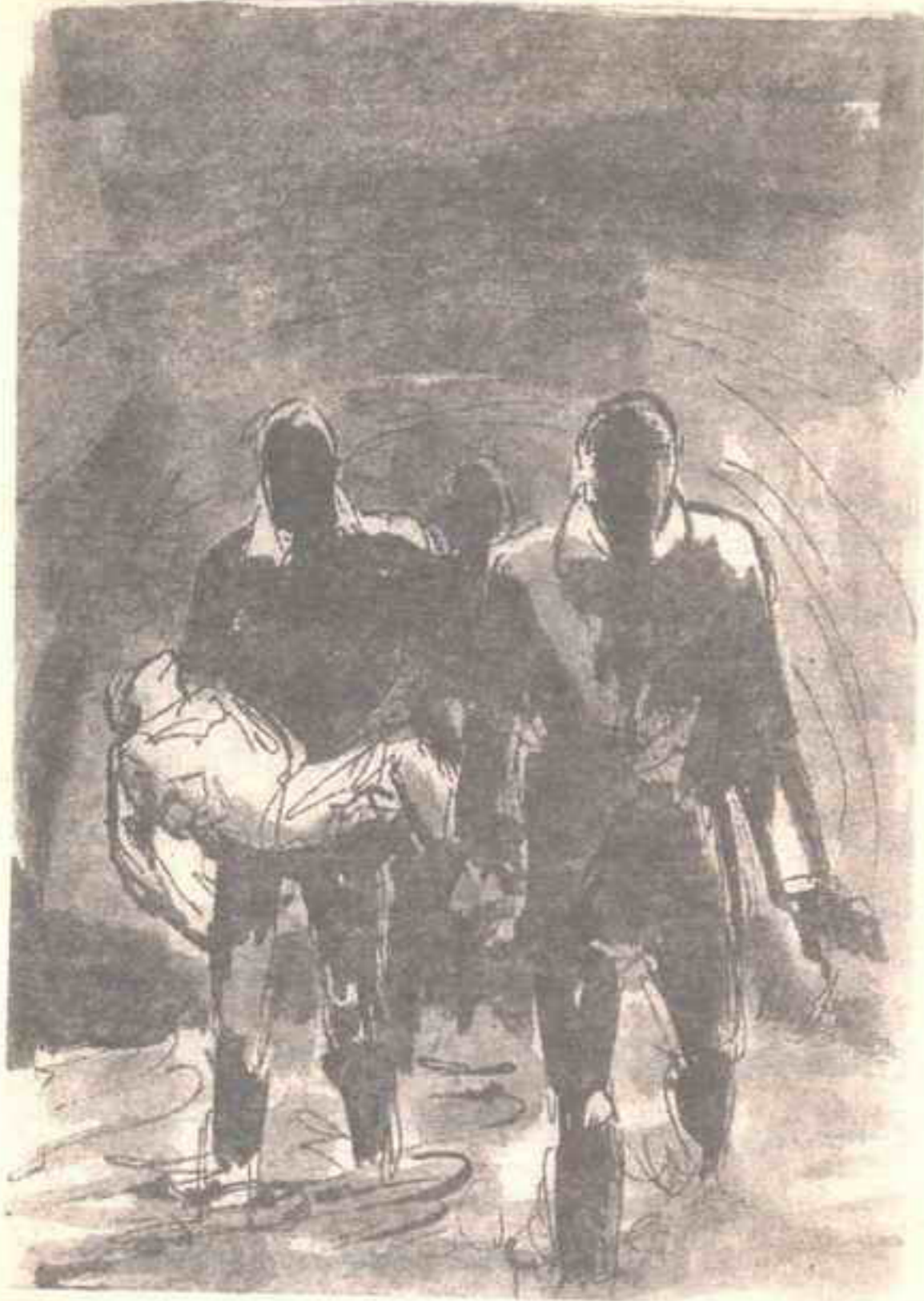
ورحنا نركض لاهئين .. ومياه المجارى تتناثر تحت أقدامنا ..

همست ( سلمى ) وقد فهمت ما يدور بخلدى : - « هلم .. لقد فعلها ( بونابرت ) مع مريض طاعون فى ( عكا ) .. ولم يكن هناك علاج للمرض وقتها .. » - « يا سلام ! لقد فعلها ( بونابرت ) كى يزيل مخاوف الأطباء من المرض ويضرب لهم مثلاً شجاعاً .. وربما فعلها تظاهراً كى يتحدث عنه التاريخ بإعجاب .. لكن ماذا أحاول إثباته أنا ؟ »