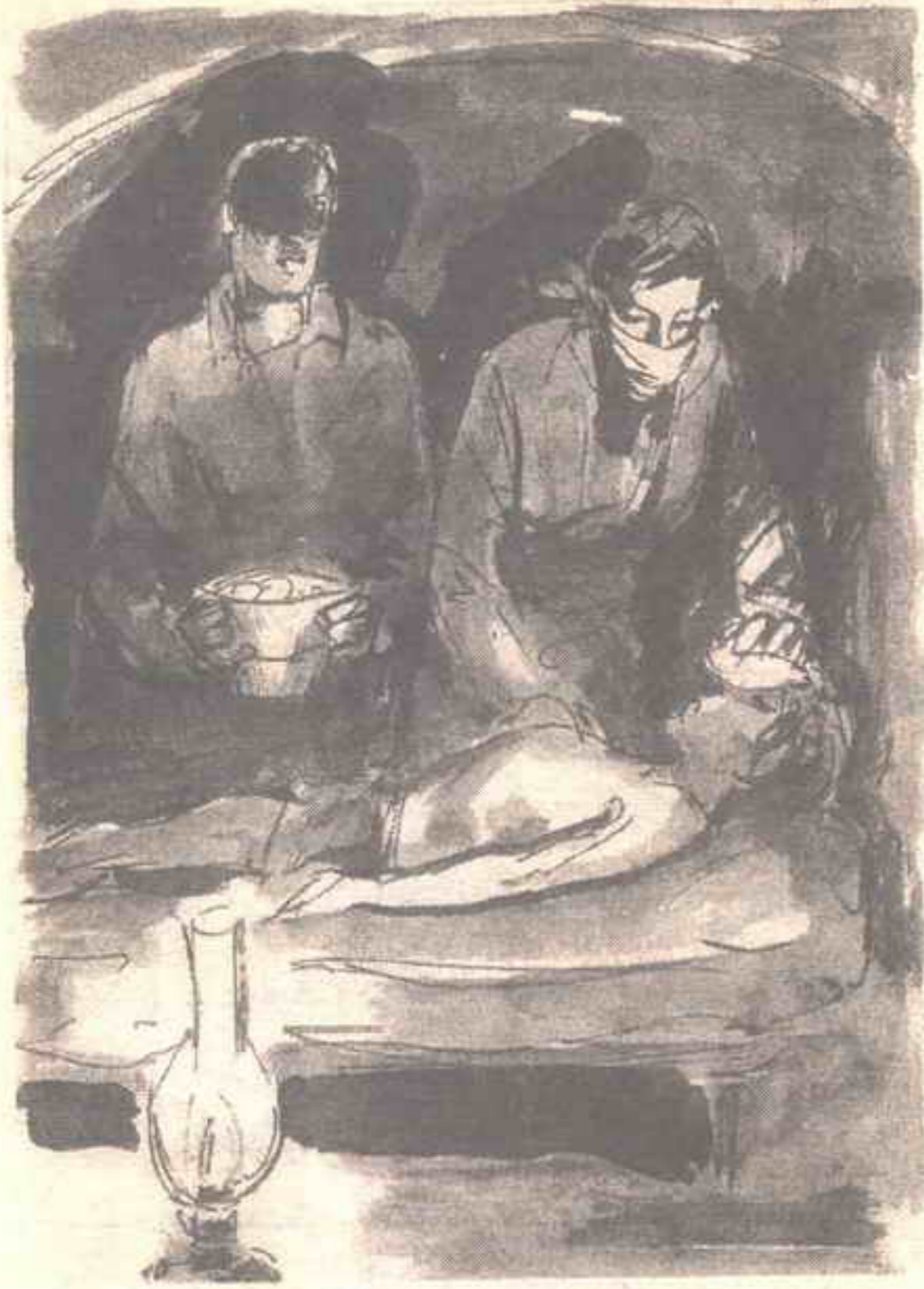
وراحت تضع الكمادات للصبى مستعملة دلوًا مليئًا بثلج مجروش من الشارع ..

- « سأعنى به .. أعرف أننى أستطيع العناية به .. »