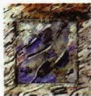
Mohamed KACIMI (1942 - 2003) Compition, 1986

- التأكيد المتجدد على أهمية حقوق الإنسان والتقدم الحاصل على مستوى «القانون الإنجازي»، كما هو الشأن بالنسبة لمفهوم «الجرائم ضد الإنسانية» ومؤسسة «المحكمة الجنائية الدولية». وطبعاً، فإن السؤال الأساسي المطروح هو : أي دور سيكون للجامعة في ظل هذه المقتضيات والتطورات ؟