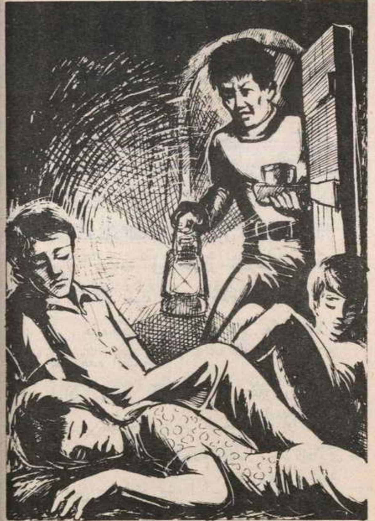
وما إن انتهوا من التجربة ، حتى سمعوا وقع أقدام ورأوا « علوان » يقف بالباب