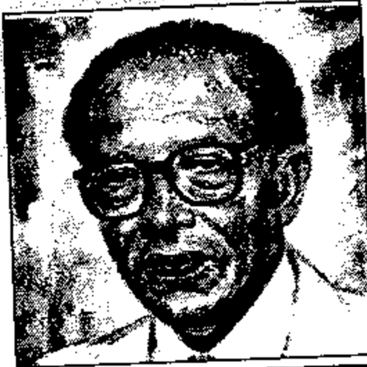
الفصل الخامس عشر

على خط النار على خط النار على خط النار على خط النار