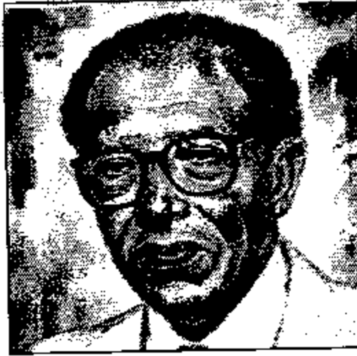
الفصل الثالث عشر

على خط النار على خط النار على خط النار على خط النار