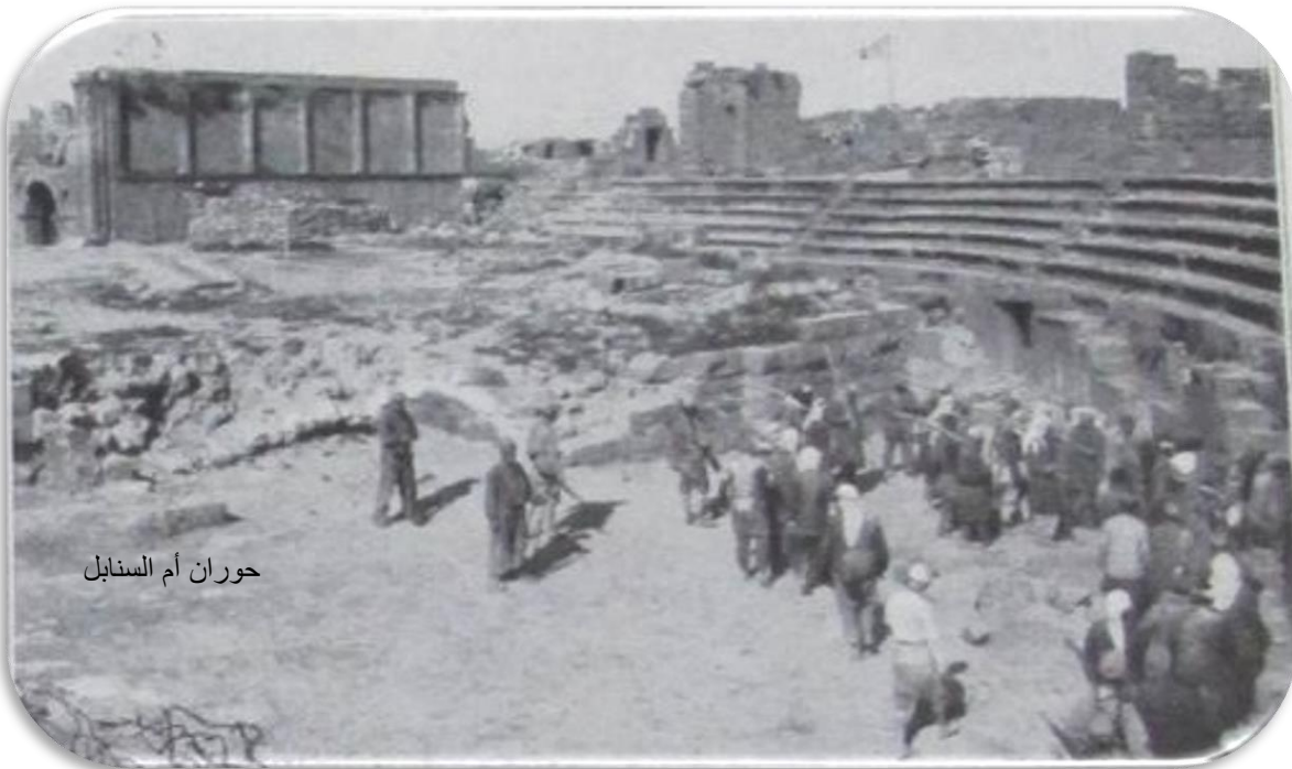
حوران أم السنابل