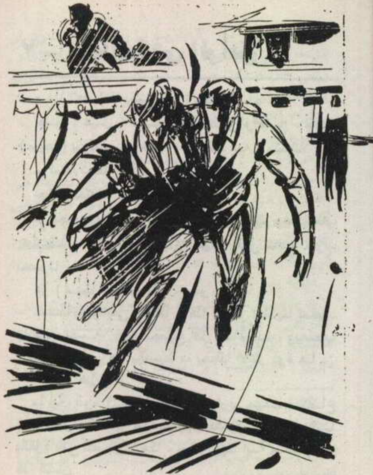
ومع صيحته ، قفز (سيف) ، وهو يحمل (فاتن) ، التي أطلقت صرخة عاب هائلة ، امتزجت بدوى رصاصات (ويليامز) ورجاله ..