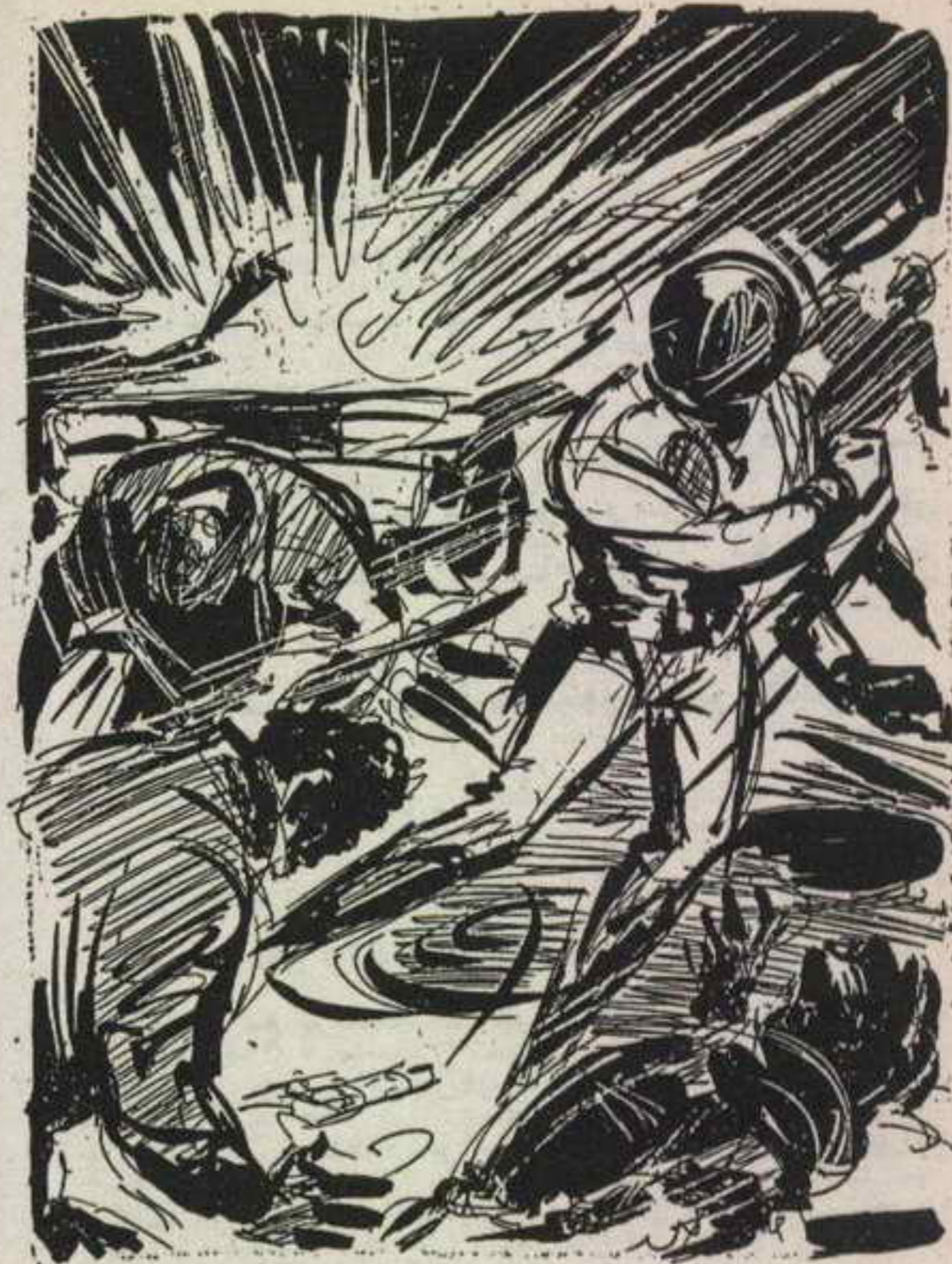
وهو يبرز من فتحة صرف أرضية ، وينقض على رجال ( جاكسون )

ومع قولها ، لمح ( سيف ) فريقين الرجال ، اللذين يعدوان نحوه من جانبي الشارع في نفس اللحظة التي ارتفع فيها صوت ( جاكسون ) الغاضب ، وهو يهتف :