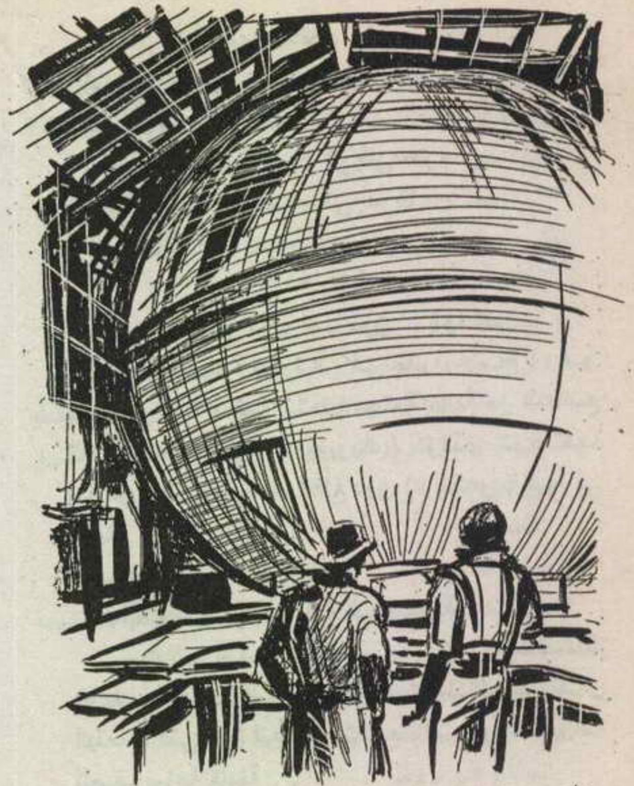
نطق ( سيجا ) عبارته ، في ظفر واضح ، وهو يشير إلى كرة ضخمة ، تحتل مساحة هائلة من المصنع القديم ..