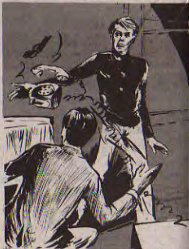
كانت هذه اللحظة التي استغرقها تولر الشاب كافية ، ليقذف (أدهم) بجهاز التليفون ، وليصيب يد الشاب ويظهر منها المسدس ..