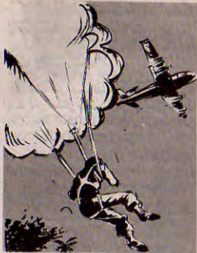
ثم جذب المظلة بقوة ، فأرضعت الطفلة في الهواء ..