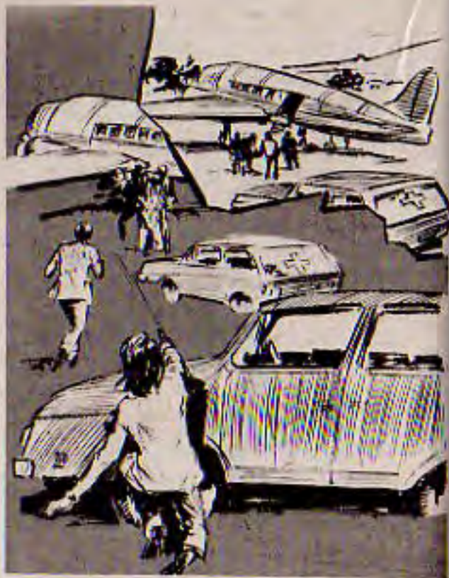
ولى نفس اللحظة احست (منى) بالسيارة ، وأخذت تطلق النار على سائق الإسعاف ومعاونيه ..

قال (أدهم) وهو ينظر إلى الطريق : - ربّاه !! لقد انتهوا من نقله إلى الطائرة .. لا بد أن نصل بسرعة ، سيحاول هؤلاء المجانين إيقافنا . ثم قذف إليها بالمسدس ، وقال : - عندما أوقف السيارة ، ابدئي فى إطلاق النار فورًا ، وسأحاول أنا الوصول إلى الطائرة .