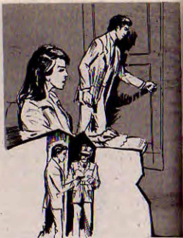
أسرعت (منى) تخرج مسدسها من الحقيبة ، وتناوله لـ (أدهم) ، الذى سار على أطراف أصابعه إلى الباب ..