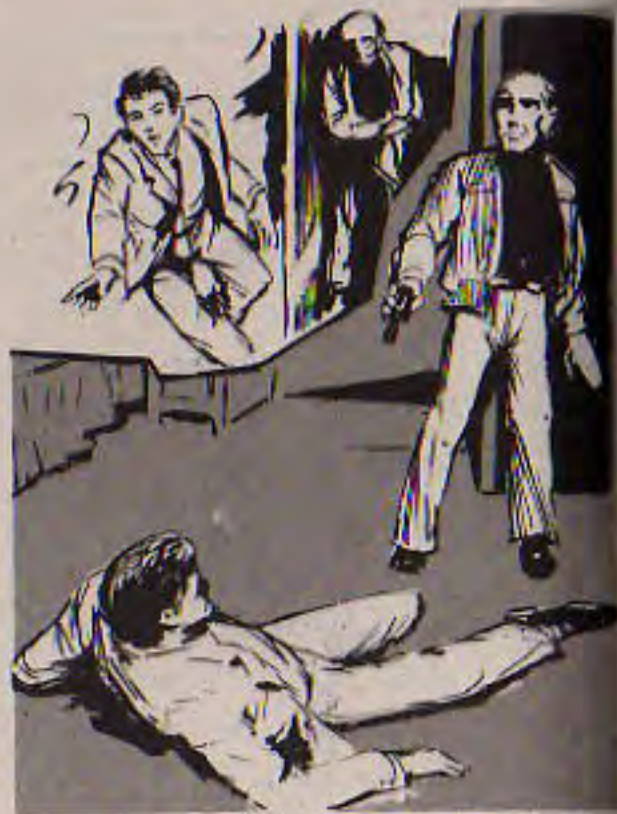
دفع أحدهم الباب بقوة ، فاصطدم به ( أدهم ) وألقاه أرضاً ..

على باب الغرفة .. أسرع يسحب مسدسه وهو يقترب من باب الغرفة ويقول :