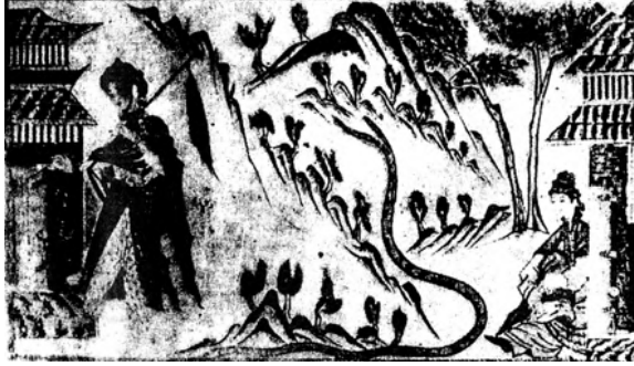
الجبال في الطريق إلى بلاد التبت: صورة في مخطوط من كتاب «جامع التواريخ» لرشيد الدين مؤرخ بين عامي ٧٠٧-٧١٤هـ/١٣٠٦-١٣١٤م.

ثم شاء القدر أن هبت على مرسى قاليقوت عاصفة شديدة، قذفت إلى عرض البحر بالمركب الذي كانت فيه الهدية التي يحملها الوفد إلى ملك الصين ولكن ابن بطوطة نفسه كان وقتئذ بالشاطئ. وكان متاعه وغلماؤه وجواريه بسفينة أخرى. فلما رأى أهل هذه السفينة ما حل بالسفينة الكبرى التي كانت تحمل الهدية ألقعوا، وبقي ابن بطوطة منفرداً على الساحل لا يملك إلا عشرة دنانير وبساطاً كان يفتريه. فلم يشأ أن يعود إلى سلطان دهلي؛ بل تنقل بين الساحلين الغربي والشرقي في شبه جزيرة الهند. واشتغل حيناً بالغزو والجهاد في خدمة جمال الدين سلطان مدينة هنور.