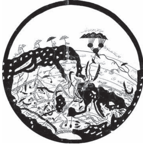
خريطة الكرة الأرضية للشريف الإدريسي. (عن كتاب الرواد).

والمعروف أن ياقوت لم يدون أخبار رحلاته. ولا ريب في أن ما شاهدته في أسفاره وما جمعه من الخزائن التي نقب فيها، كان خير عدة له في تأليف كتابه «معجم البلدان» الذي امتاز بترتيبه على حروف الهجاء، وبدقته واتساعه وجمعه بين الجغرافية والتاريخ والعلم والأدب، حتى إن أحد المستشرقين قال فيه: إنه من المؤلفات التي يحق للإسلام أن يفخر بها كل الفخر. ١ وقد فرغ ياقوت من تأليف هذا المعجم في سنة (٦٢١هـ/١٢٢٤م). ومما يؤسف له أننا لا نستطيع أن نحدد مقدار ما أفاده ياقوت من رحلاته تحديداً دقيقاً. فإنه نقل في معجمه عن كثير من الجغرافيين والرحالة والمؤرخين، ولم يعين الأقاليم التي زارها بنفسه وكتب عنها مشاهداته الخاصة؛ مع أنه كان من أكثر العلماء طوافاً في عصره، ومن أشدهم عناية بالتاريخ الطبيعي ومظاهر الثقافة الشاملة، ومن أبعدهم عن الأخذ بالخرافات والأساطير. وقد عني أحد المستشرقين "Heer" في نهاية القرن الماضي بدراسة معجم البلدان، وأخرج بحثاً في المراجع التاريخية والجغرافية التي