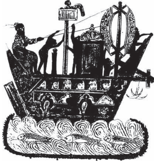
رسم سفينة عربية في مخطوط من القرن السابع الهجري (١٣م). (عن فييت).

وما زالت الملوك تراعي بقاء هذه الآثار، وتمنع من العيث فيها والعبث بها، وإن كانوا أعداء لأربابها. وكانوا يفعلون ذلك لمصالح: منها لتبقى تاريخاً يتنبه به على الأحقاب ... ومنها أنها تدل على شيء من أحوال من سلف وسيرتهم وتوافر علومهم وصفاء فكرهم وغير ذلك. وهذا كله مما تشتاق النفس إلى معرفته وتؤثر الاطلاع عليه.