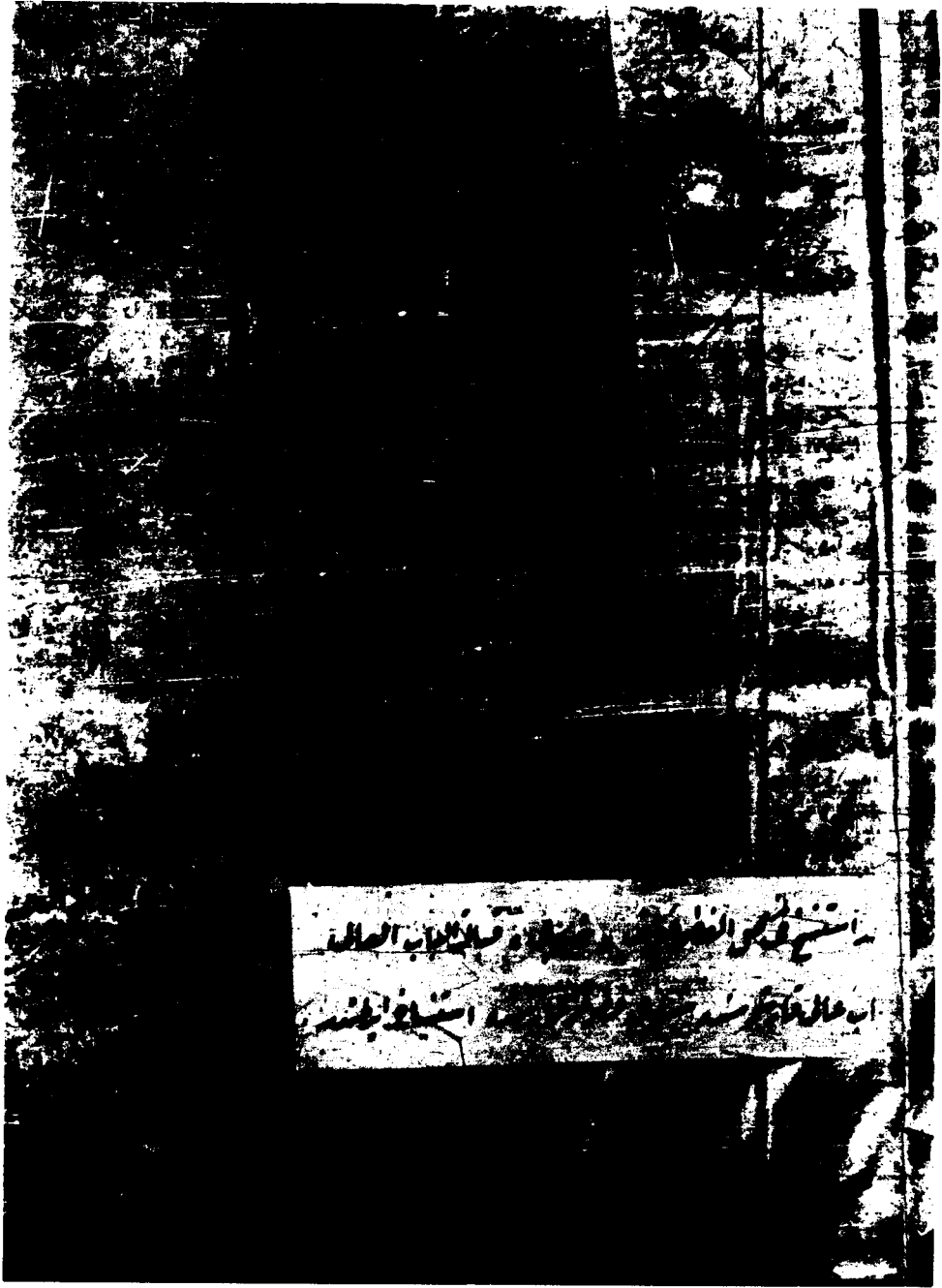
صورة العنوان من النسخة [ خ ]