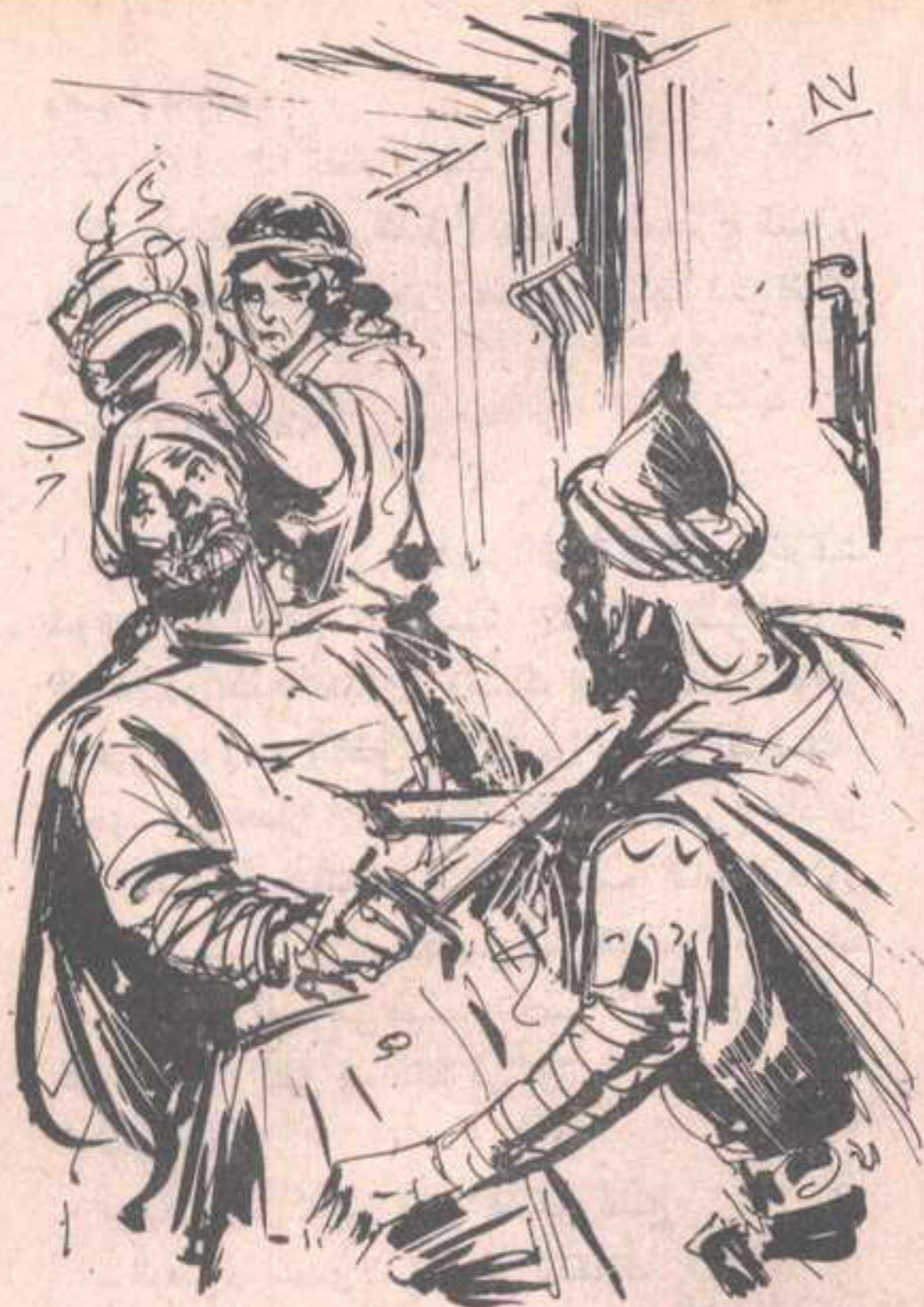
ومع عنف الضربة ، تراجع (مهاب) ، ودار رأسه في قوة ، فوثب (بابلو) نحوه ، ودفع سيفه في صدره ..

ومع عنف الضربة ، تراجع (مهاب) ، ودار رأسه في قوة ، فوثب (بابلو) نحوه ، ودفع سيفه في صدره ، صانحا :