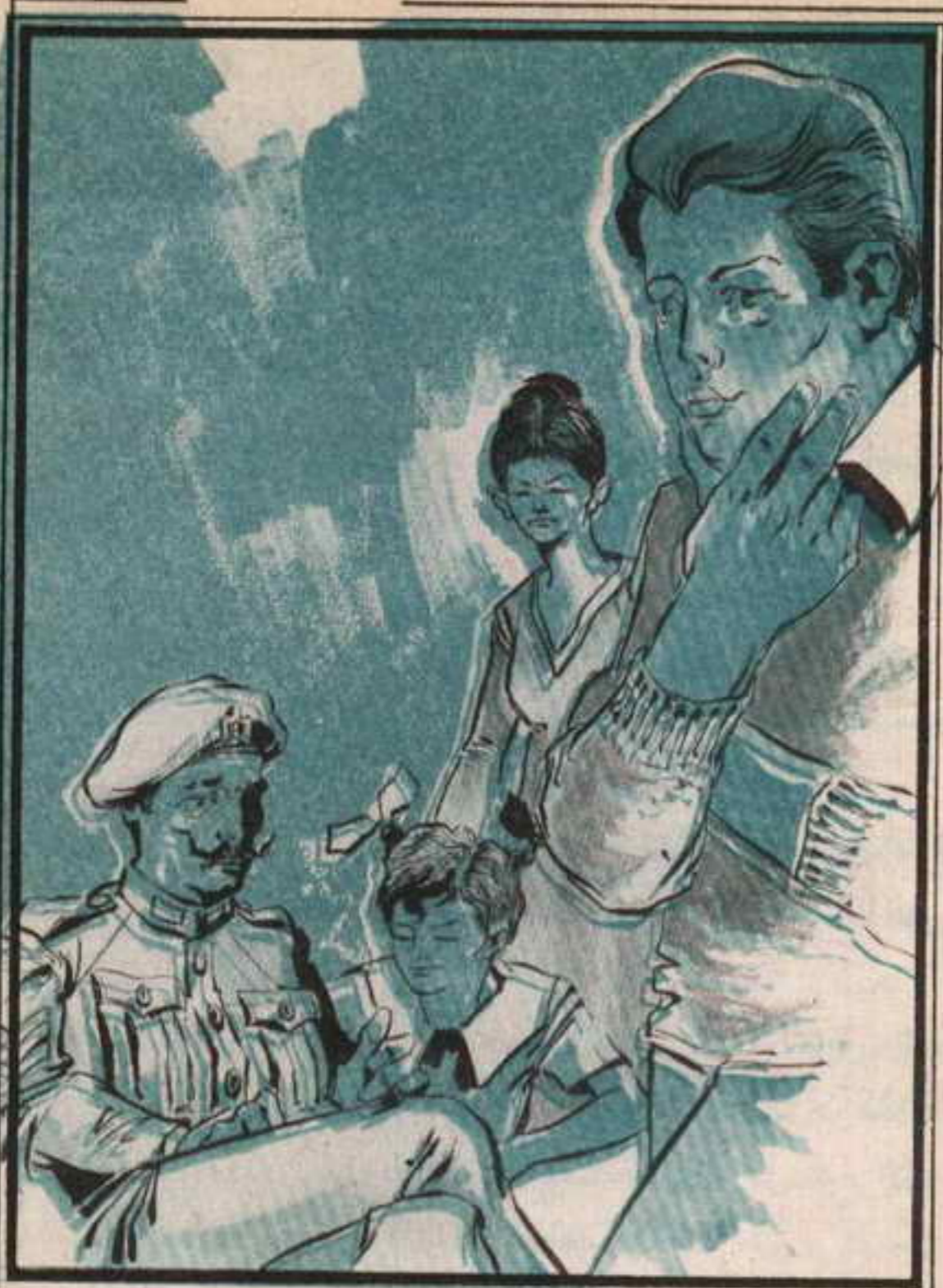
قال الشاويش بصوت حزين: ألم يظهر «عاطف» بعد؟

لا تقومون بإحدى مغامراتكم الغريبة؟ تختخ: إننا لا يمكن أن نخفي عنك هذا. فإن غياب «عاطف» يقلقنا جدًا. وبالمناسبة هل استجوبتم الشغالة التي تعمل عند «حزاوي»؟!