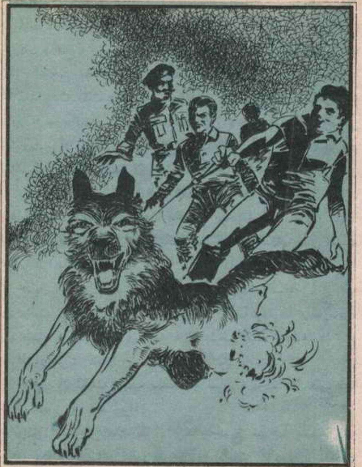
انطلق « زنجر » كالسهم والأصدقاء خلفه . . وكان « تحتخ » يمسك بمقود الكلب حتى لا يتعد عنه . .