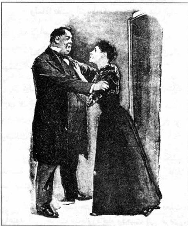
Sydney Paget 1892

ولكنه غالى في إظهار تملّقه وظهر ذلك في نبرات صوته، ولذلك أخذت حذري منه فأجبت قائلة: لقد دخلت إلى الجناح الخالي لحماقتي، ولكنه