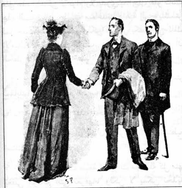
Sydney Paget 1892

قالت بامتنان: إنني سعيدة جداً بقدمكما، هذا