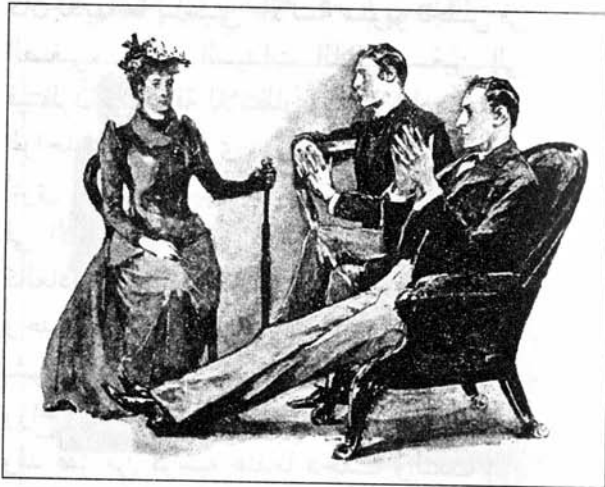
Sydney Paget 1892

لاحظت أن هولمز قد أعجب بأسلوب عميلته الجديدة، فقد نظر إليها بتفحص كعادته، ثم أرخى جفنيه وجمع أطراف أصابعه معاً ليستمع إلى قصتها.