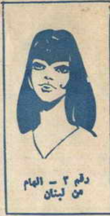
رقم ٣ - الهام من لبنان