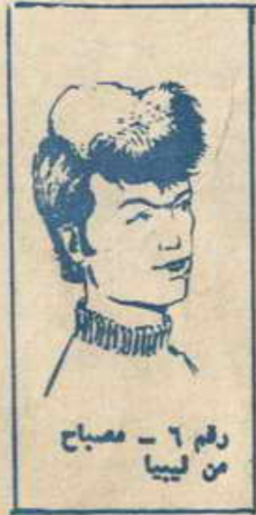
رقم ٦ - مصباح من ليبيا