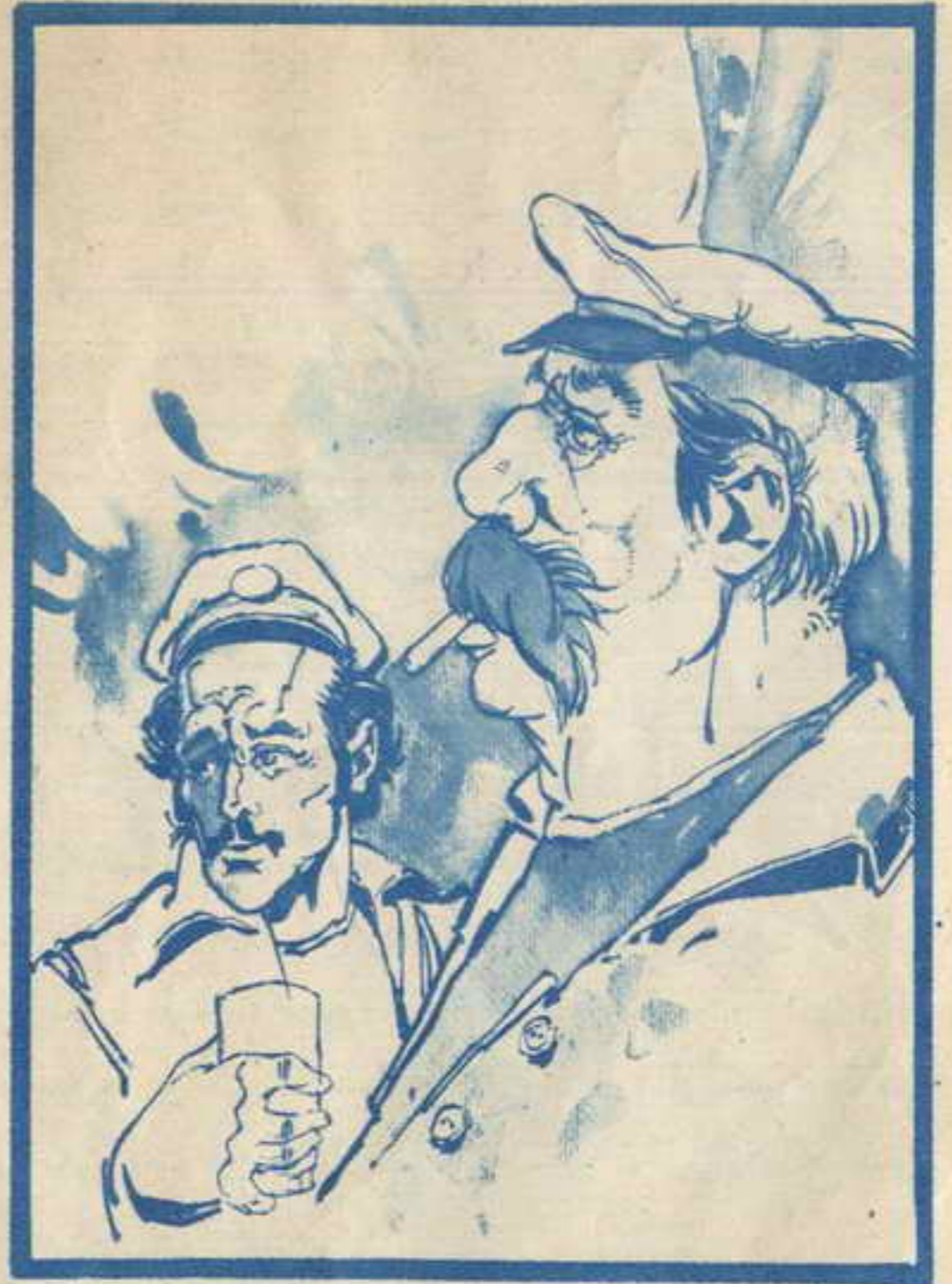
كان أحد البحارة ضخيم الجسم ، أحمر الوجه ، يغطي نصف وجهه شارب كثيف ، وعلى ساعده الأيمن وشم أخضر ، أما الآخر فكان ضئيل الجسم يبدو عليه الدهاء •

نظر « أحمد » إلى الشياطين بسرعة ، غير أن البحار