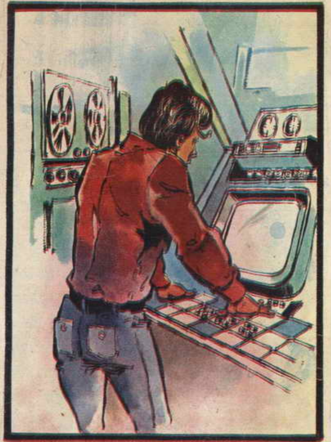
كان قسم المعلومات يعتمد على ذاكرات اليكترونية فضغط "أحمد" الأزرار، فظهرت شاشة صغيرة، وبدأت المعلومات تتوالى .

كان الشياطين هناك ، يجلسون في شكل حلقة ، ودار حوار سريع بينهم ، تحددت في نهايته المجموعة التي سوف تنطلق ، كانت المجموعة تضم : « أحمد » ، « خالد » « بوعمير » ، « عثمان » ، وتحركت المجموعة ، كل واحد إلى حجرتة ، على أن يتم اللقاء في السيارة بعد ربع ساعة . أسرع « أحمد » إلى حجرتة ، وعندما كان يعد حاجياته وصلته رسالة من رقم ( صفر ) : المعلومات التي وصلت الآن ، تقول أن ( القمر ) أفرغت حمولتها في مكان مجهول ، قريبا من « مدغشقر » ، وأنها قد تأخرت يومين ، قبل وصول الجزيرة ، مع أن الجو كان في صالحها ! قرأ « أحمد » الرسالة ، فكر قليلا ، ثم أرسل رسالة إلى الشياطين : سوف أتأخر قليلا ، هناك رسالة هامة من رقم