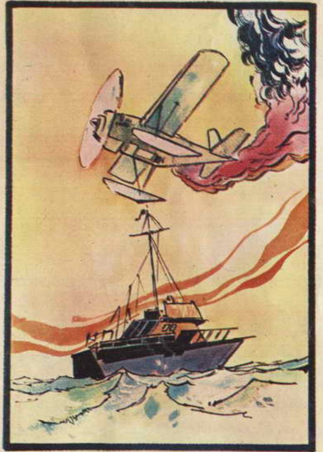
أخرج أحمد ماسورة المدفع الرشاش من نافذة اللنش ، وأحكم النيشان في اتجاه طائرة الاستطلاع ، وأحكم النيشان ، ثم أطلق دفعة طلقات .

ظل « خالد » يتقدم . كان يندفع بسرعة ، يساعده التصميم الخاص لملابس الغوص التي يلبسها الشياطين ، وانقضت ساعة ، عندما تلقى رسالة من « أحمد » تقول : « عثمان » يقترب من النقطة « ج » ! .