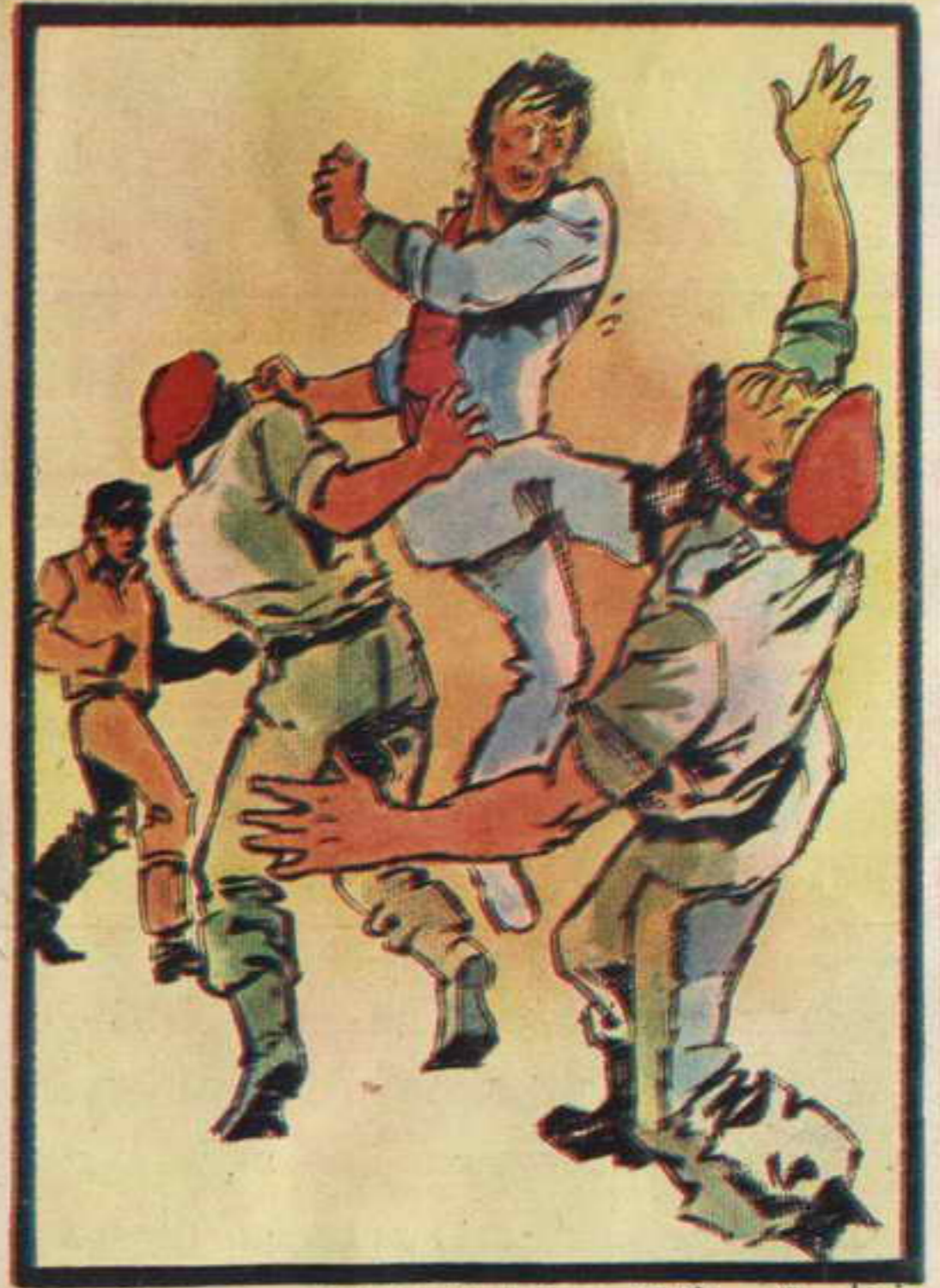
رفع أحمد يده إشارة البدء ، فطار الشياطين في الهواء ، وضربوا الرجال الأربعة في وقت واحد .

همس « أحمد » : لا بد أن هناك منطقة أخرى سرية ! أخرج جهاز الإرسال ، ثم أرسل رسالة إلى « عثمان » ومرة أخرى لم يتلق ردا . ضغط زر الإشارات ، فلم يضيء . قال لقد انتقل « عثمان » إلى منطقة بعيدة جدا عنا ! كان الموقف صعبا الآن . فالحراسة شديدة . والعدد الذي يقوم بها كبير . همس « بوعمير » : علينا أن ندخل المبنى ! ..