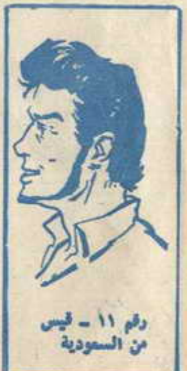
رقم ١١ - فيس من السعودية