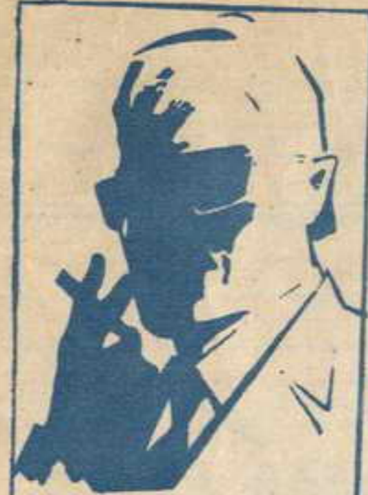
رقم صفر الزعيم الفاضل الذي لا يعرف حقيقته احد ..