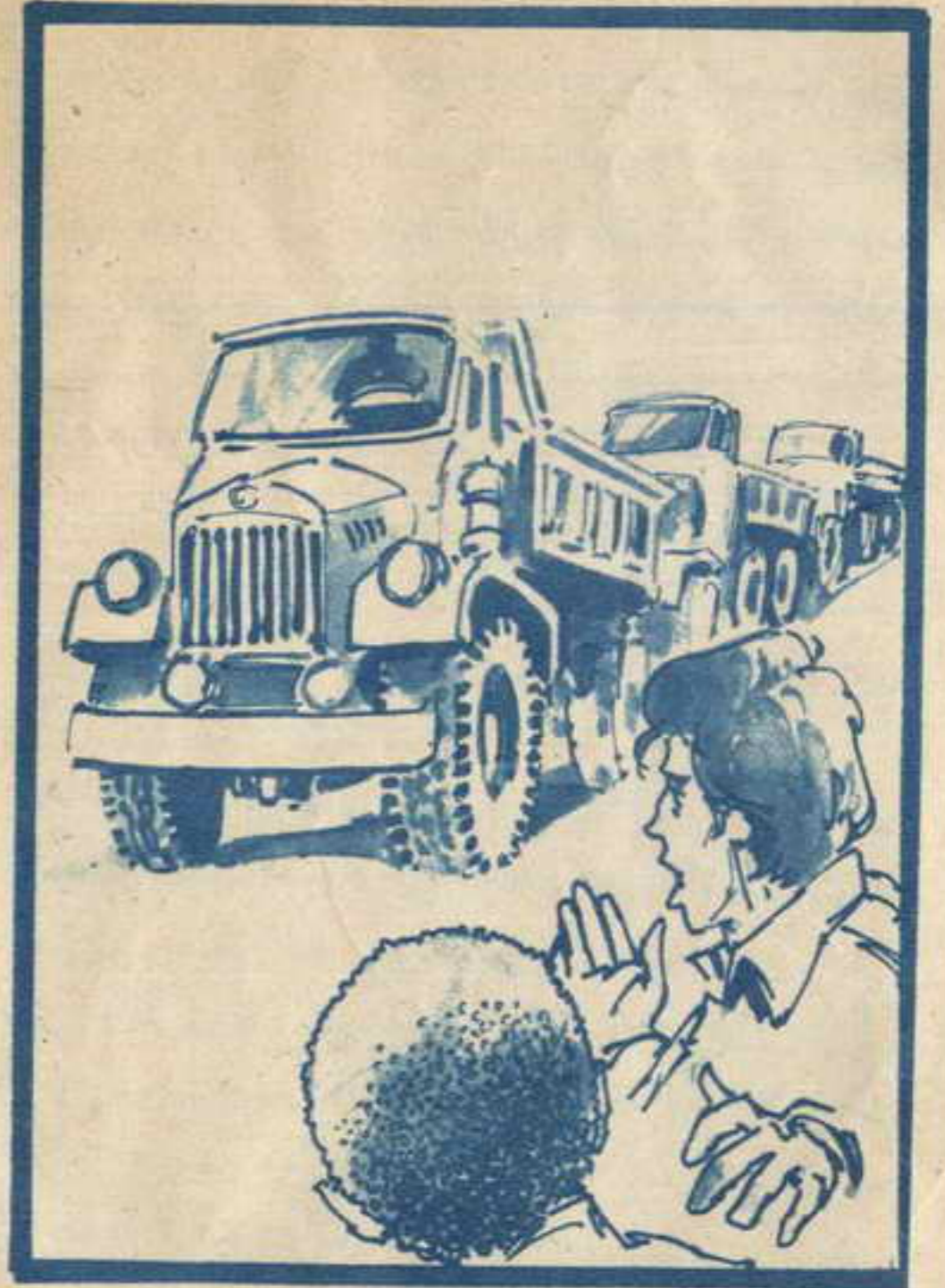
كان طابور من عربات النقل الضخمة يقف ممتداً من باب الميناء حتى مسافة بعيدة ، فقال أحمد : هذه هى تصاريح الدخول •

ابتسم الشياطين ، عندما تحركت أول عربة وهى تأخذ طريقها إلى داخل الميناء فاقتربوا من العربات ، التى كانت تتحرك فى بطء ، ثم اختفوا وتوالى دخول العربات من البوابة ، وعندما تجاوزت العربة العاشرة مكان الشرطى ، كان الشياطين قد أصبحوا فى الداخل ، فلقد قفز كل منهم إلى عربة ، واختفى بين حمولتها ، وعندما أصبحت العربات فى قلب الميناء ، ظهر الواحد بعد الآخر • وكانت هناك مجموعة بواخر ، ترسو عند الأرصفة ، فى نفس الوقت الذى كانت فيه ( الأوناش ) الضخمة تنقل البضائع من العربات إلى البواخر ••