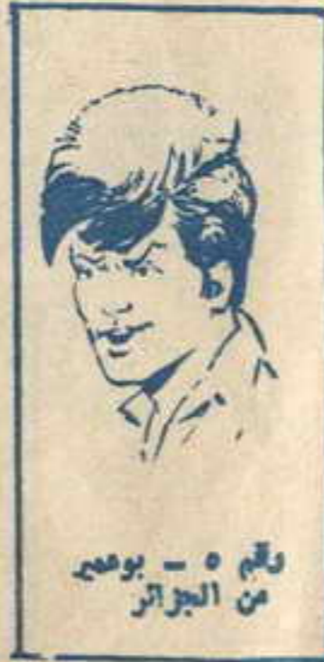
رقم ٥ - بوعصب من الجزائر