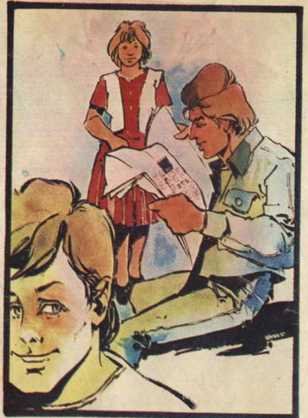
قرأ أحمد في الصحيفة : القمر يغرق في المحيط . فابتسم فهد وقال : لقد علمنا القمر العوم .

أسرع « خالد » بالسؤال : وأين غرقت ! ابتسم « أحمد » وهو يقول : أمام رأس الرجاء الصالح ! . فقال « قيس » : لهذا كنت تحدد الأماكن على الخريطة ! .