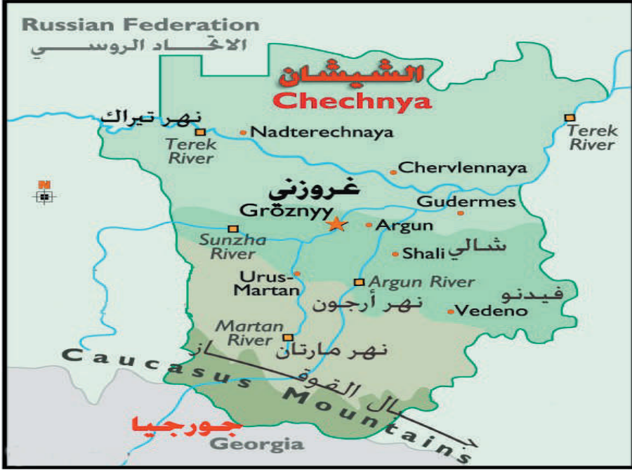
خريطة رقم (٣): جمهورية الشيشان

السادس عشر الميلادي مرت العلاقات الروسية-القوقازية بصراعات دموية لم تتوقف حتى الآن، كانت محصولتها مئات الآلاف من المشردين والقتلى والمصابين في صفوف الشيشانيين، الأمر الذي جعل المطالب الاستقلالي أمراً يصعب التحول عنه؛ خاصة بعد كل هذه التضحيات بالنسبة للشعب الشيشاني.