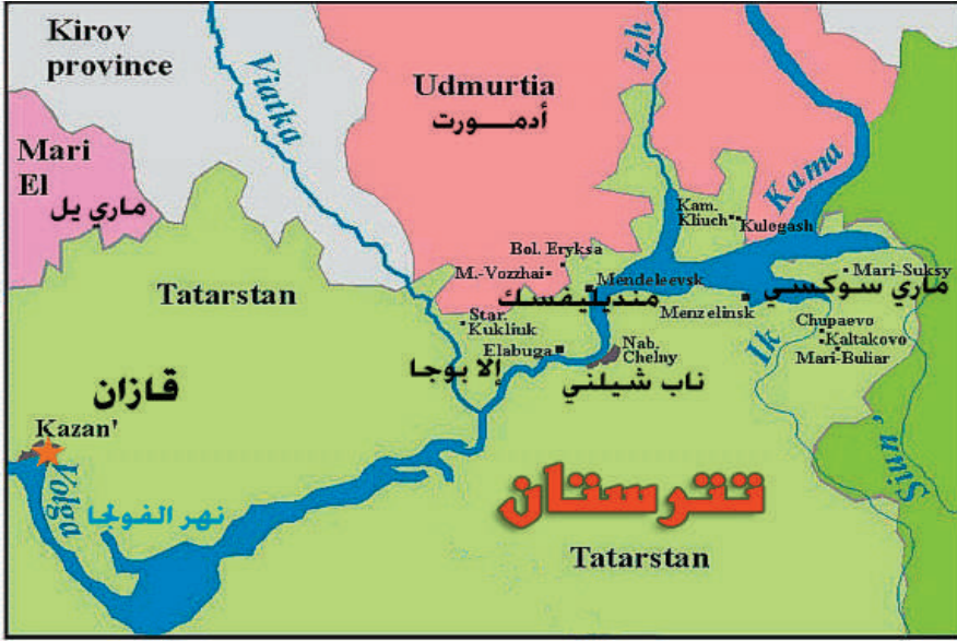
خريطة رقم (٤): جمهورية تترستان

أ- الوضع الاقتصادي المتميز لتترستان؛ مقارنة بالعديد من الجمهوريات الروسية الأخرى: