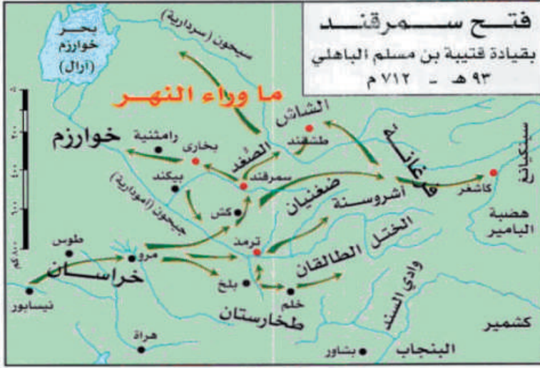
خريطة رقم (١): فتوحات ما وراء النهر

المصدر: أطلس التاريخ العربي الإسلامي للدكتور شوقي أبو خليل . توضح الخريطة الفتوحات الإسلامية لبلاد ما وراء النهر في عهد الوليد بن عبد الملك، حيث قاد جيوش المسلمين قتيبة بن مسلم الباهلي.