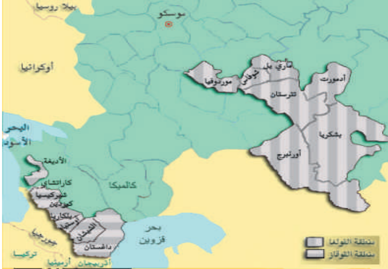
جمهوريات منطقتي الفولغا والأورال (يمين) وشمال القوقاز (يسار)

تمثل معبراً استراتيجياً مهماً في التاريخ الروسي؛ إذ إن التطلع الروسي بالتوسع شرقاً وصولاً إلى مياه المحيط الهادي يعطي أهمية خاصة لهذه الأراضي وما جاورها. يبلغ إجمالي عدد سكان جمهوريات القوقاز السبع - كما هو موضح في الجدول رقم (١) - ما يقرب من ٧ ملايين نسمة، وإذا استثنينا داغستان والشيشان فلا نجد أي جمهورية من تلك الجمهوريات يتجاوز عدد سكانها المليون نسمة. بينما تتميز جمهوريات الفولغا والأورال - كما هو مبين في الجدول (٢) - بالكثافة السكانية النسبية مقارنة بجمهوريات القوقاز. ويزيد مجموع سكان الجمهوريات الست، مضافاً إليها سكان إقليم أرنبرج عن ١٤ مليون نسمة.