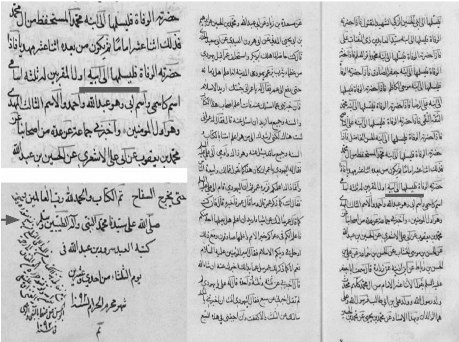
صورة من النسخة الخطية لكتاب (الغيبة) للشيخ الطوسي

ذكر اسم الكاتب وهو سرور بن عبد الله؛ وعليه فإن ضمير «له ثلاثة أسامي» راجعٌ إلى الإمام الحجّة بن الحسن عليه السلام ، وهذه الأسماء الثلاثة (أحمد وعبد الله والمهدي) هي أسماء الحجّة بن الحسن أيضاً، بقريئة الرواية التالية: