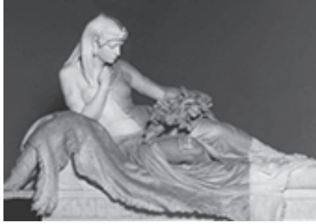
صورة تمثال لها في متحف الفن الحديث بروما.

كليوباترة اسم ساحر خلع عليه التاريخ وخلعت عليه الأساطير من ألوان الفتنة بهاء باهراً تضاءلت إلى جانبه أسماء الزهرة وأفروديت وسميراميس وسائر آلهة الجمال، وهاتسو ونيفرت وسائر الملكات، بل تضاءلت إلى جانبه أسماء الملوك، والشعراء، والكتاب؛ فهي ليست جميلة وكفى، وليست مليكة وكفى، وليست ساحرة الحديث وكفى، وليست ذكية وكفى، وليست أديبة وكفى، بل هي ذلك كله وهي أكثر من ذلك كله، هي الفتنة والسحر والذكاء والأدب والنشاط وقوة الإرادة في أسمى ما تصوره معاني هذه العبارات، وهي مع ذلك آخر البطالسة الذين حكموا مصر عصوراً طويلة كانت مصر فيها مهبط وحي الحكمة والشعر والجمال؛ لذلك لم يُفت مؤرخ ولا قصاص ولا شاعر أن يتحدث عن كليوباترة وأن يتغنى بحياتها، وأن يصور هذه الحياة على النحو الذي يجب أن تكون؛