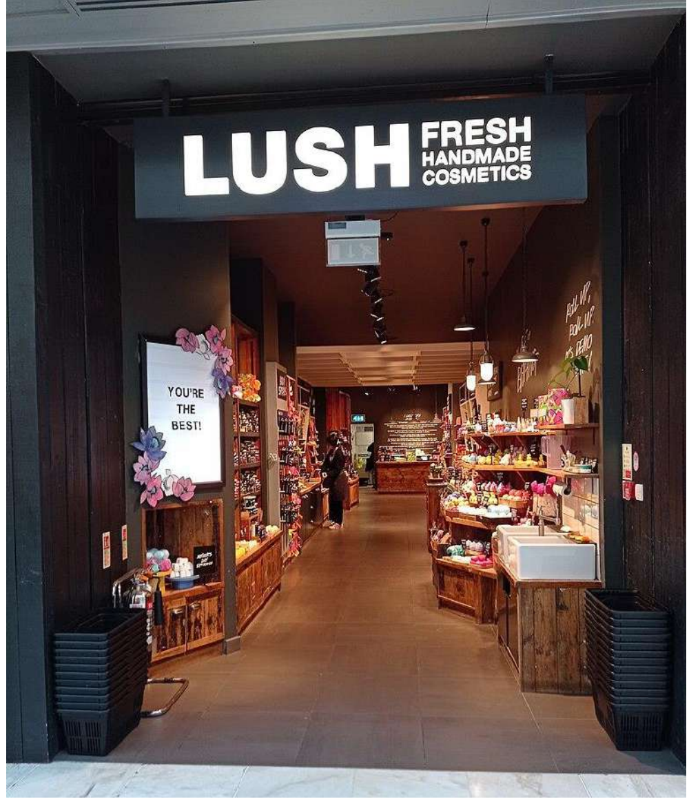
مركز التسوق برينت كروس 15 مارس 2022