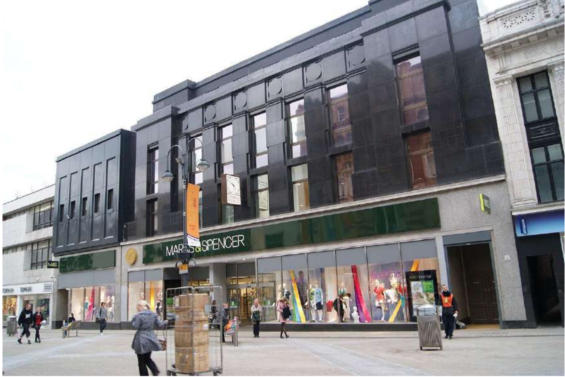
ماركس آند سبنسر في بريجيت في ليدز، غرب يوركشاير.

ومن المنتجات الإسرائيلية التي تسوقها ماركس آند سبنسر كل من العنب والليتشي والتين والبرقوق والتمر والأعشاب الخضراء والبطاطا والبطاطس، وكثير من تلك المنتجات يرد إلى الشركة عن طريق شركة كرمل أغريكسكو، وهي شركة مملوكة جزئياً للحكومة الإسرائيلية. كما تسوق الشركة كميات كبيرة من ملابس دلتا جليل، أكبر منتج ومسوق للمنسوجات في إسرائيل، كما يعد ماركس آند سبنسر من أكبر المستفيدين من اتفاقية المناطق الصناعية المؤهلة (الكويز) في كل من مصر والأردن.