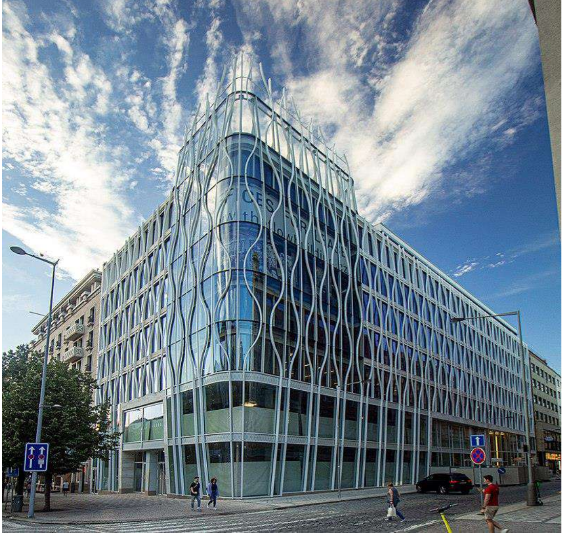
ساحة وينسيسلاس، متجر بريمارك