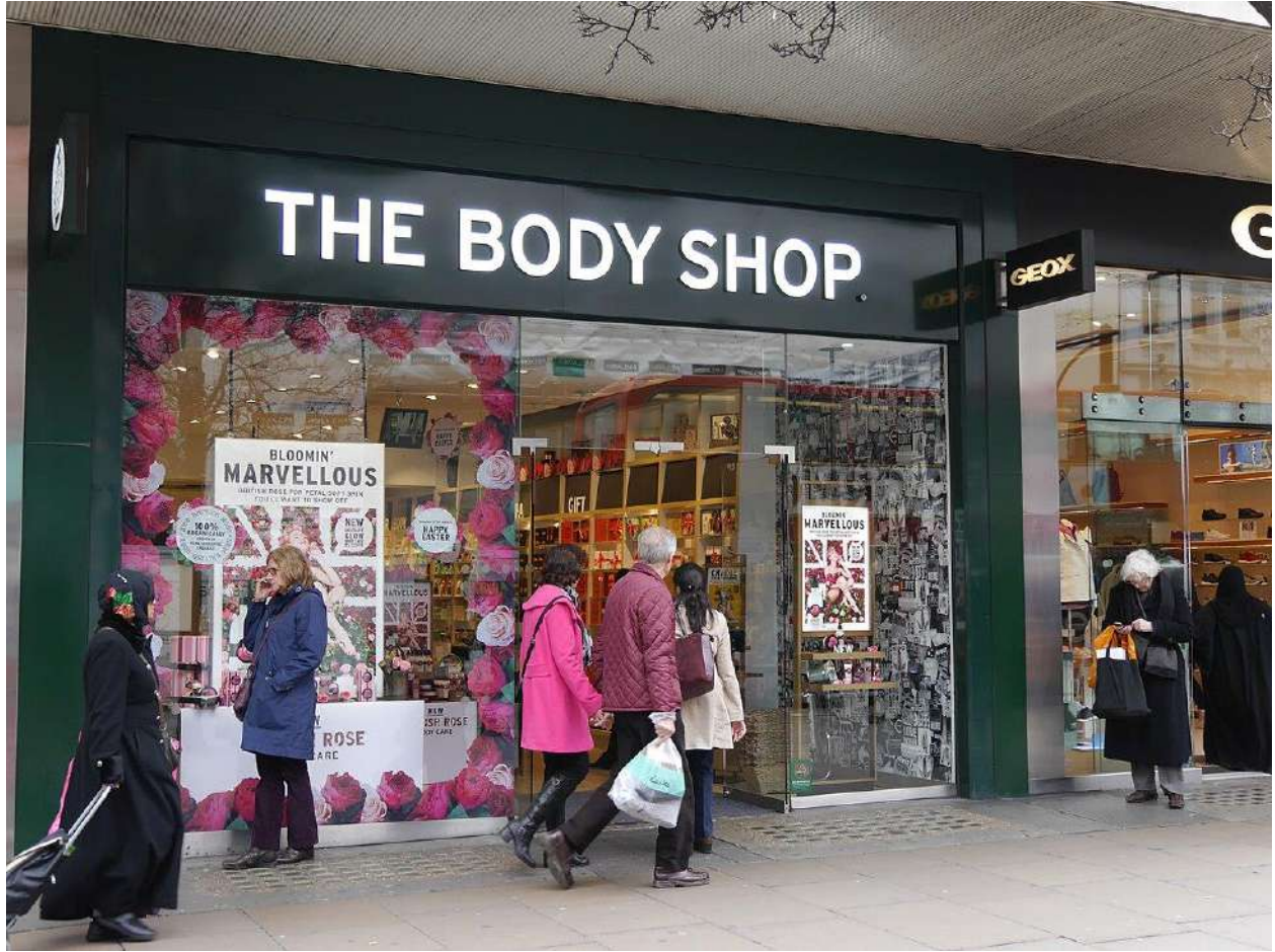
شارع أكسفورد، لندن، مارس 2016