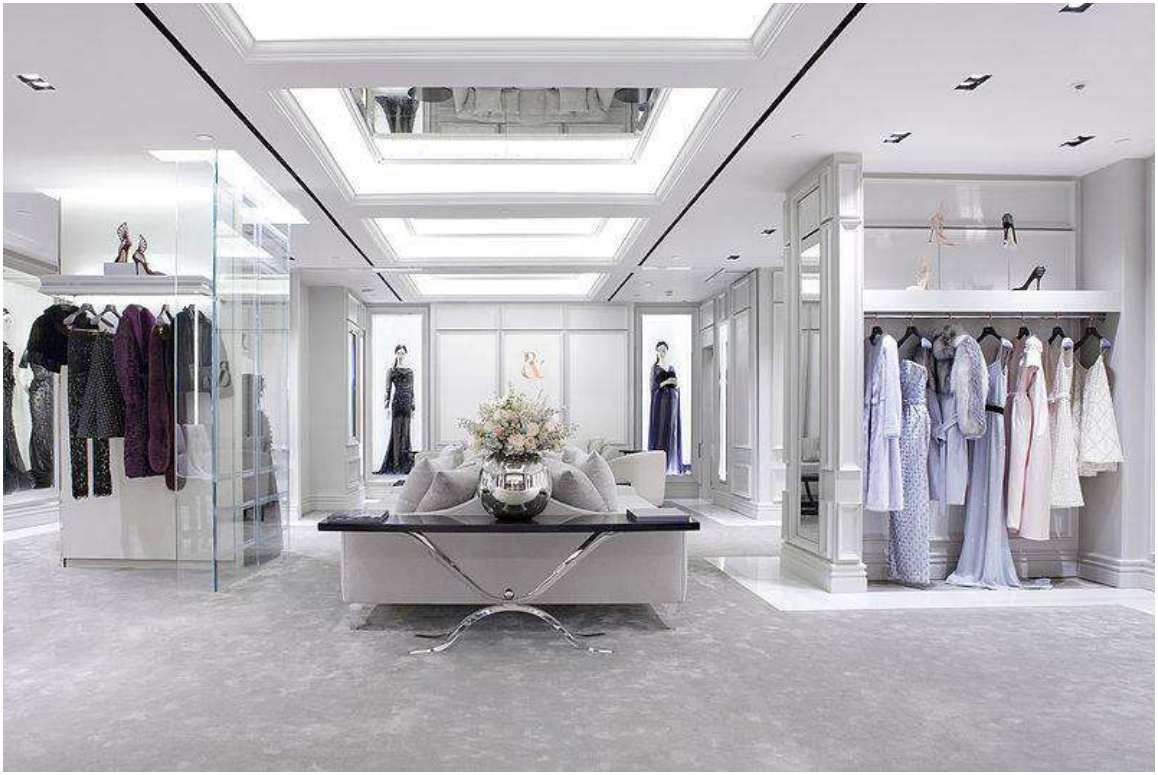
متجر رالف وروسو في لندن

افتتح رالف وروسو متجرهم الرئيسي في منطقة مايفير الراقية بلندن وبعد فترة وجيزة تم افتتاح متجرهم في شارع فرانسوا في باريس. وفي سنة 2015 افتتحت رالف وروسو أول تجربة للبيع بالتجزئة في منطقة هارودز الفاخرة بجوار الماركات العالمية مثل فالنتينو وديور وبرادا وقوتشي.