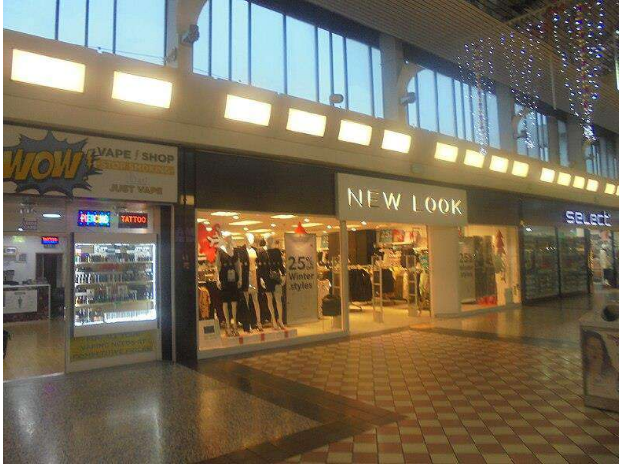
.نيولوك في مركز كروس جيتس، ليدز 2019