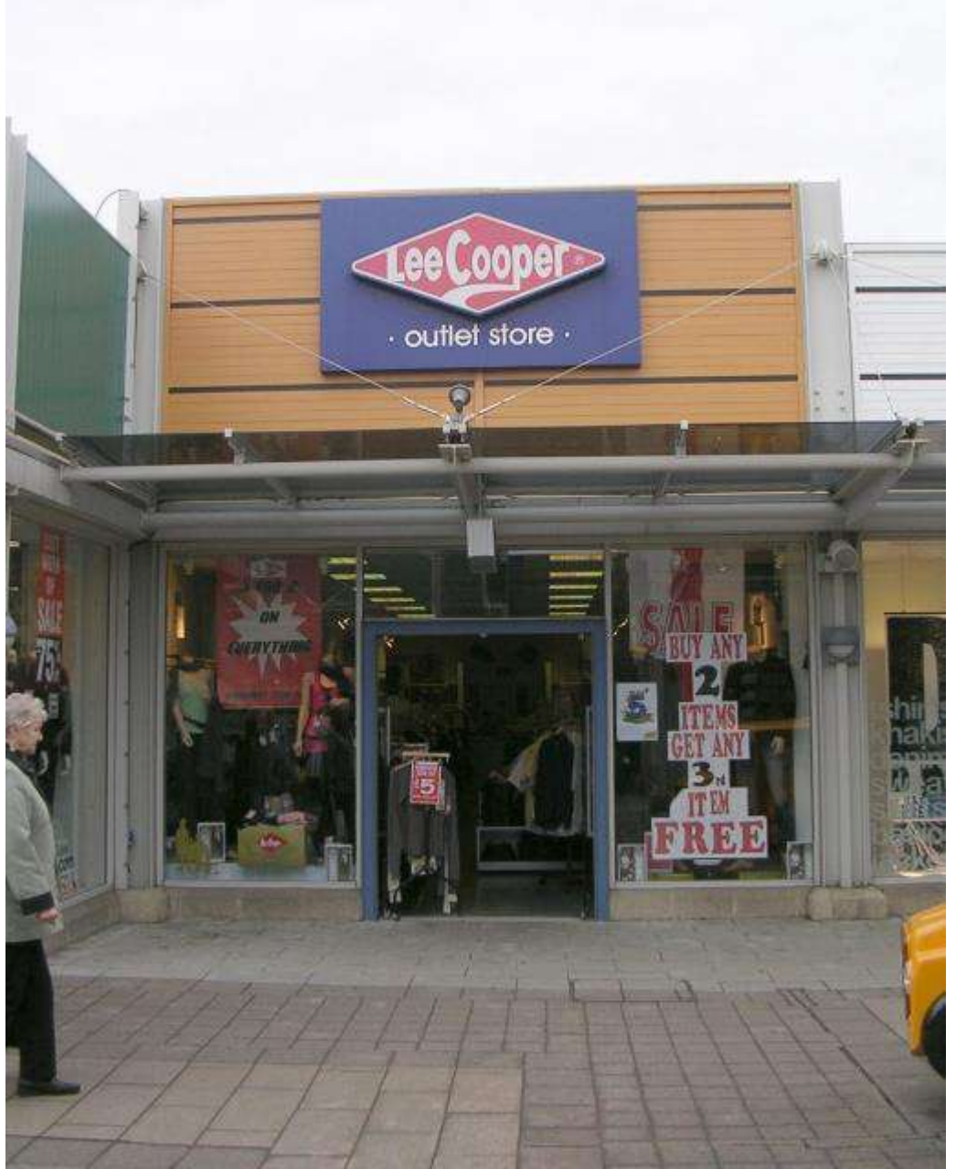
لي كوبر - تقاطع 32