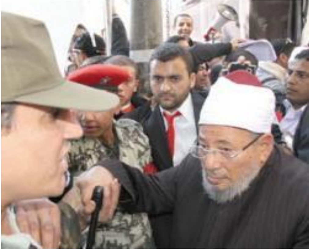
التفاف الشباب حول الشيخ القرضاوي أثناء خروجه من ميدان التحرير بعد أدائه خطبة جمعة النصر