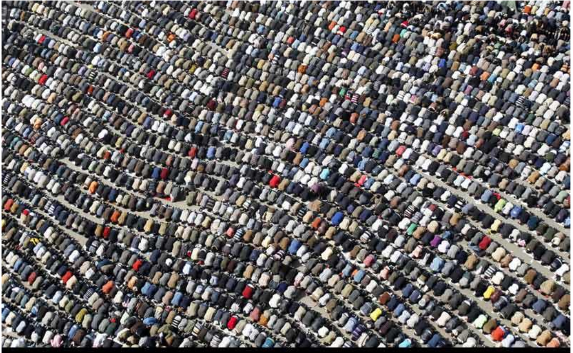
نحو أربعة ملايين يصلون صلاة الجمعة بميدان التحرير خلف الشيخ القرضاوي في جمعة النصر