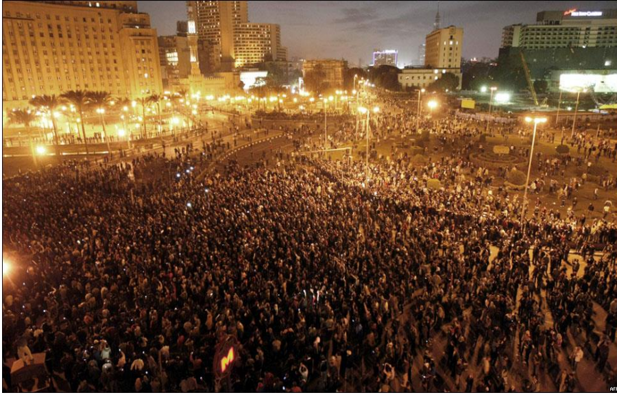
انضمام الشعب بجميع أطيافه لشباب الثورة لتصبح ثورة الشعب كله