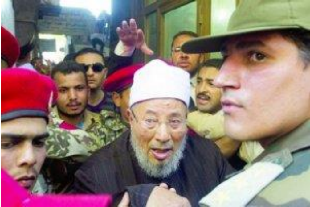
تدخل الجيش لتيسير خروج الشيخ القرضاوي من ميدان التحرير بعد خطبة الجمعة النصر