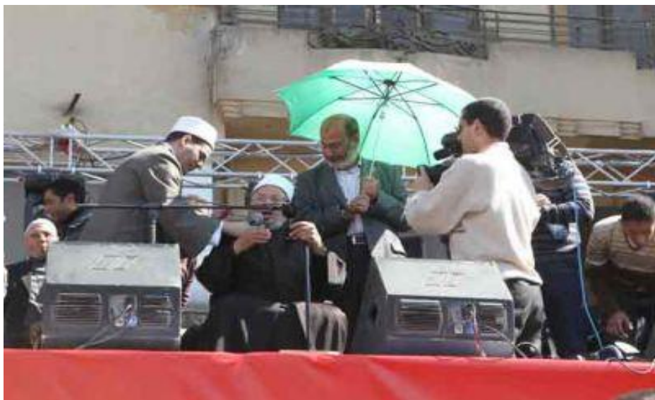
القرضاوي يخطب خطبة الجمعة النصر بميدان التحرير