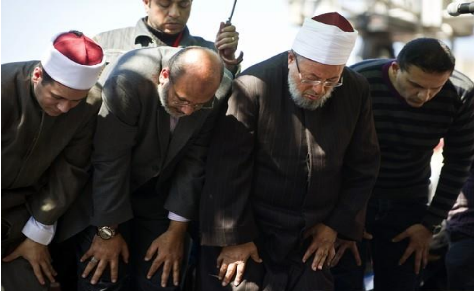
إمامة الشيخ القرضاوي للمصلين صلاة الجمعة بميدان التحرير يوم الجمعة النصر وعلى يمينه الشيخ صفوت حجازي، وعلى يساره ابنه المهندس أسامة يوسف القرضاوي