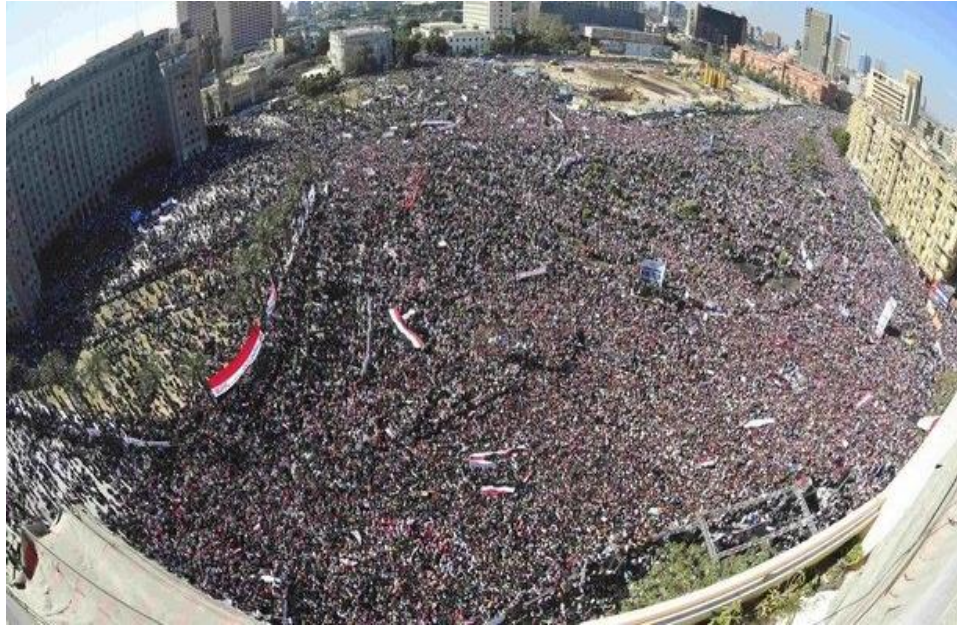
صورة تظهر مدى امتلاء ميدان التحرير بالمتظاهرين