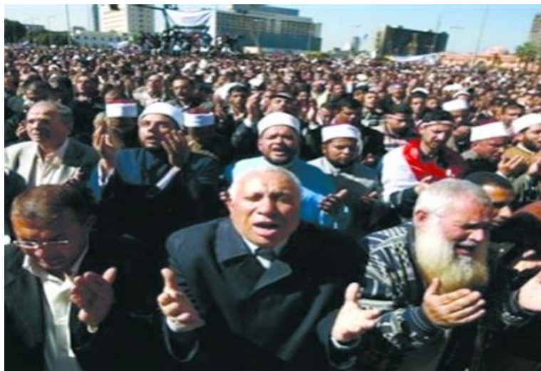
دعاء الشيخ المؤثر في صلاة الجمعة بميدان التحرير