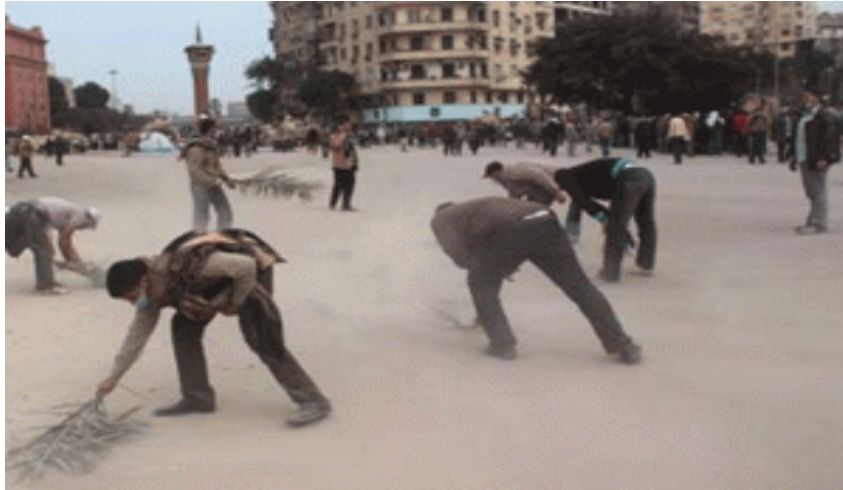
مشاركة الشباب في حملة تنظيف ميدان التحرير بعد الثورة