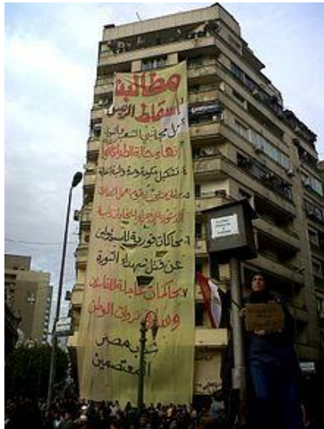
لافتة كتب عليها المطالب التي يطلبها المحتجون