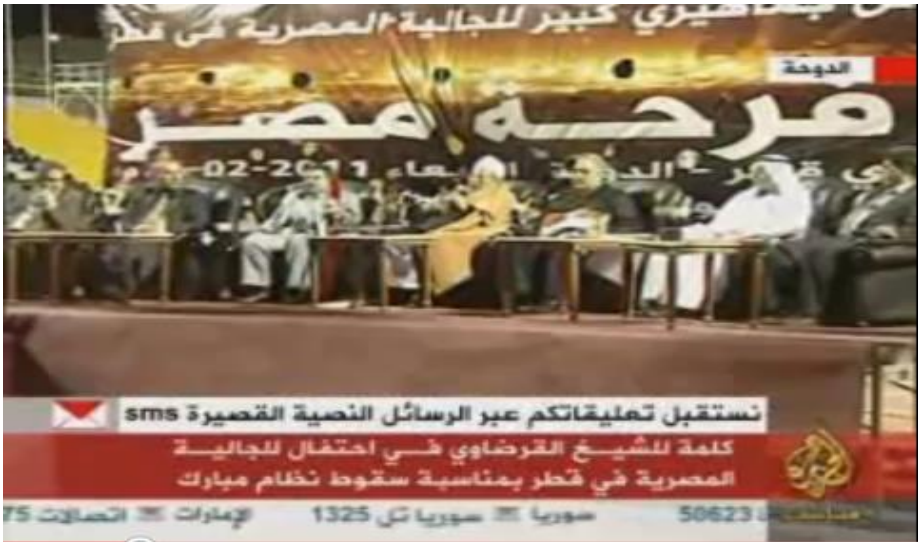
الشيخ القرضاوي في المهرجان الذي أقامته الجالية المصرية في قطر بعنوان (فرحة مصر) 16 فبراير 2011م ونقلته قناة الجزيرة مباشر