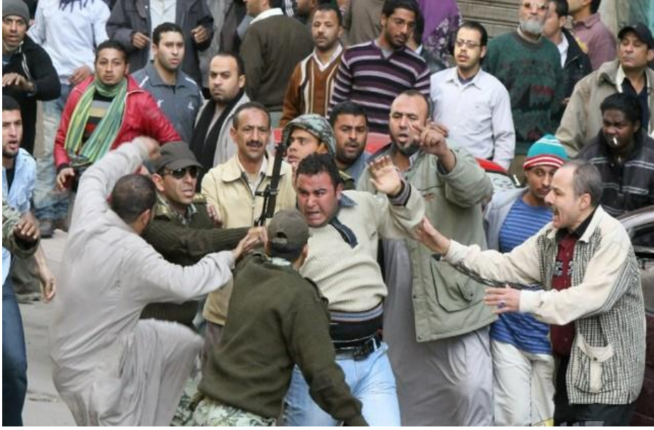
القبض على أحد الباطنية وتسليمه للجيش