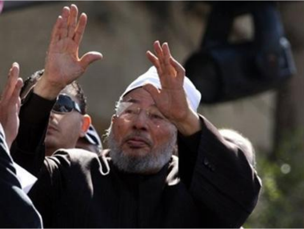
الشيخ القرضاوي يحيي الشباب ويحيوه، وقد استمرت هذه التحية لدقائق