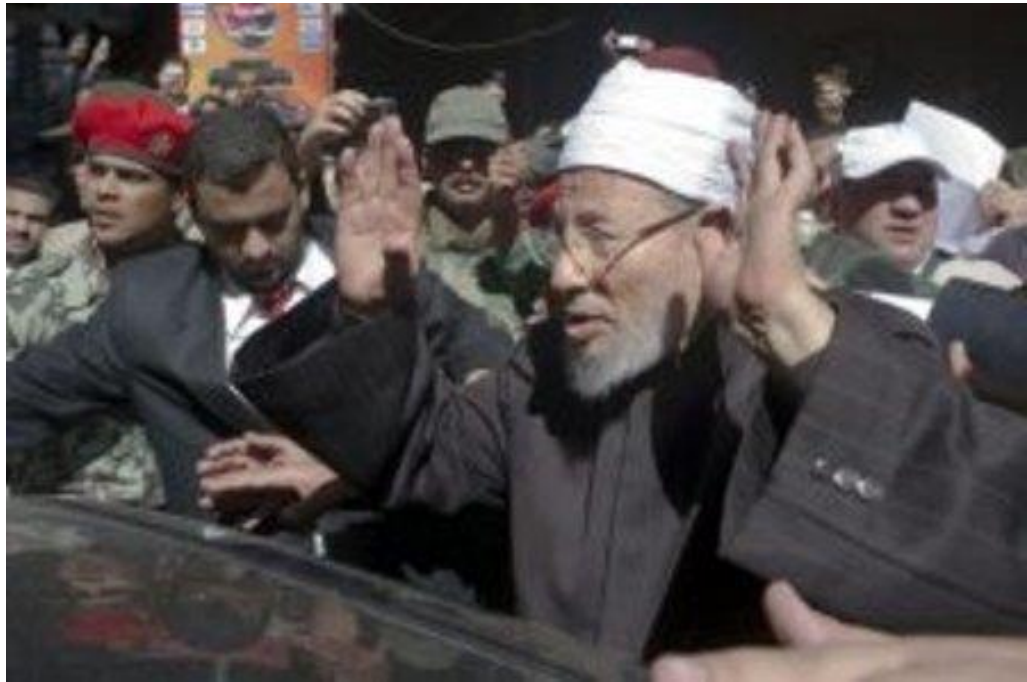
كانت جمعة النصر يوم 19 فبراير 2011م