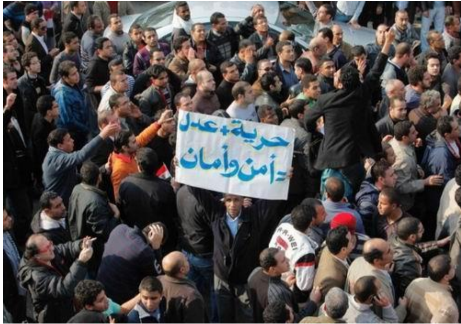
الثورة في بدايتها مظاهرة سلمية تنادي بالحرية والعدالة